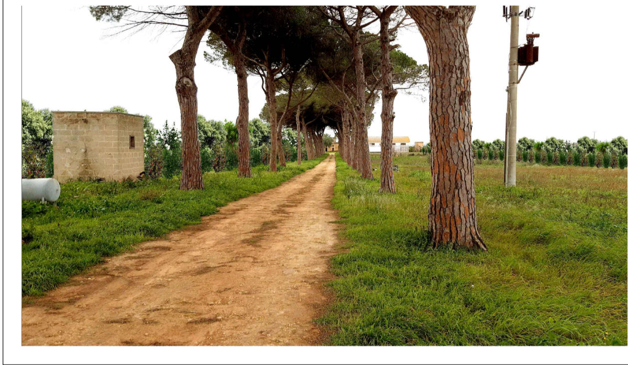
FOTOINSERIMENTO 3 - STATO DI PROGETTO