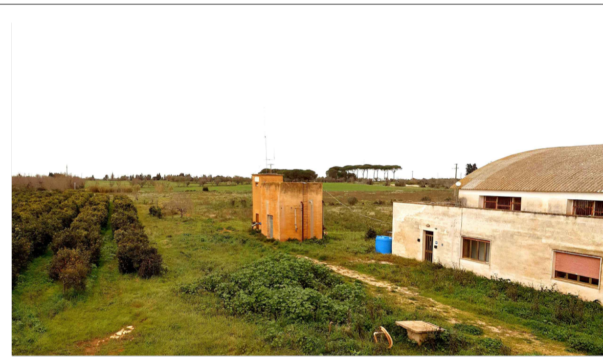
FOTOINSERIMENTO 5 - STATO DI FATTO