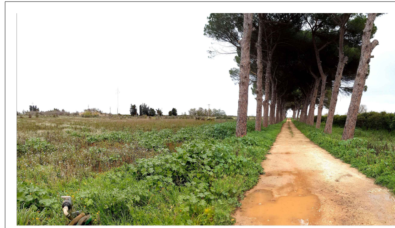
FOTOINSERIMENTO 4 - STATO DI FATTO