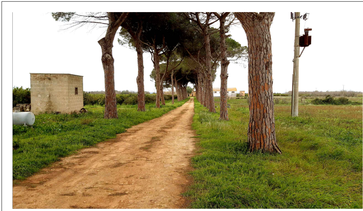
FOTOINSERIMENTO 3 - STATO DI FATTO