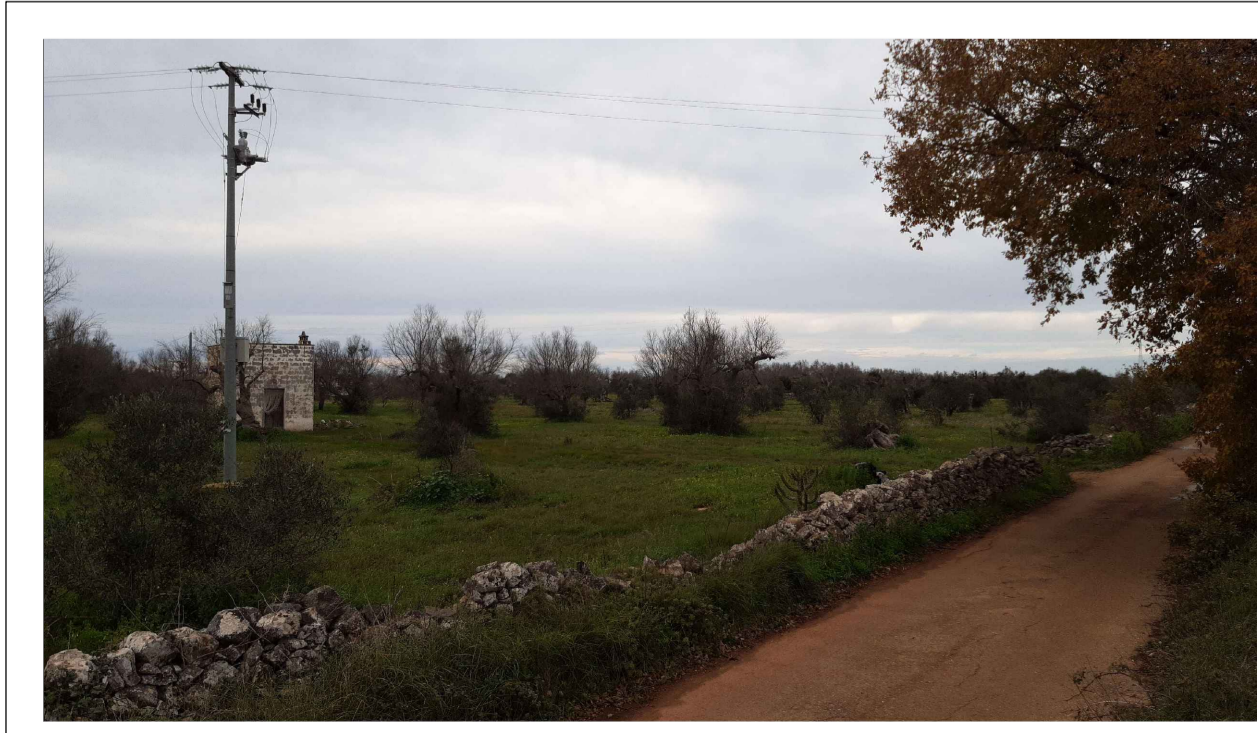
PUNTO DI PRESA FOTOGRAFICA 9