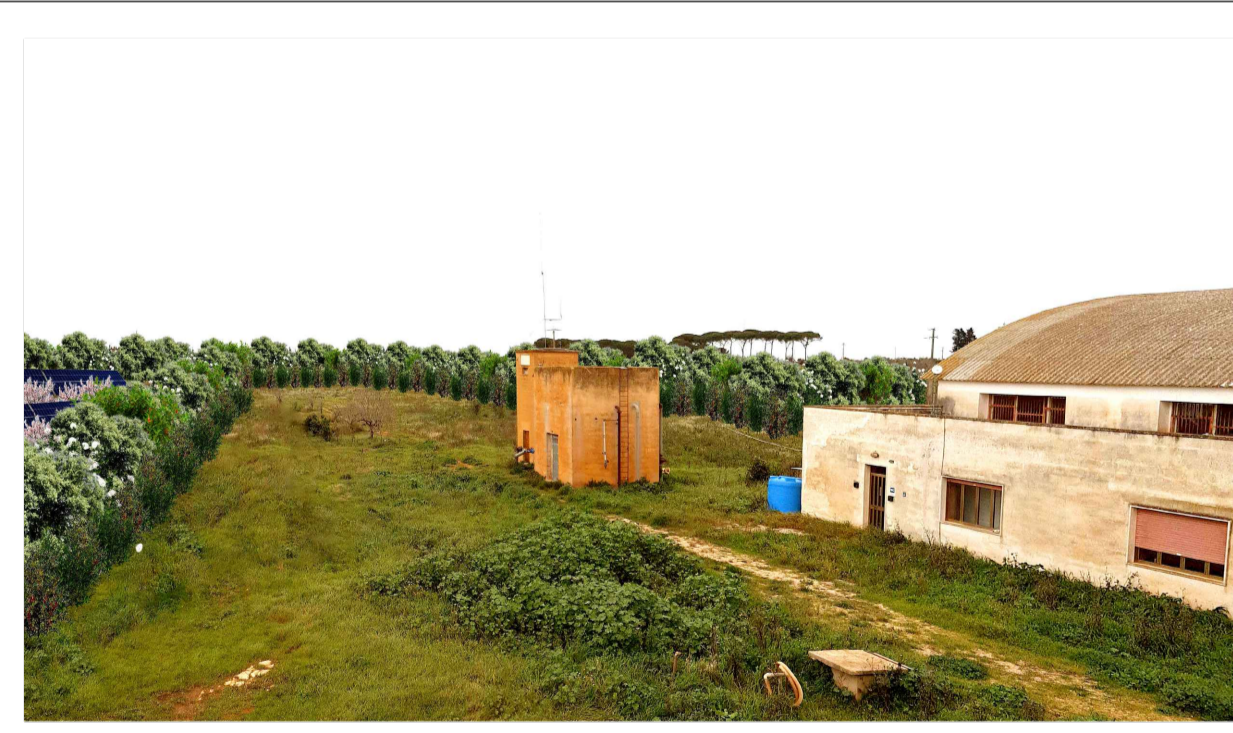
FOTOINSERIMENTO 5 - STATO DI PROGETTO