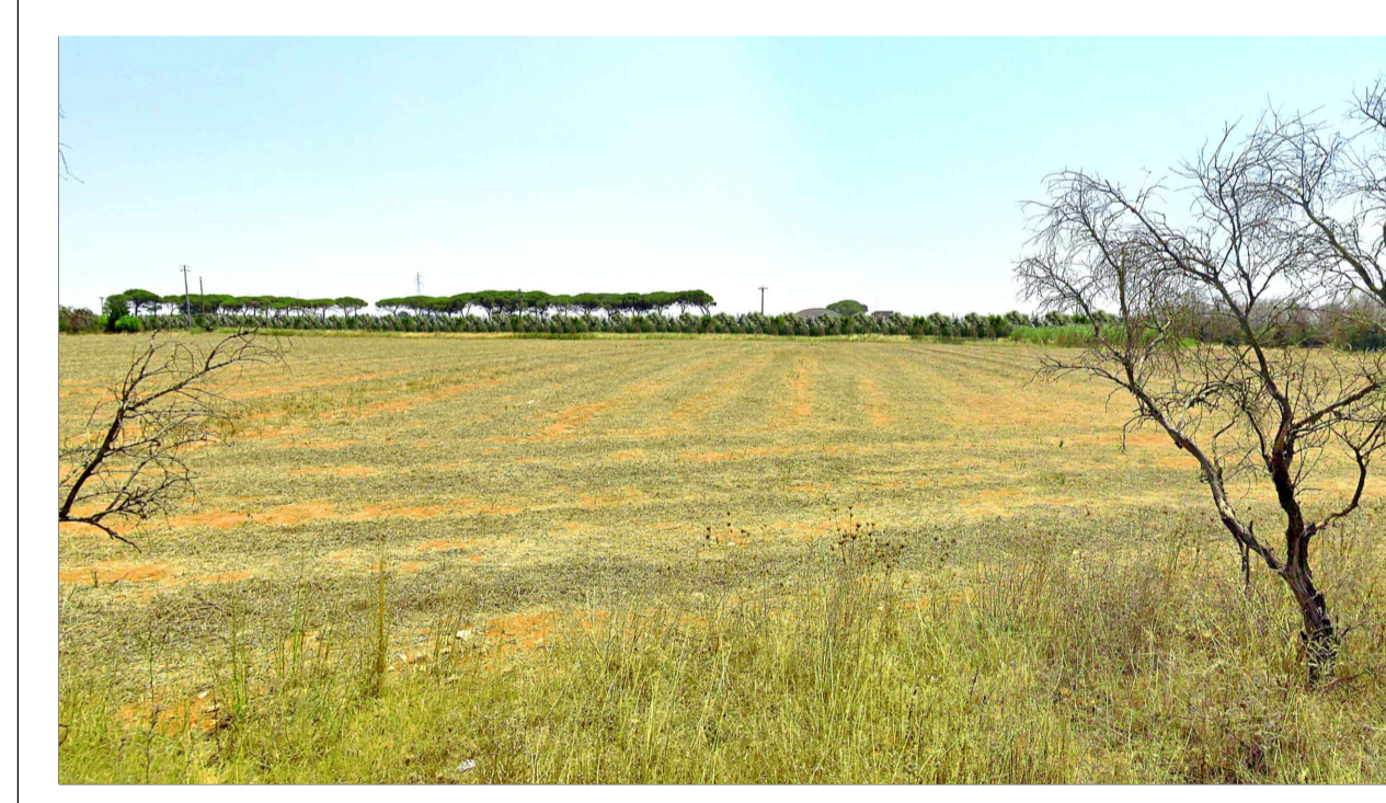
FOTOINSERIMENTO 7 - STATO DI PROGETTO