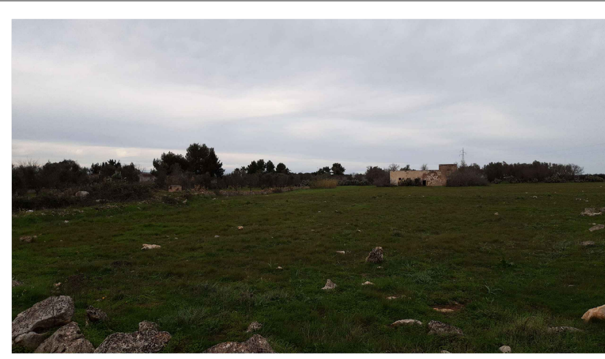
PUNTO DI PRESA FOTOGRAFICA 8