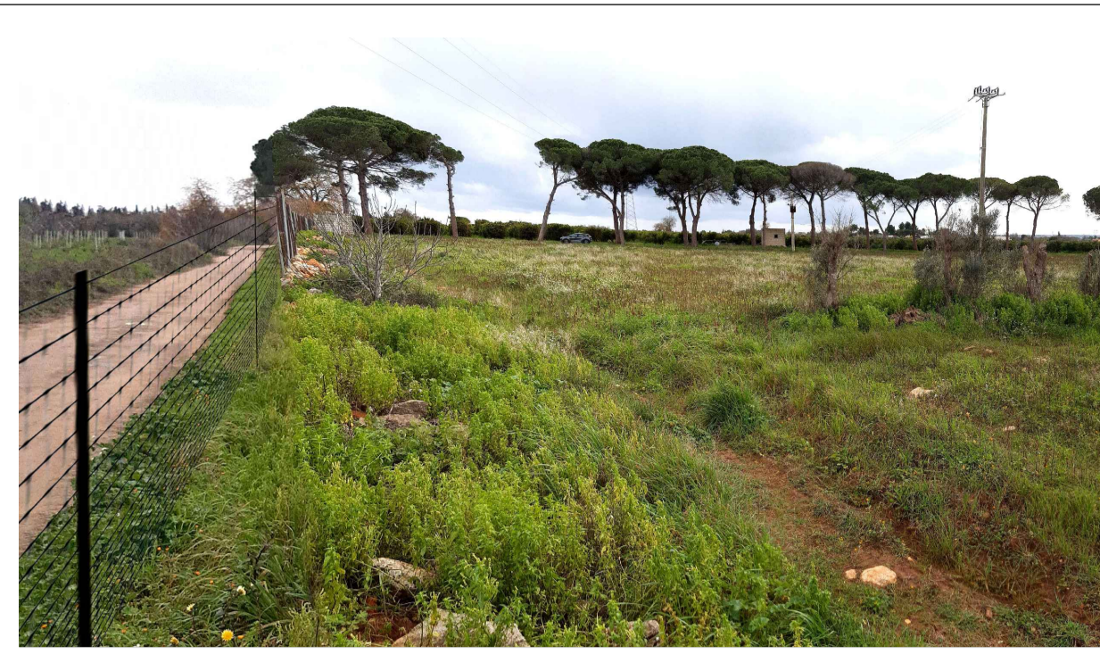
FOTOINSERIMENTO 2 - STATO DI FATTO