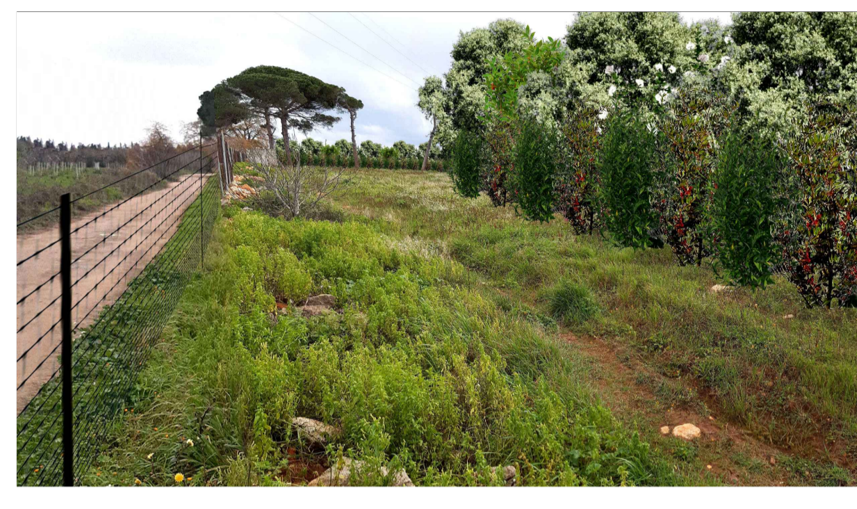
FOTOINSERIMENTO 2 - STATO DI PROGETTO