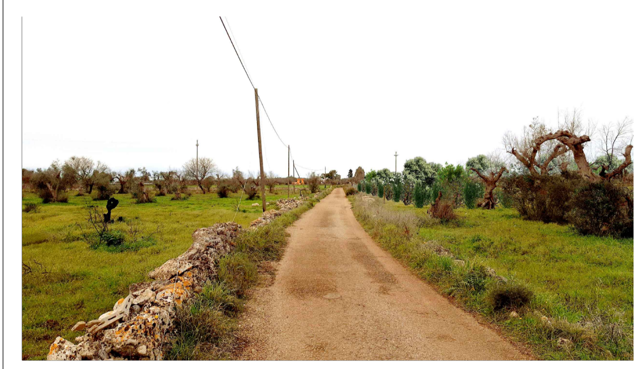
FOTOINSERIMENTO 6 - STATO DI PROGETTO