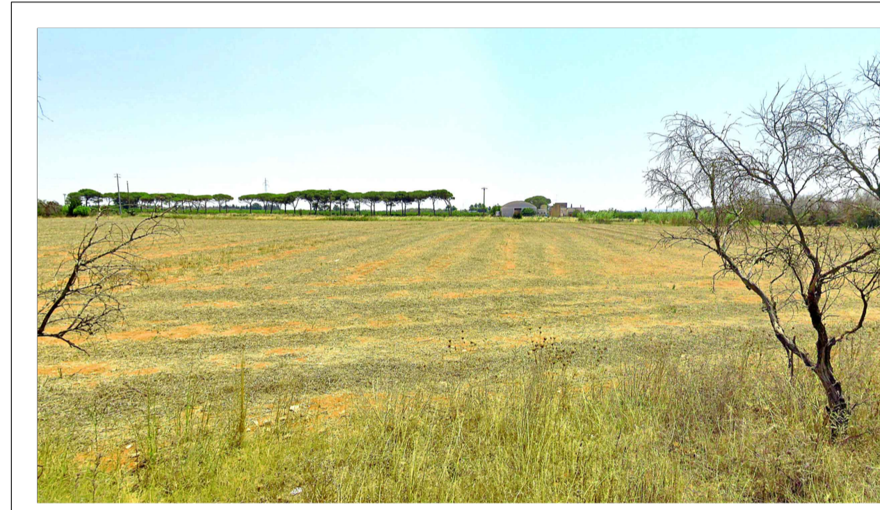
FOTOINSERIMENTO 7 - STATO DI FATTO