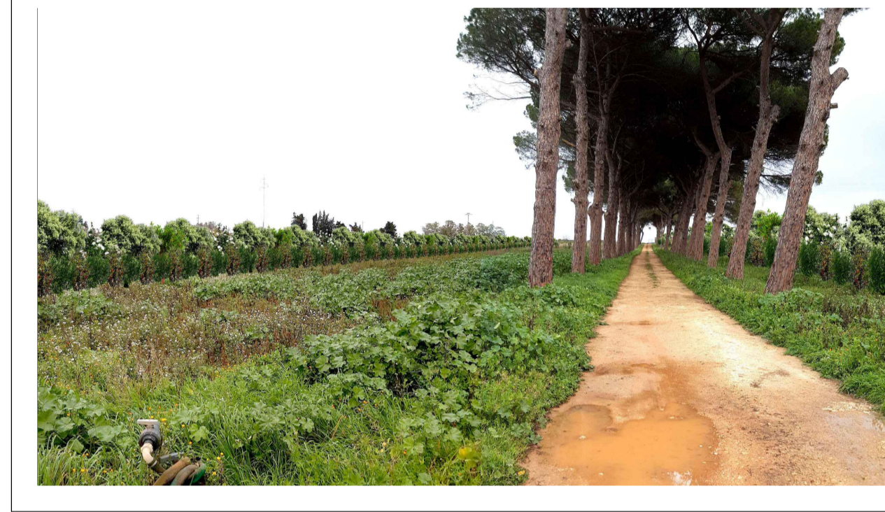
FOTOINSERIMENTO 4 - STATO DI PROGETTO