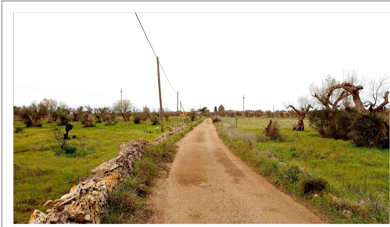
FOTOINSERIMENTO 6 - STATO DI FATTO