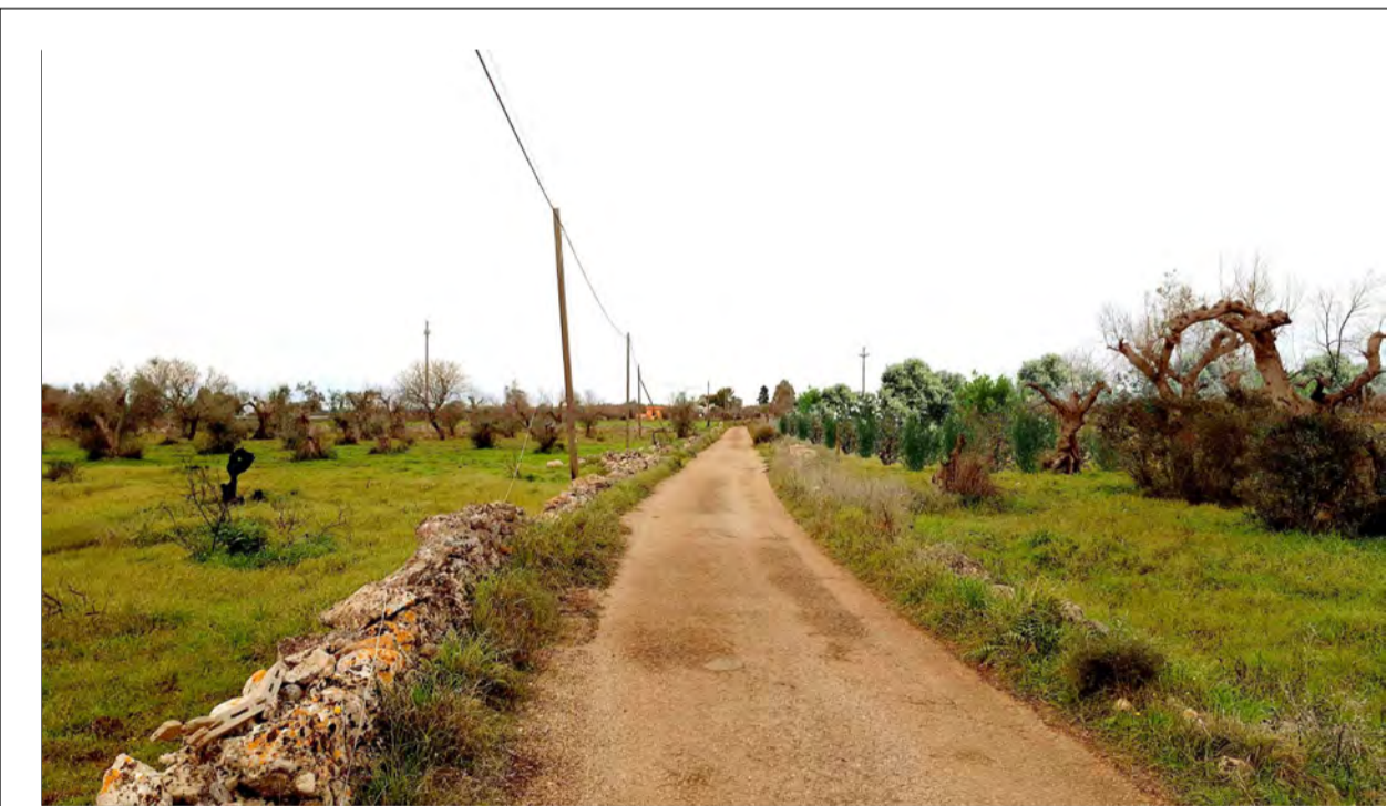
FOTOINSERIMENTO 6 - STATO DI PROGETTO