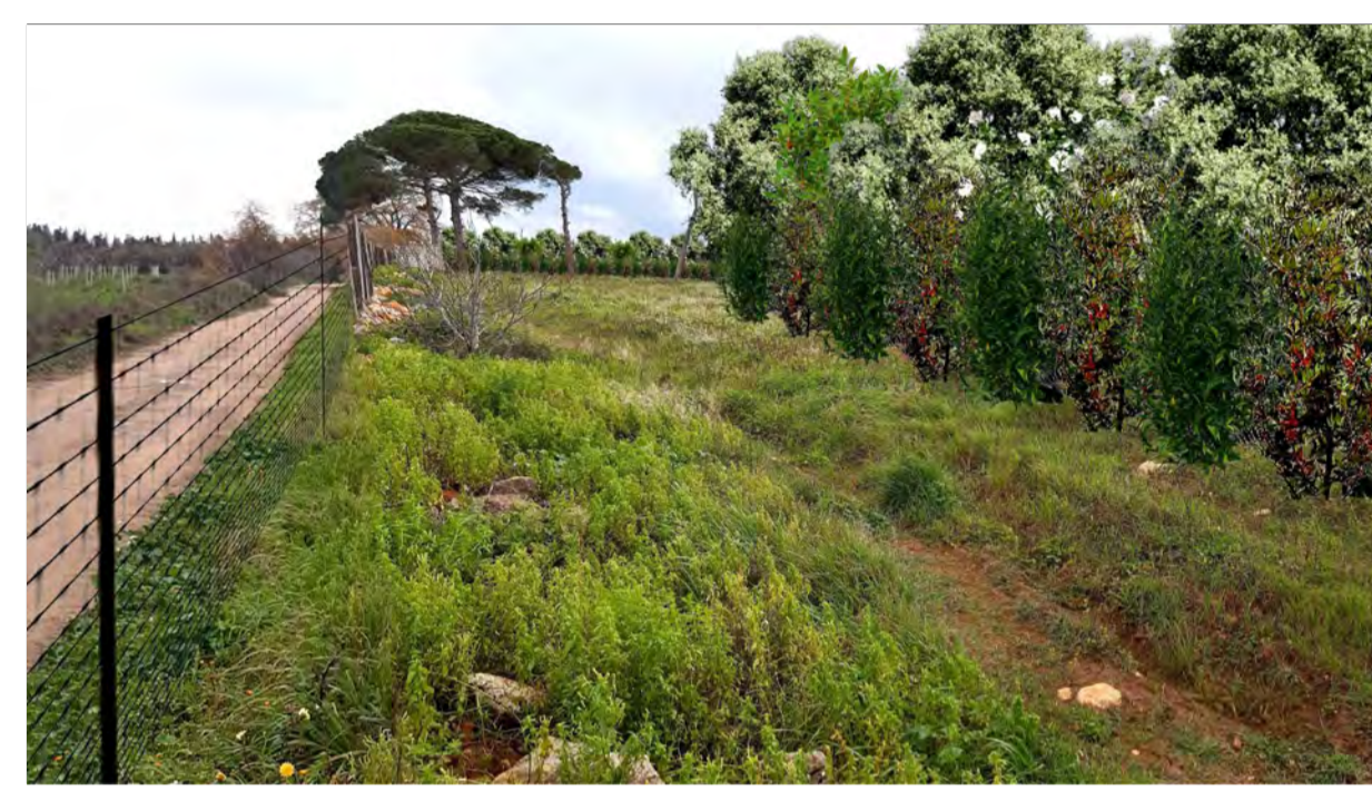
FOTOINSERIMENTO 2 - STATO DI PROGETTO