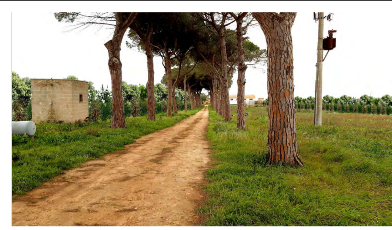
FOTOINSERIMENTO 3 - STATO DI PROGETTO