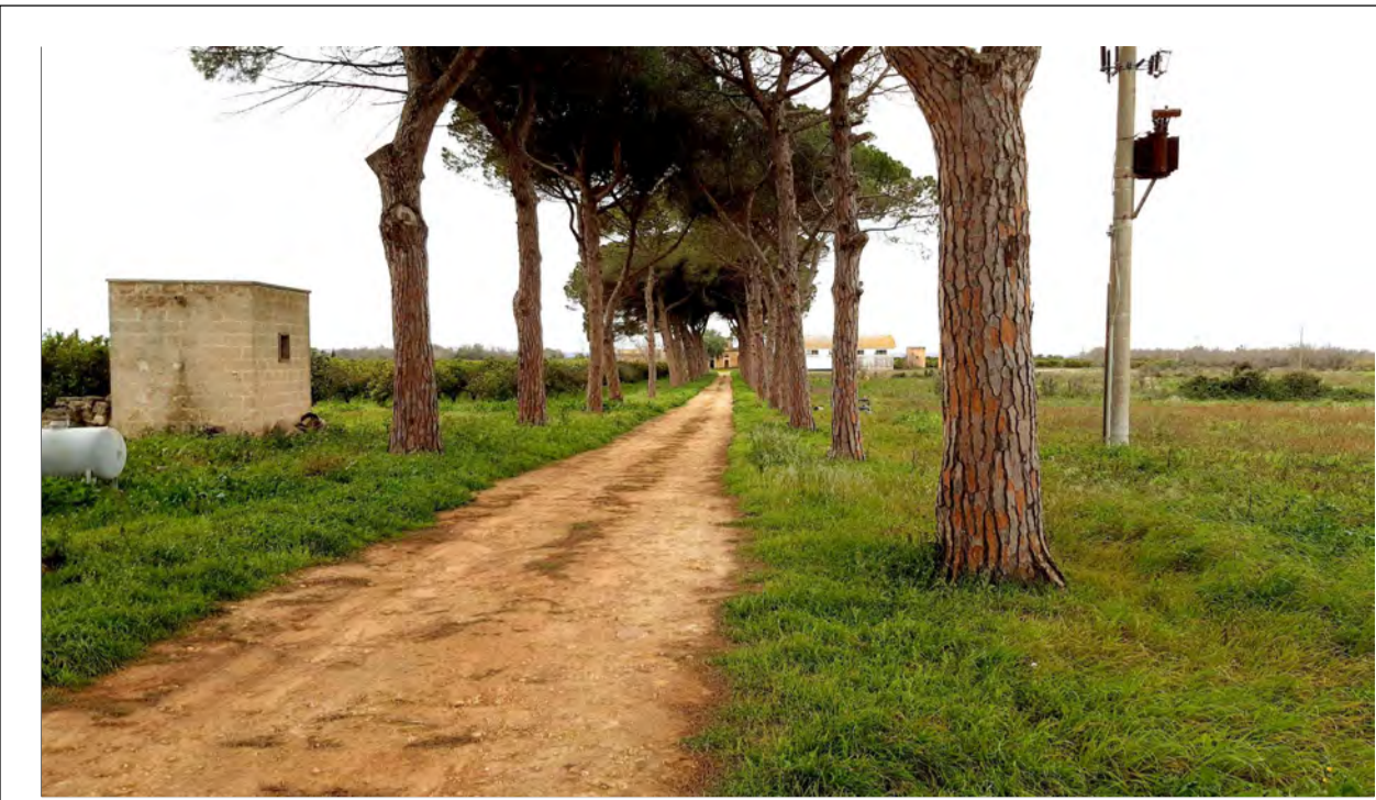
FOTOINSERIMENTO 3 - STATO DI FATTO