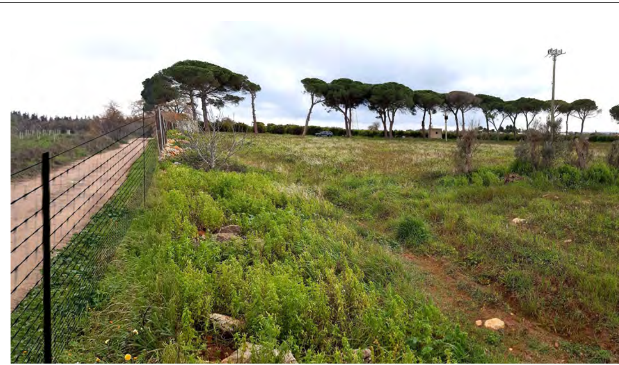
FOTOINSERIMENTO 2 - STATO DI FATTO