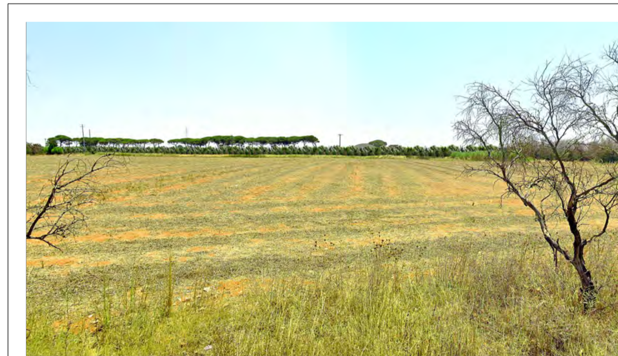
FOTOINSERIMENTO 7 - STATO DI PROGETTO