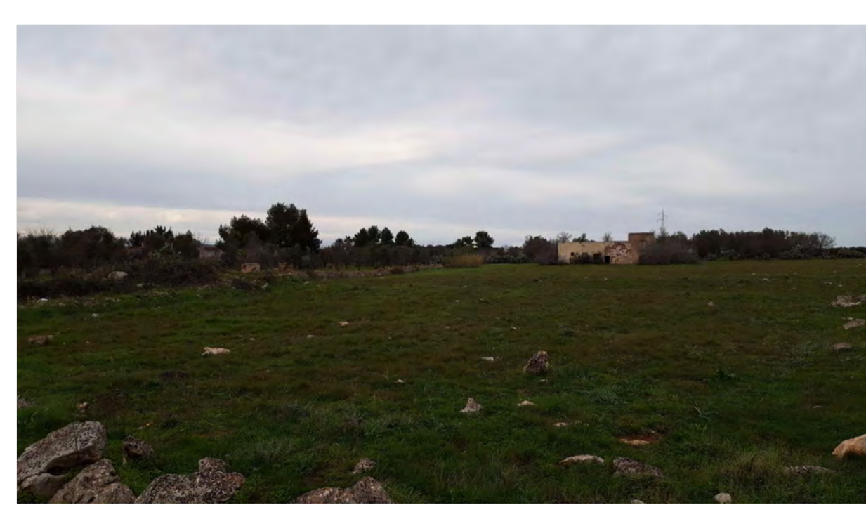
PUNTO DI PRESA FOTOGRAFICA 8