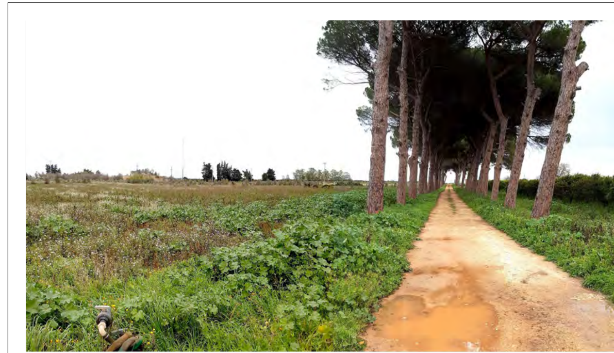
FOTOINSERIMENTO 4 - STATO DI FATTO