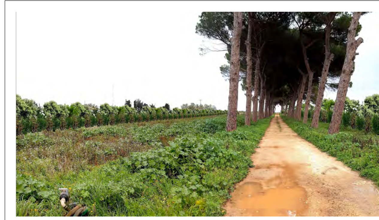
FOTOINSERIMENTO 4 - STATO DI PROGETTO