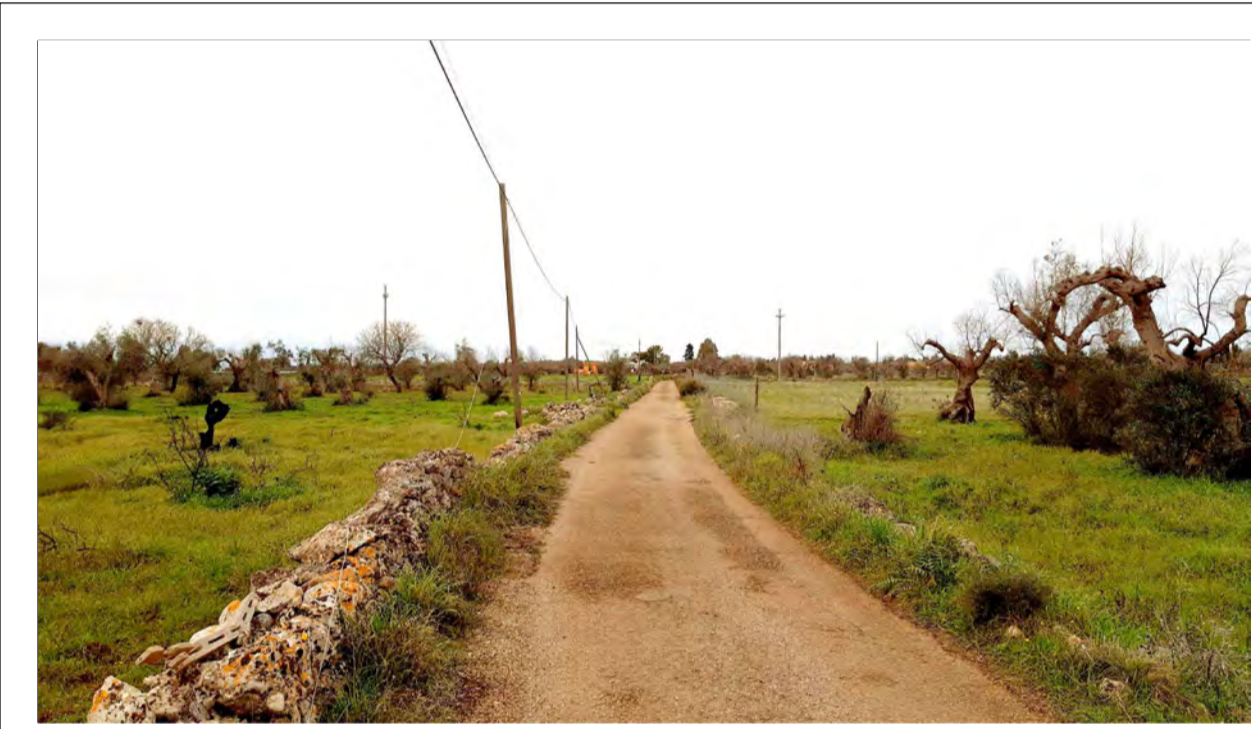
FOTOINSERIMENTO 6 - STATO DI FATTO