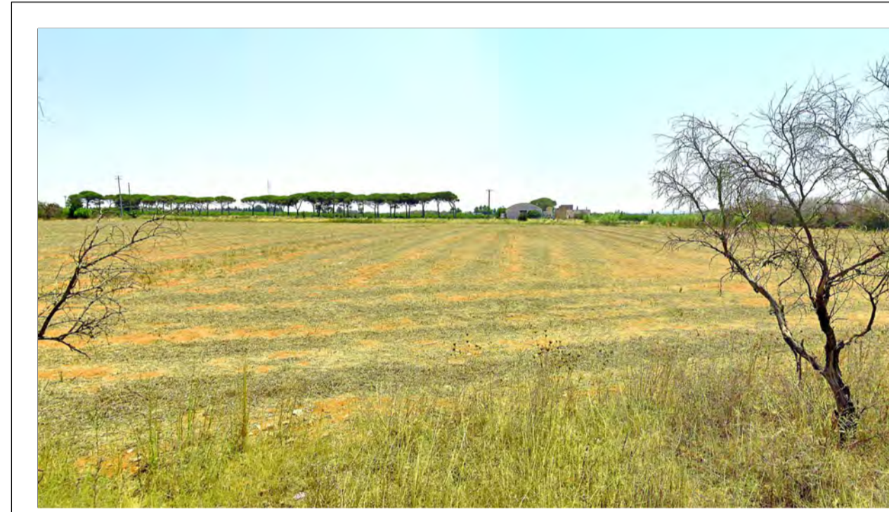
FOTOINSERIMENTO 7 - STATO DI FATTO