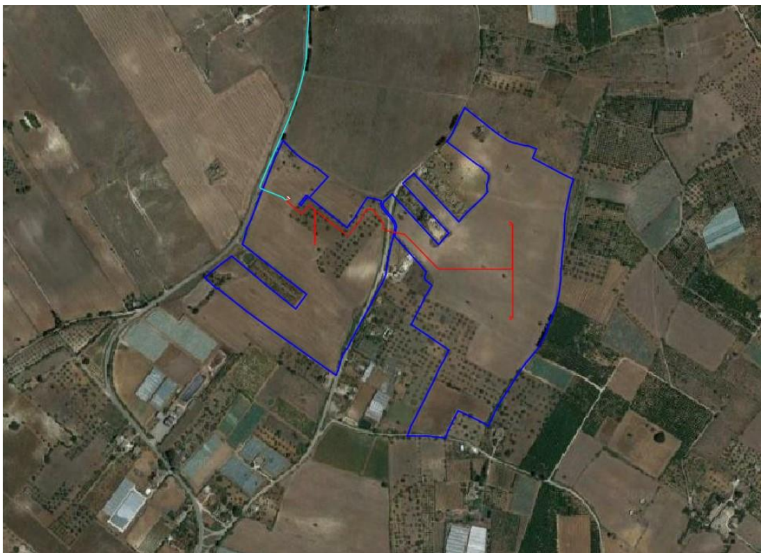
5. Vista satellitare ubicazione impianto FV 4