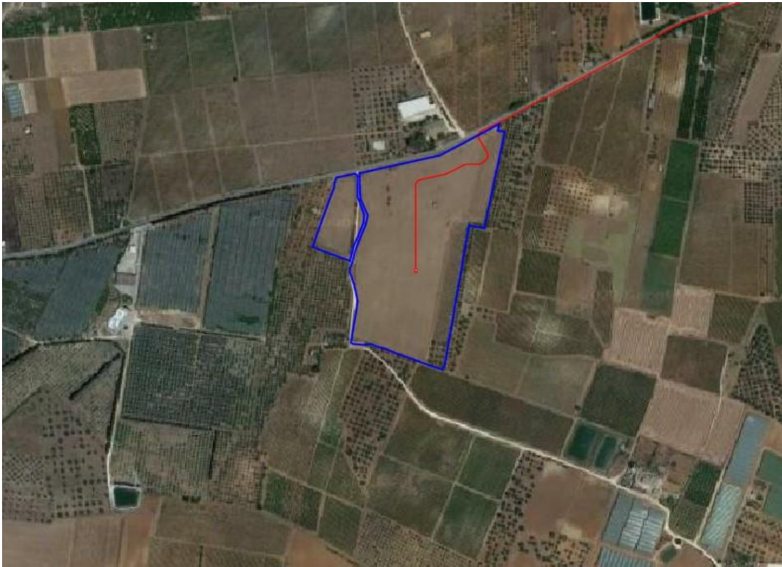
3. Vista satellitare ubicazione impianto FV 2