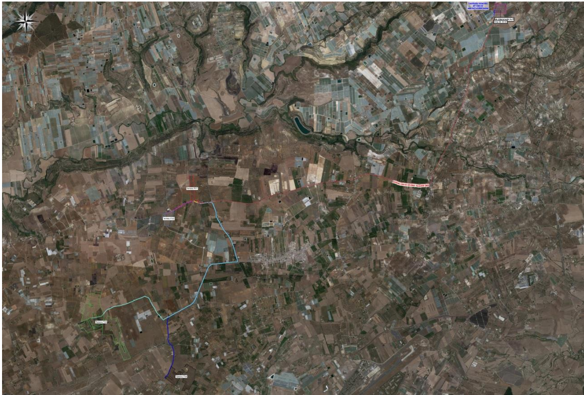
1. Vista satellitare generale ubicazione impianti