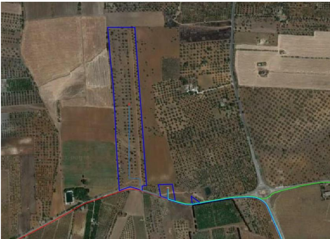
2. Vista satellitare ubicazione impianto FV 1