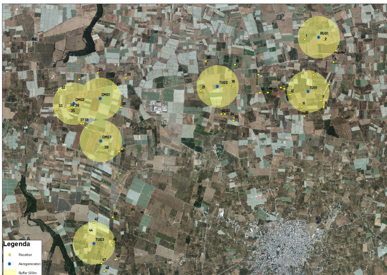
Individuazione dei possibili recettori

Al fine di individuare i recettori sensibili da considerare negli studi specialistici (valutazione di impatto acustico, calcolo della gittata, shadow flickering ecc.), gli scriventi hanno provveduto a eseguire una attività di censimento nell'area del parco eolico in progetto, considerando un intorno dall'asse di ciascun aerogeneratore pari a 500 m. Di seguito, si riporta uno stralcio cartografico su ortofoto con l'individuazione dei possibili recettori sensibili.