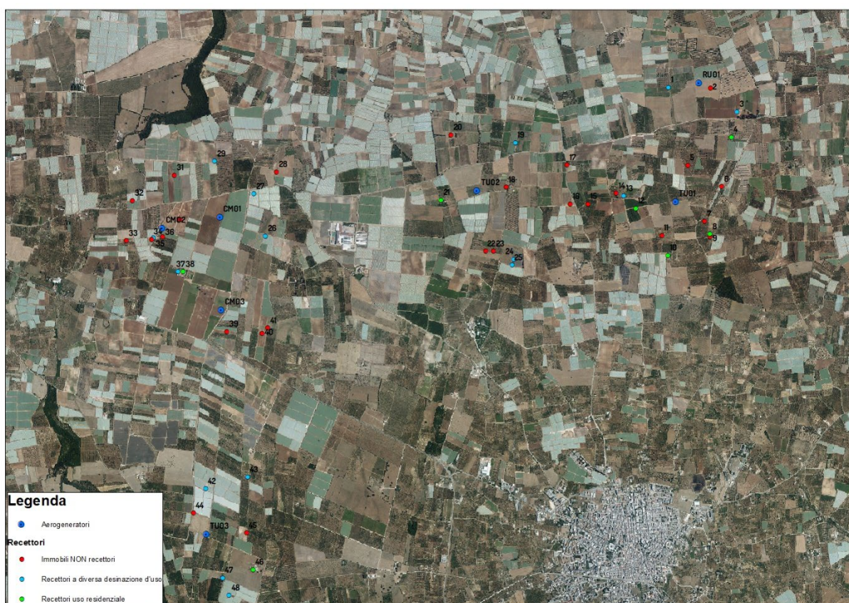
Classificazione dei possibili recettori sensibili

Si sottolinea che, come verificabile nella Figura che segue, sono presenti recettori sensibili di tipo residenziale in un intorno di 500 m dall'asse dell'aerogeneratore, solo per gli aerogeneratori denominati TU1 e TU02.