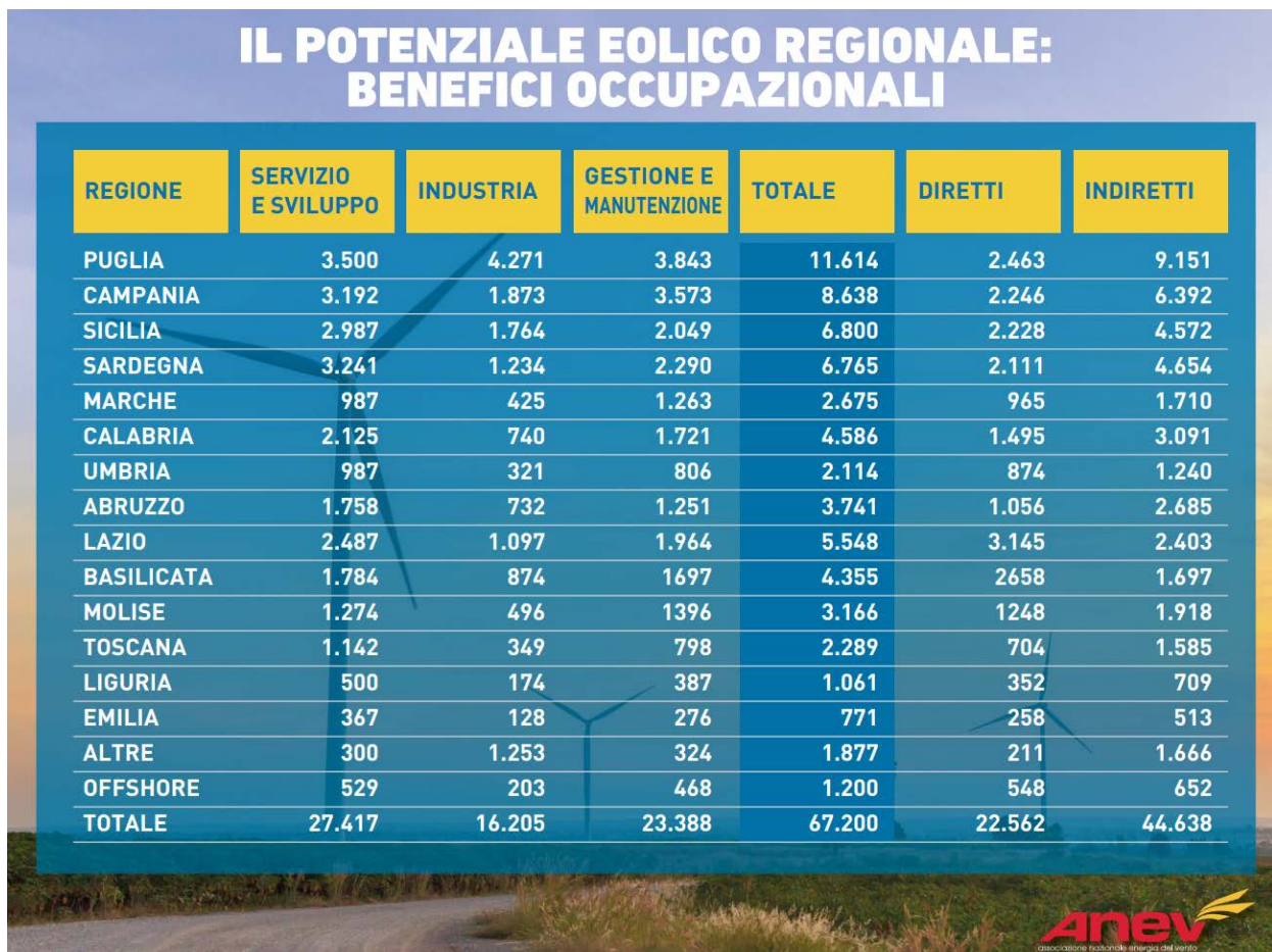
Figura 1 Dati occupazionali

Tale studio, si è posto come obiettivo quello di delineare lo scenario relativamente alle potenzialità del settore eolico al 2030 sia in termini di produzione che di ricadute occupazionali. Se il numero degli occupati alla fine del 2016 contava 28.942 unità, si stima che entro il 2030 il numero di posti di lavoro sarà più che raddoppiato. Infatti, entro il 2030, si prevede un numero complessivo di lavoratori pari a 67.200 unità in tutto il territorio nazionale, di cui un terzo di occupati diretti (22.562) e due terzi di occupati dell'indotto (44.608).