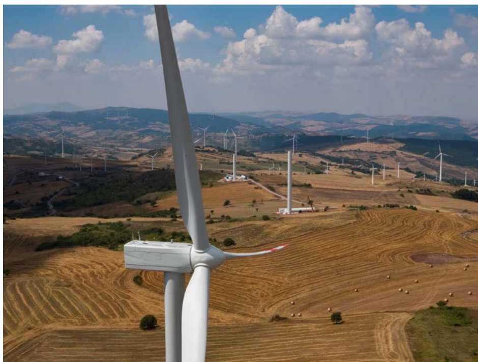
Figura 3 Esempi di parchi eolici in Basilicata nel contesto agricolo

La realizzazione del parco eolico non mostra nessun elemento di contrasto con le attività tradizionali, agricoltura e/o allevamento: la minima occupazione di suolo, degli aerogeneratori e delle infrastrutture civili associate, in larga parte già esistenti (in particolare la strada di accesso al sito), consente di mantenere inalterato lo svolgimento delle attività preesistenti.