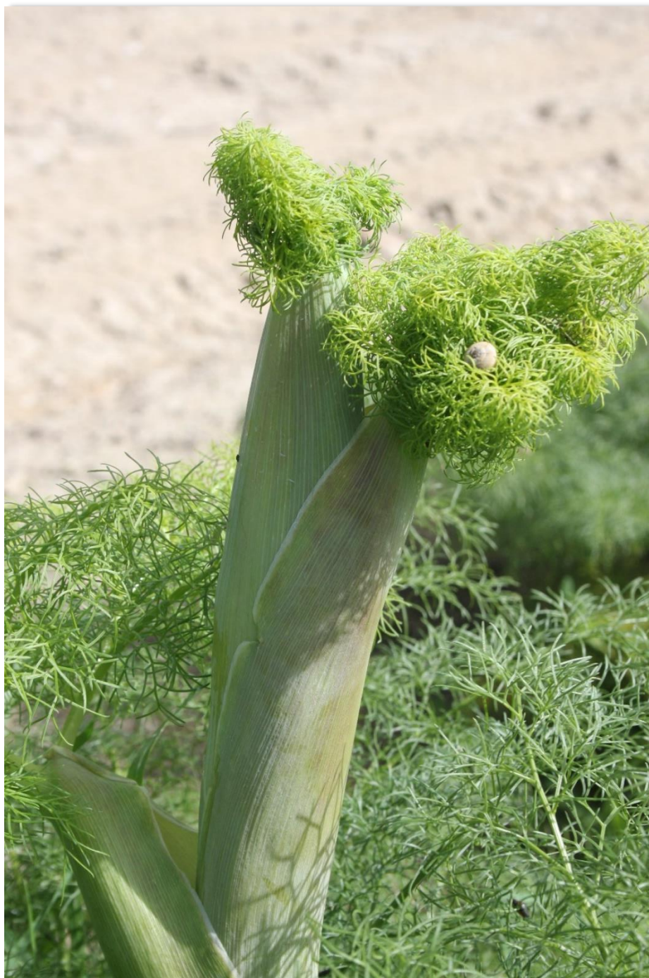
Figura 1: Ferula communis , presente nella porzione in prossimità della strada nel Lotto Nord.