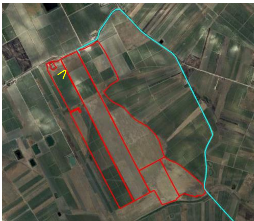
Figura 5: Area di progetto Nord con alcuni dei vigneti presenti. Il cono ottico in giallo indica il punto in cui è stata scattata la foto.