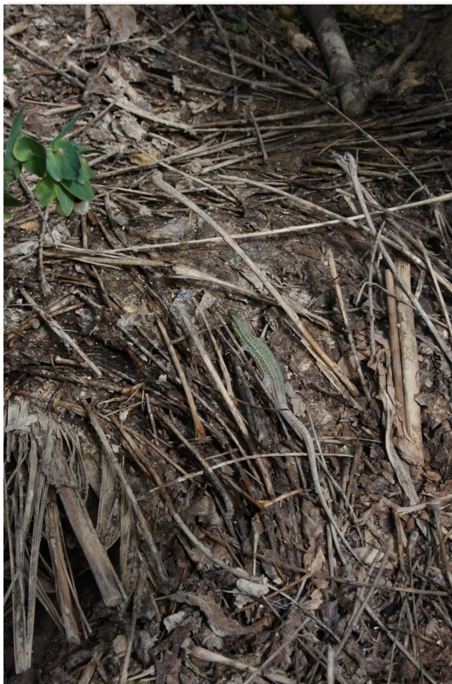
Figura 8: Organismo appartenente alla famiglia dei Lacertidae , ordine Squamata .