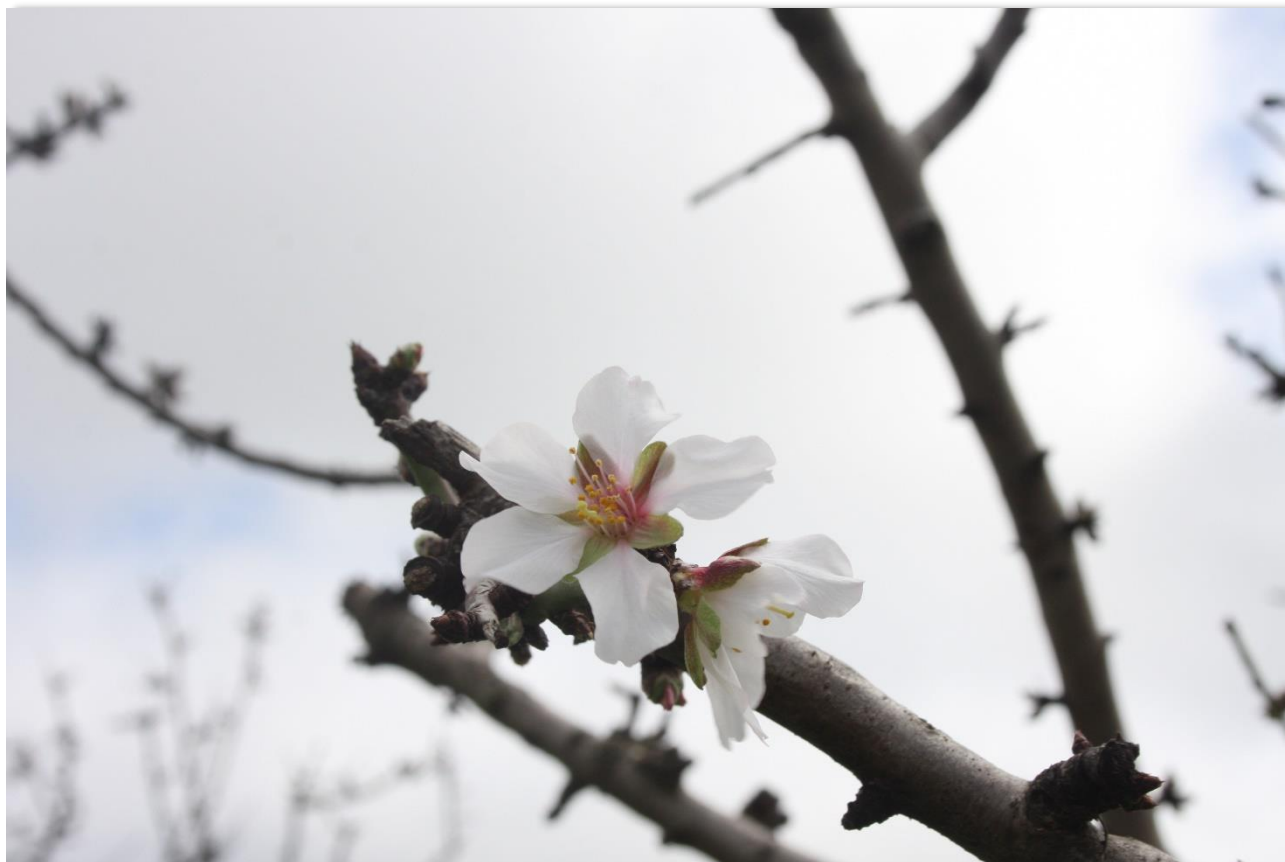
Figura 13: Prunus dulcis , fioritura del mandorlo.