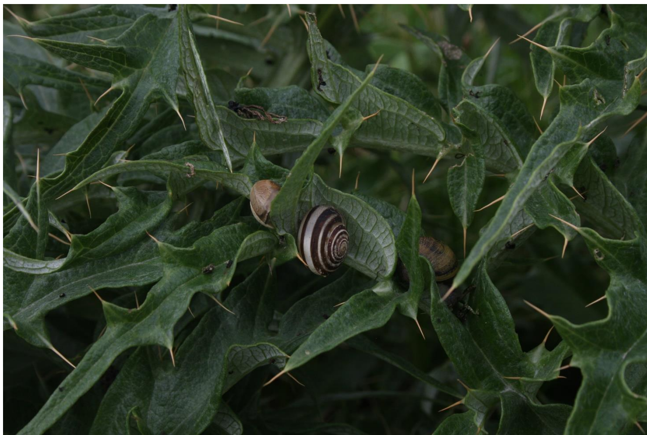
Figura 12: Eobania vermiculata , mollusco gasteropode.