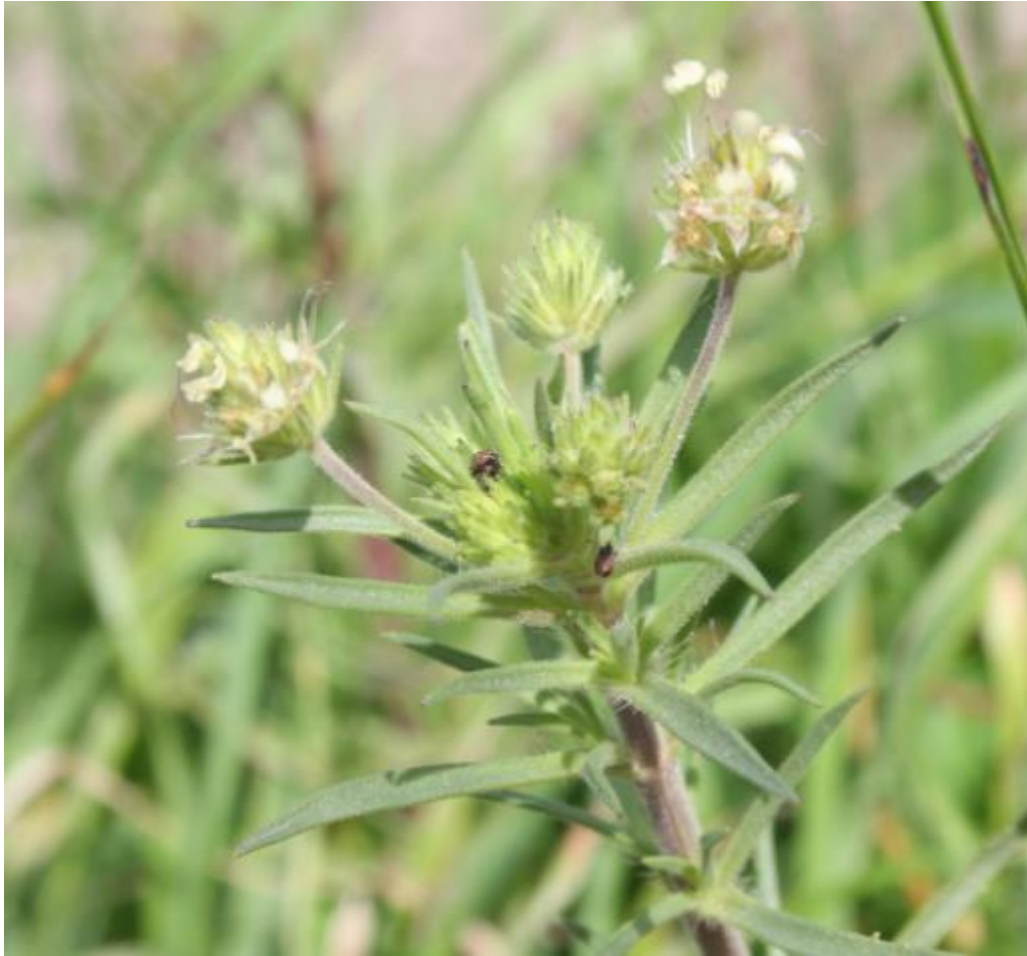
Figura 3: Plantago afra.