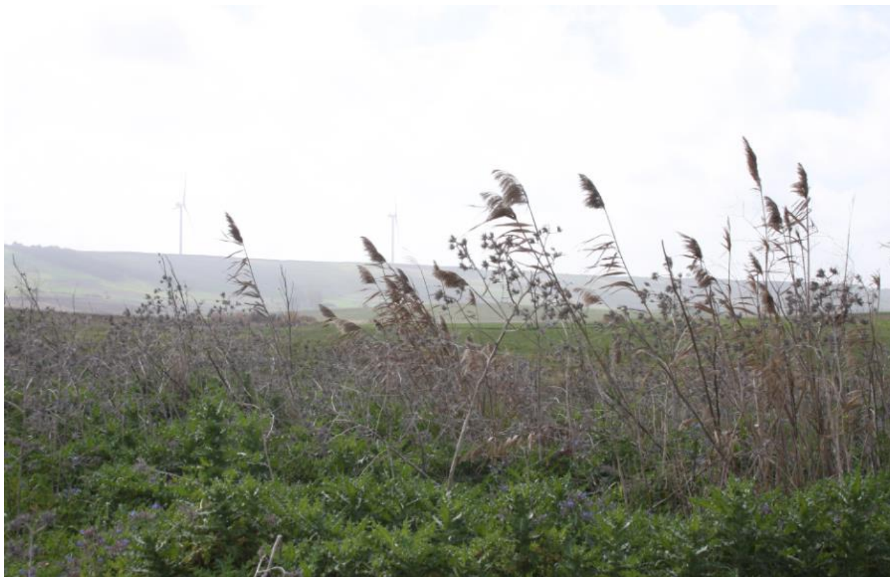
Figura 6: Phragmites australis , pianta che compone la tipica vegetazione ripariale in corrispondenza dei punti di deflusso idrico.