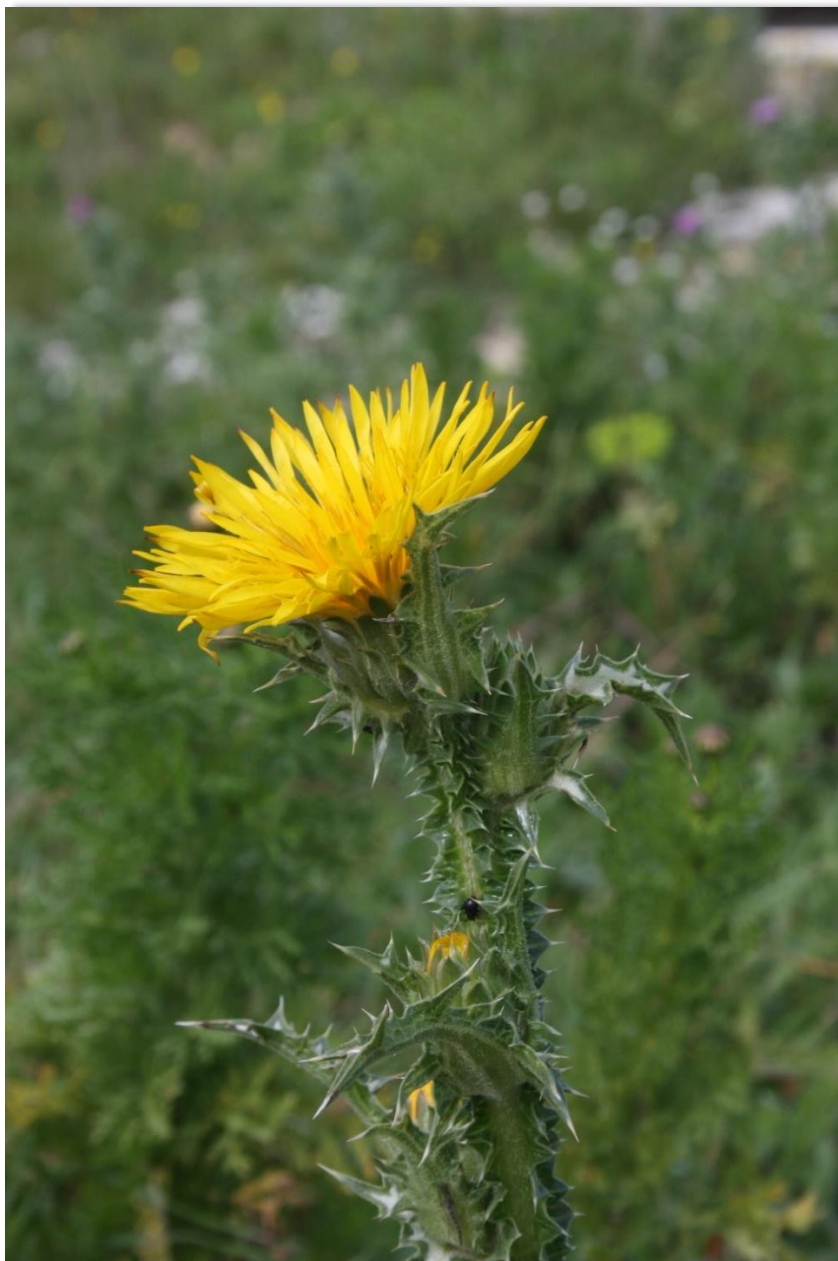
Figura 4: Scolymus grandiflorus.