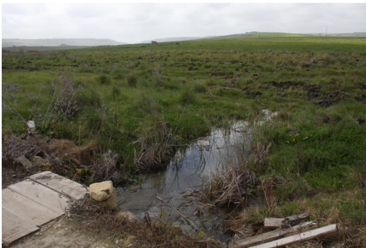
Figura 10: impluvio presente nell'area di progetto Nord.