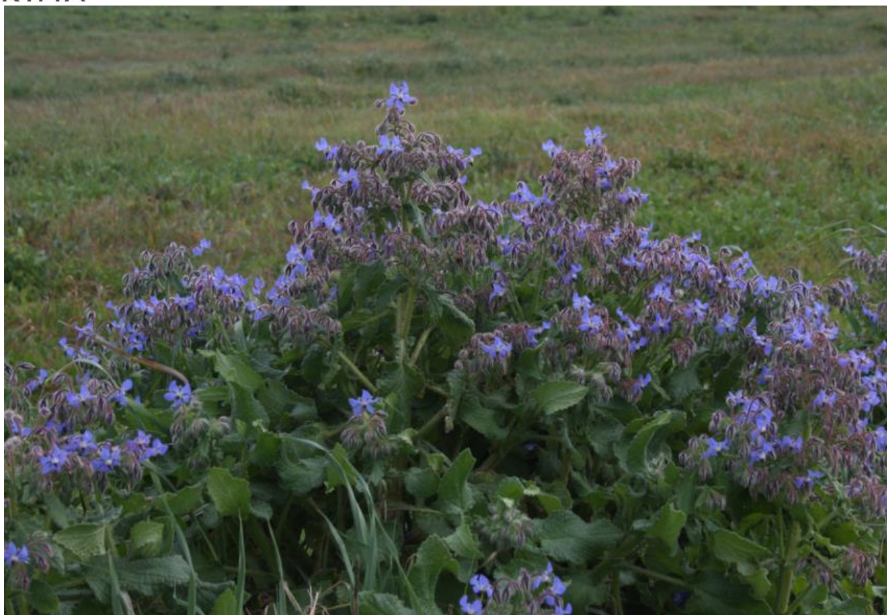
Figura 11: Borago officinalis.