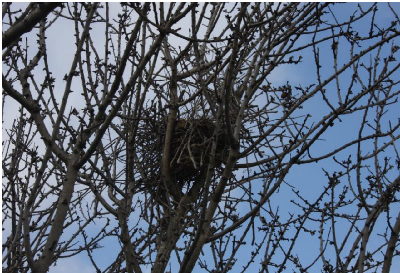
Figura 15: nido presente sui rami di mandorlo.