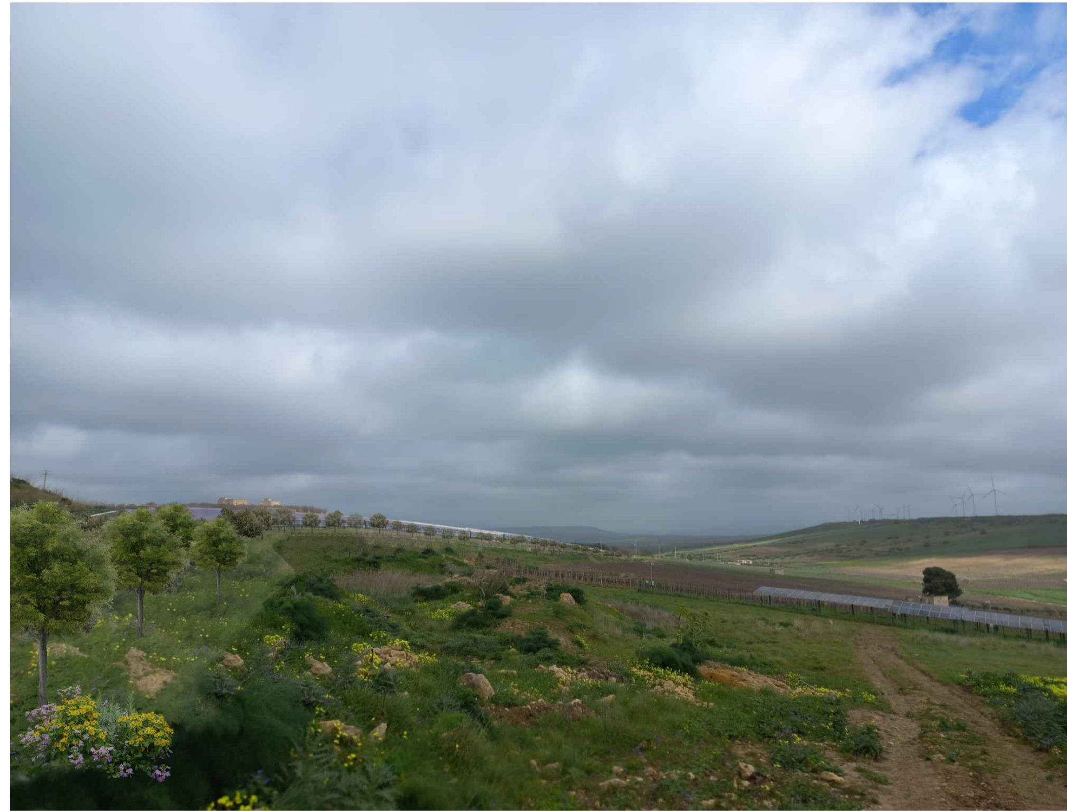
VISTA 1 STATO DI PROGETTO