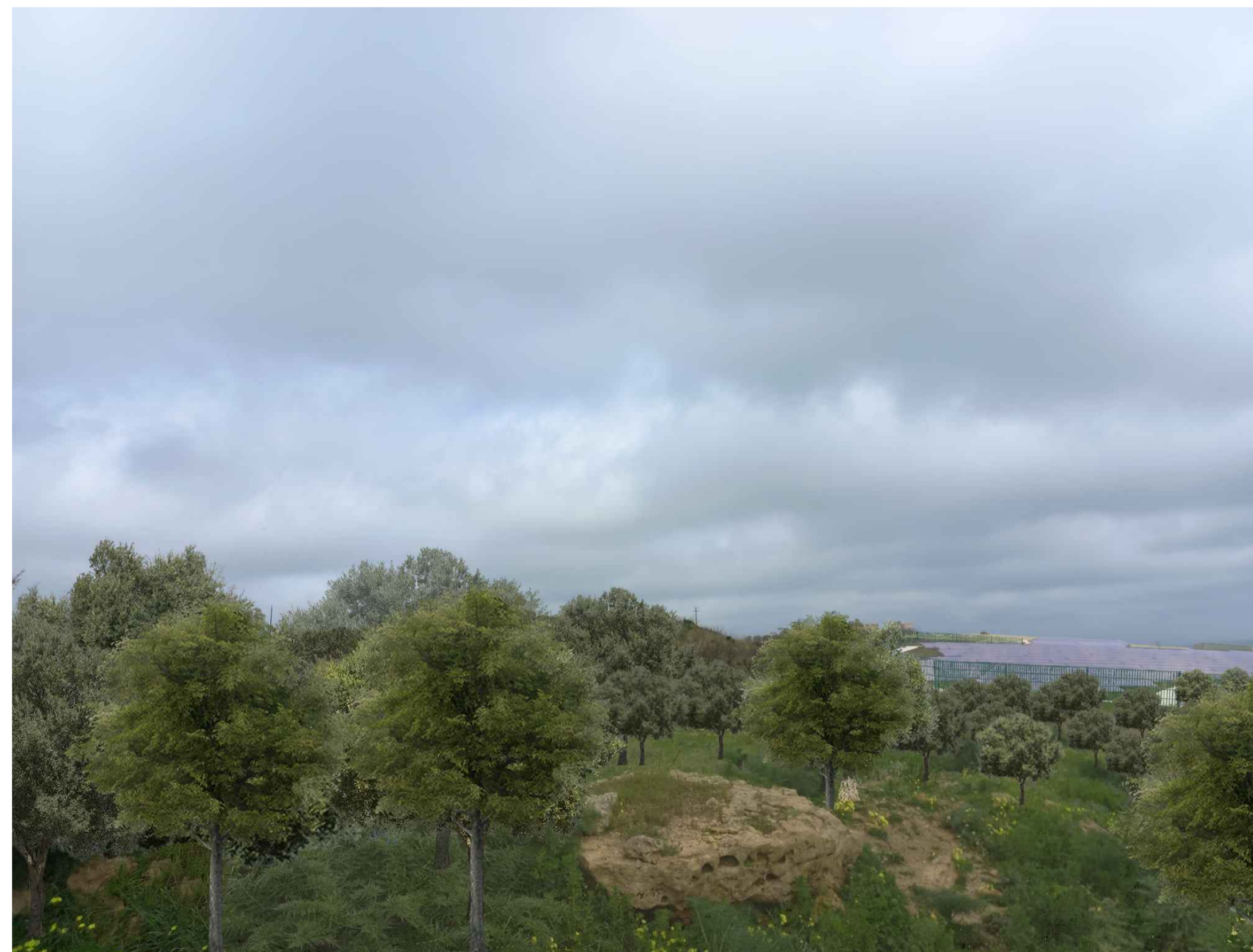
VISTA 2 STATO DI PROGETTO