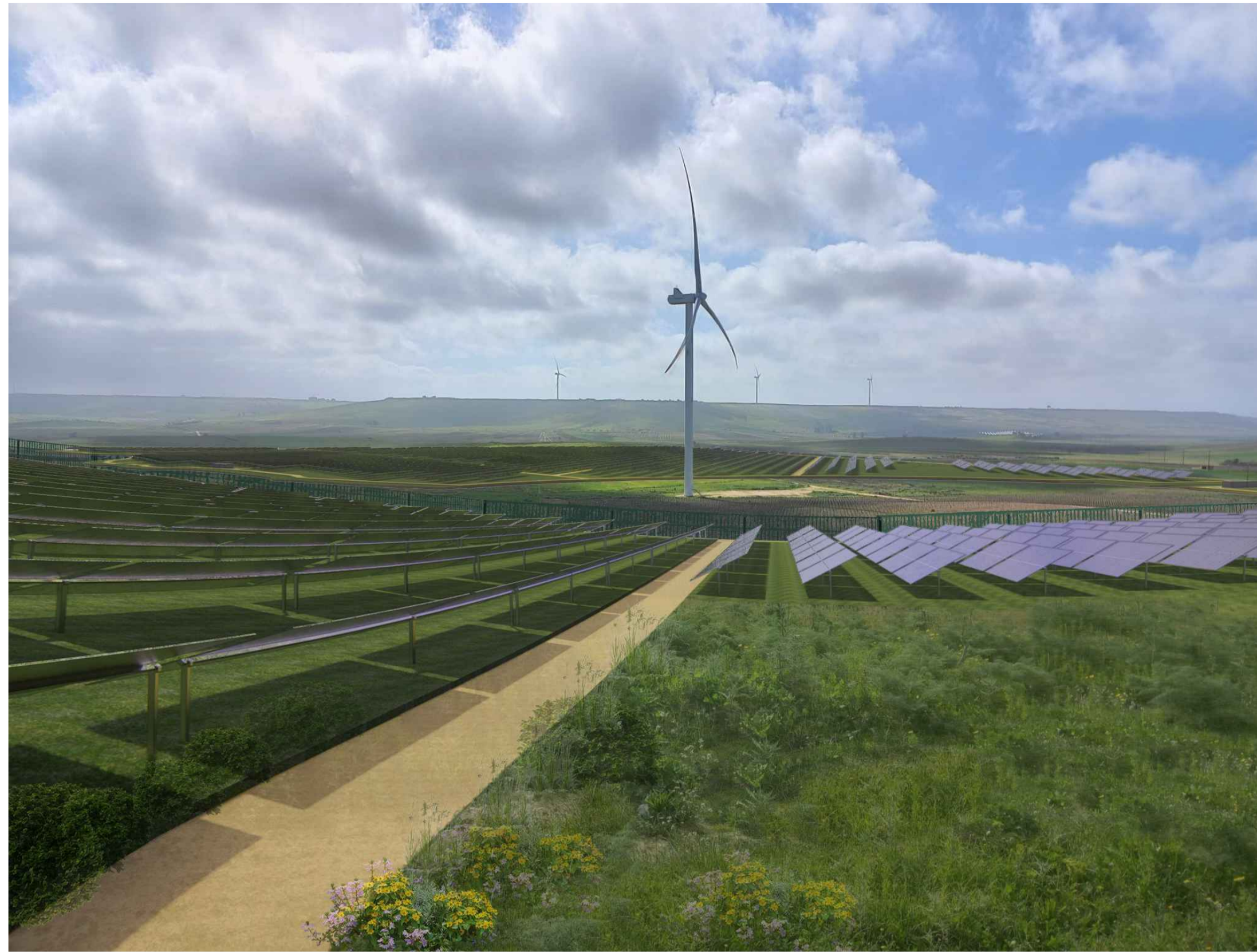
VISTA 2 STATO DI PROGETTO