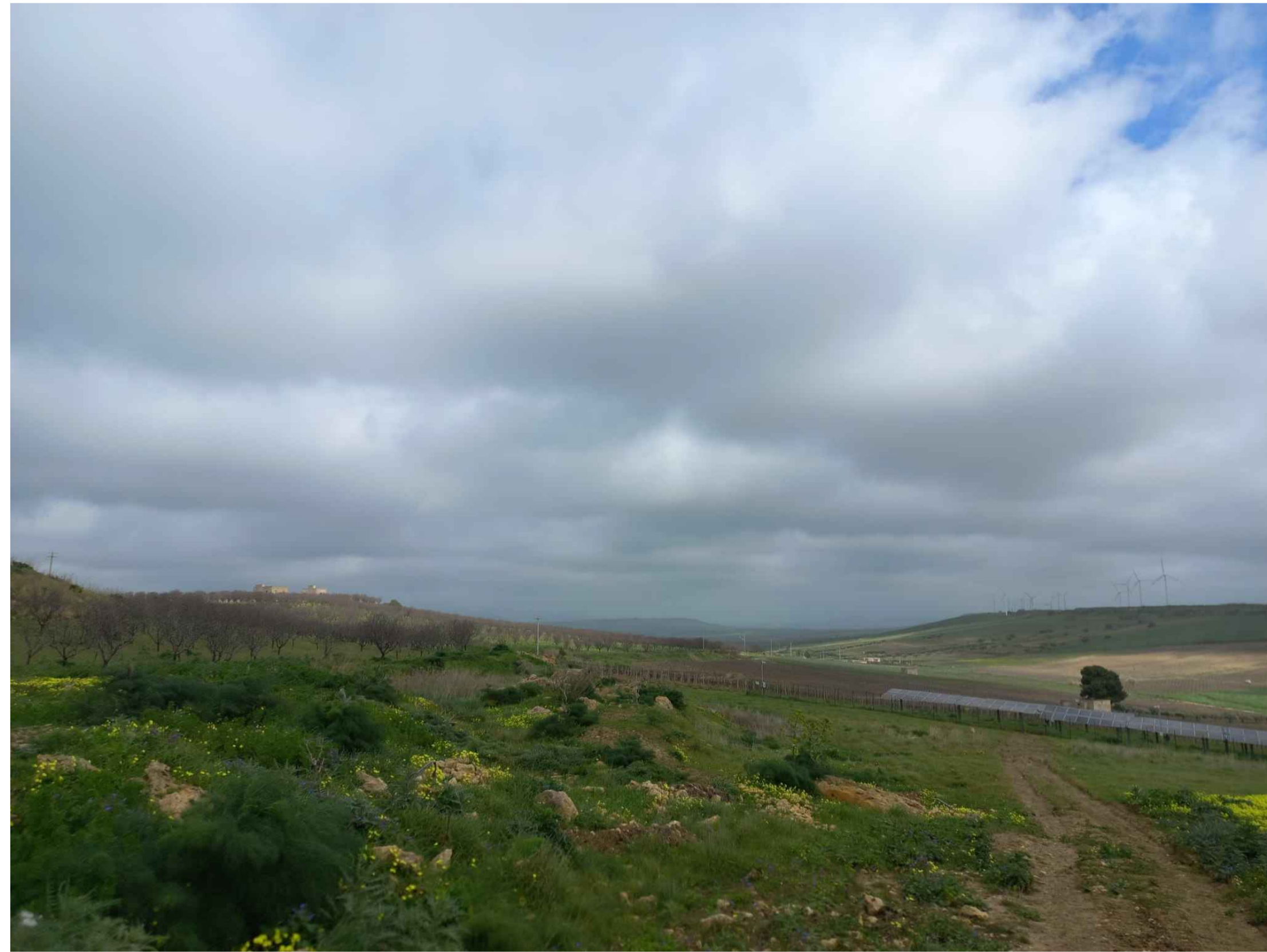
VISTA 1 STATO DI FATTO