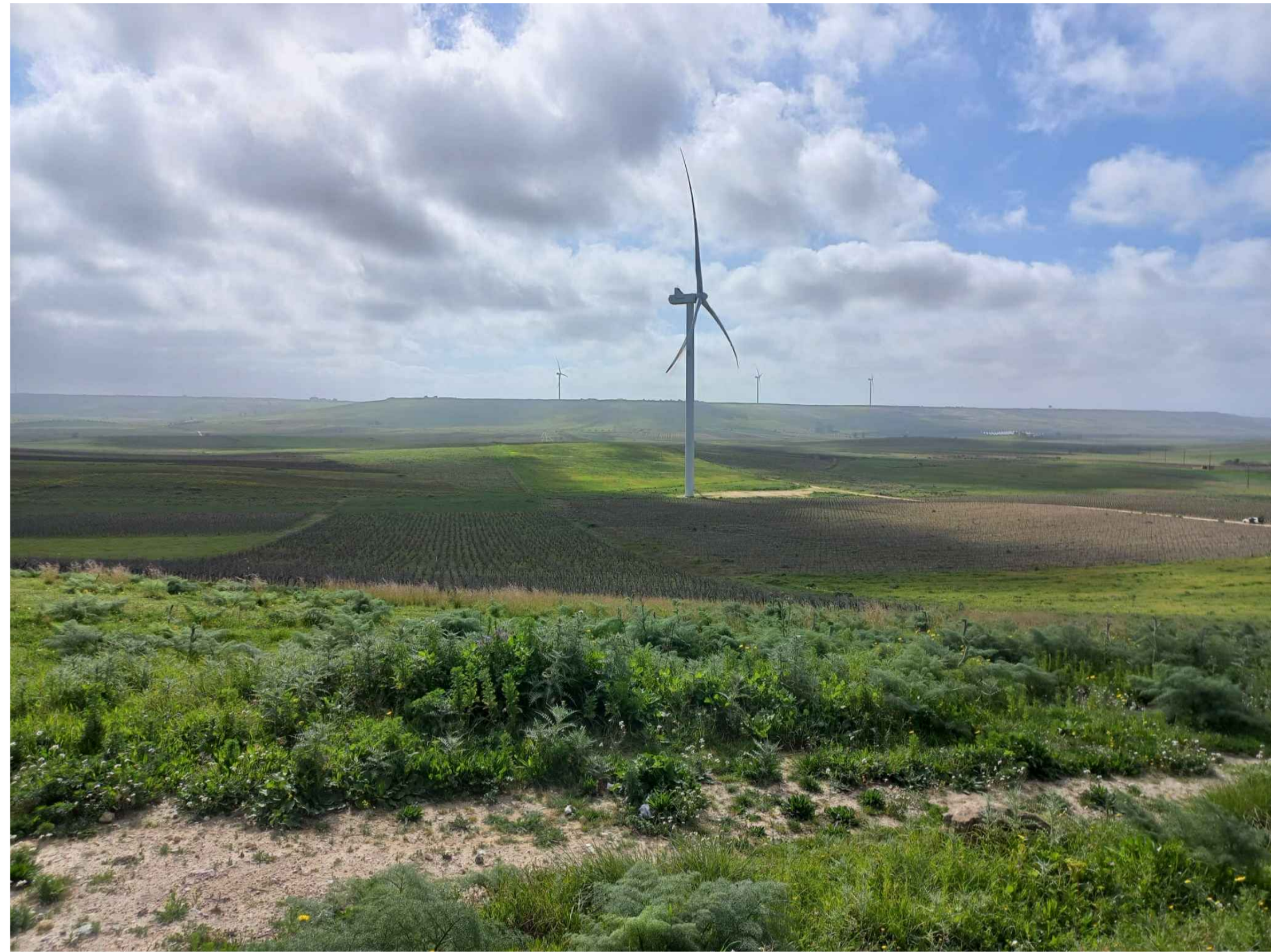
VISTA 2 STATO DI FATTO