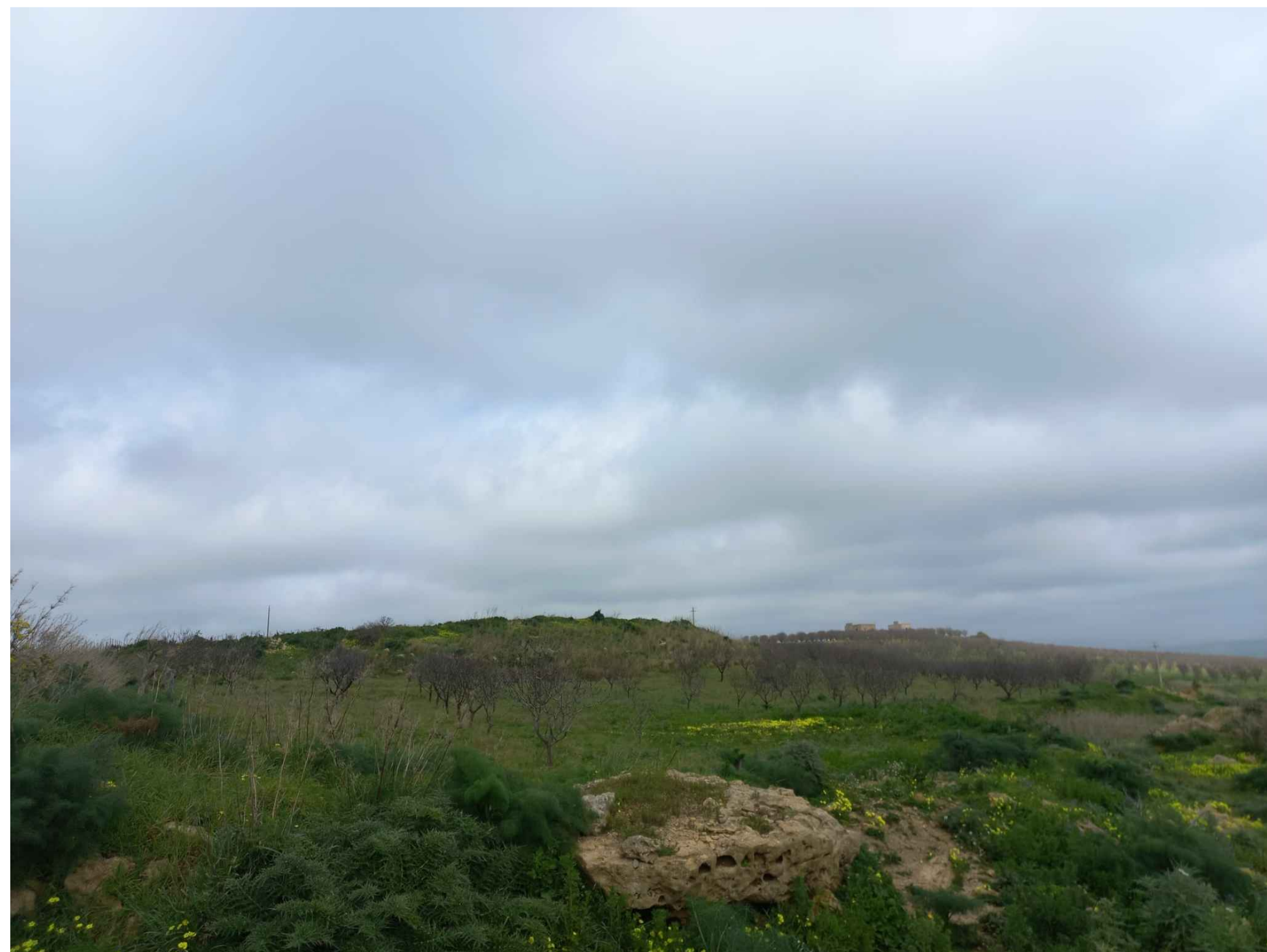
VISTA 2 STATO DI FATTO