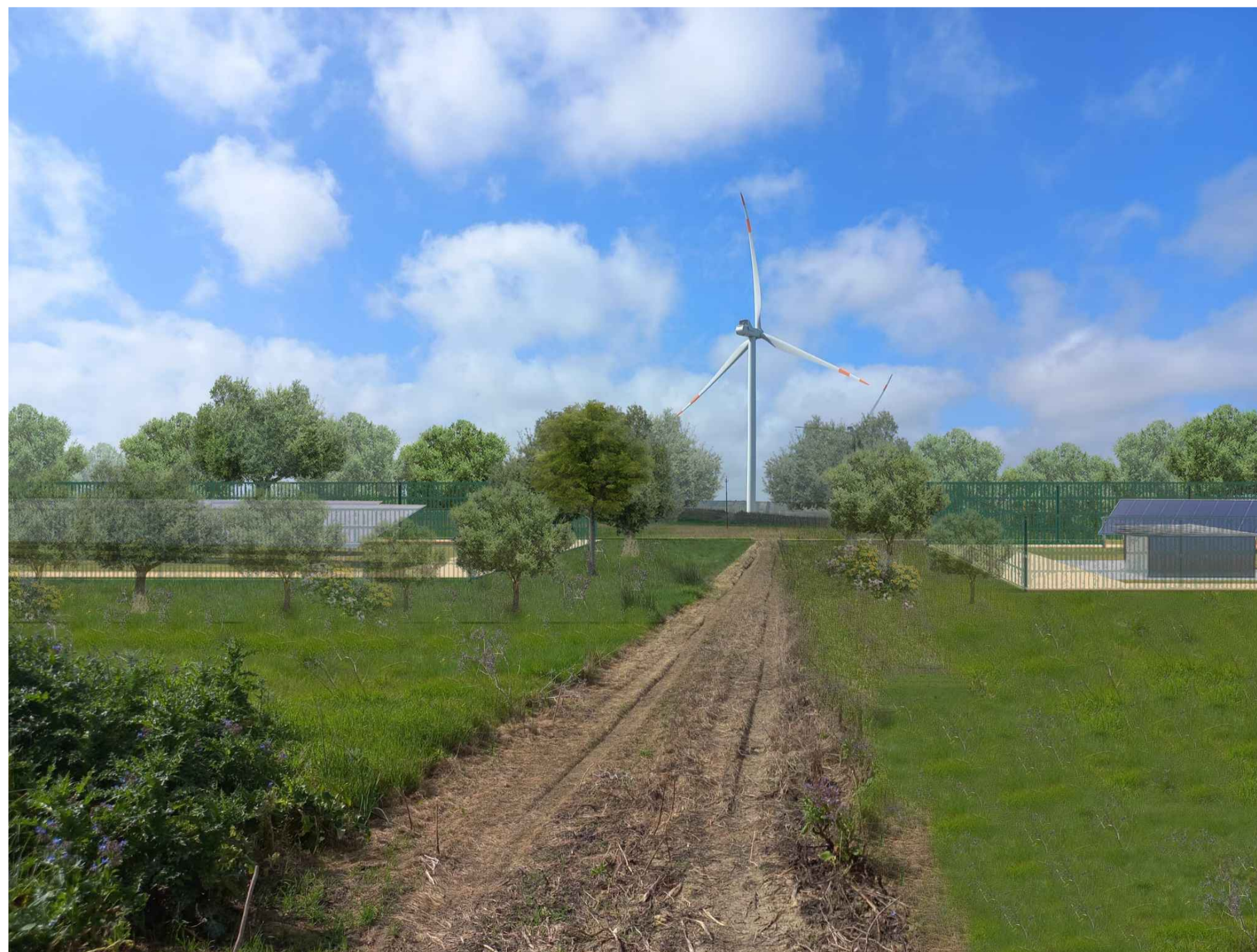
VISTA 7 STATO DI PROGETTO