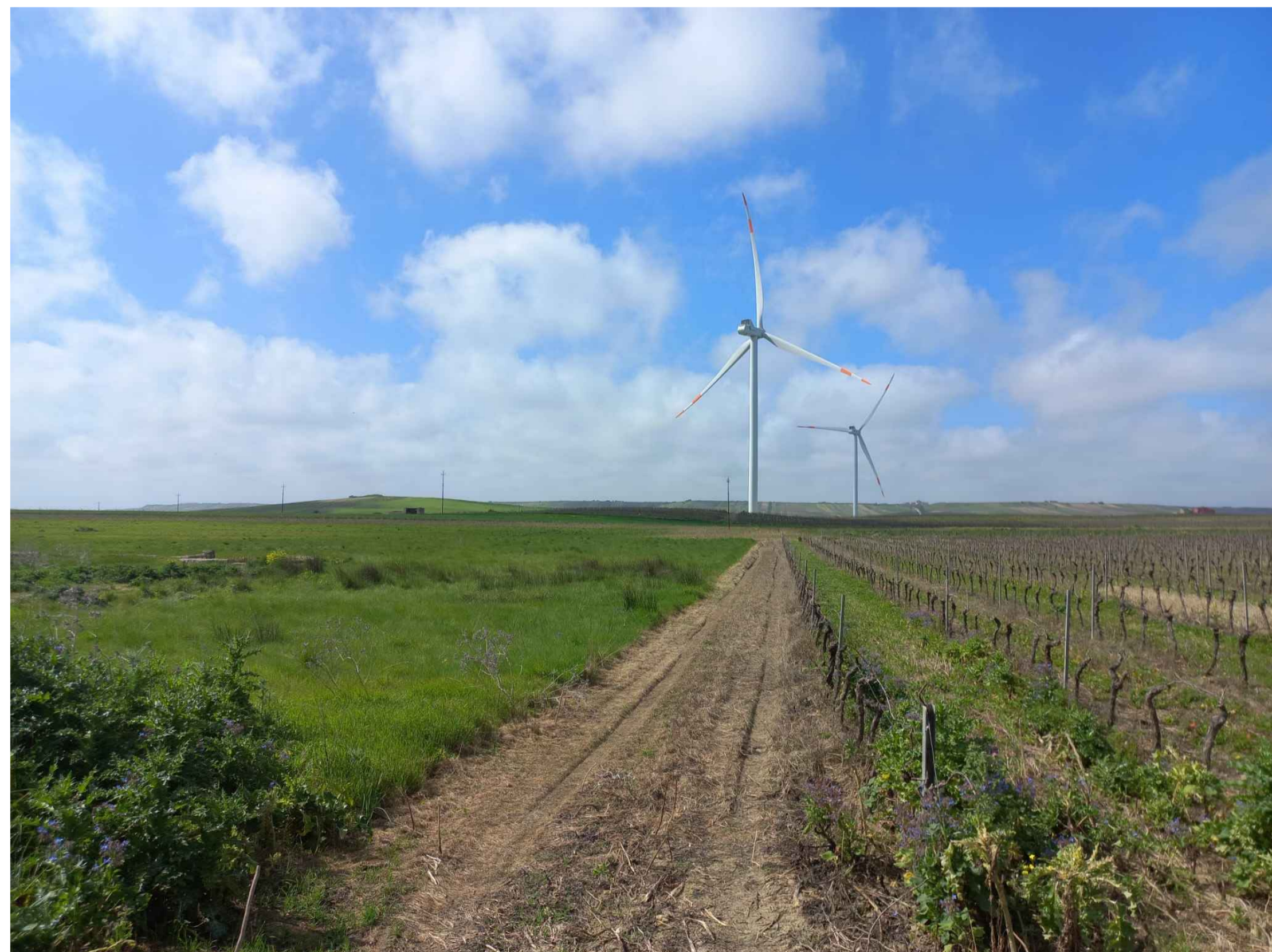
VISTA 7 STATO DI FATTO