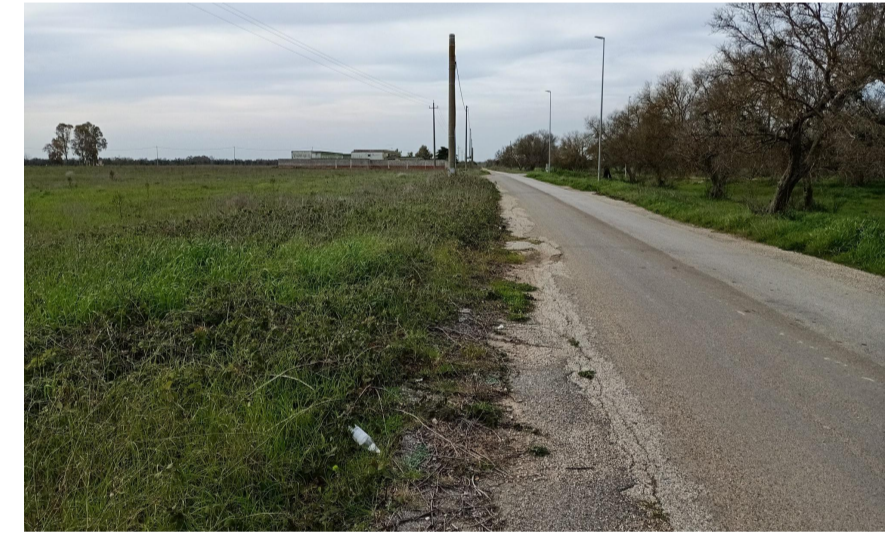
Vista 3 dalla SP 75 a sud est dell'area di impianto ante operam