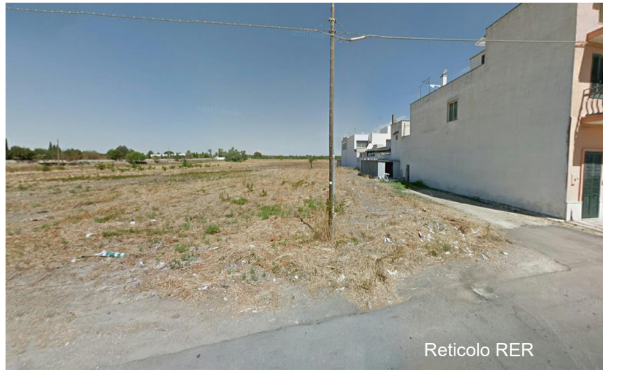
Vista 8 dal limite del reticolo RER Palude di San Donaci ante operam