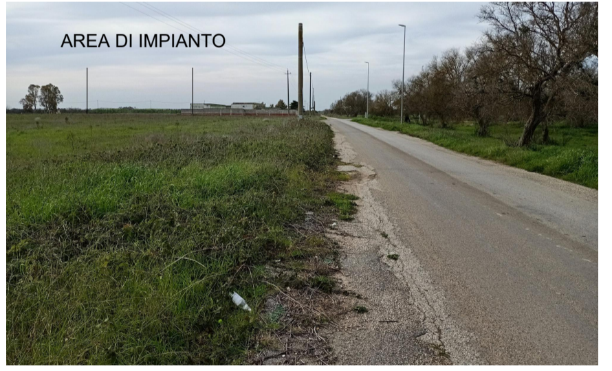
Vista 3 dalla SP 75 a sud est dell'area di impianto post operam