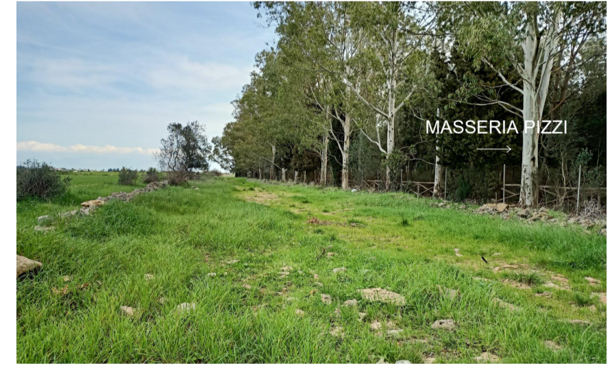
Vista 5 dell'impianto dalla Masseria Palazzo ante operam