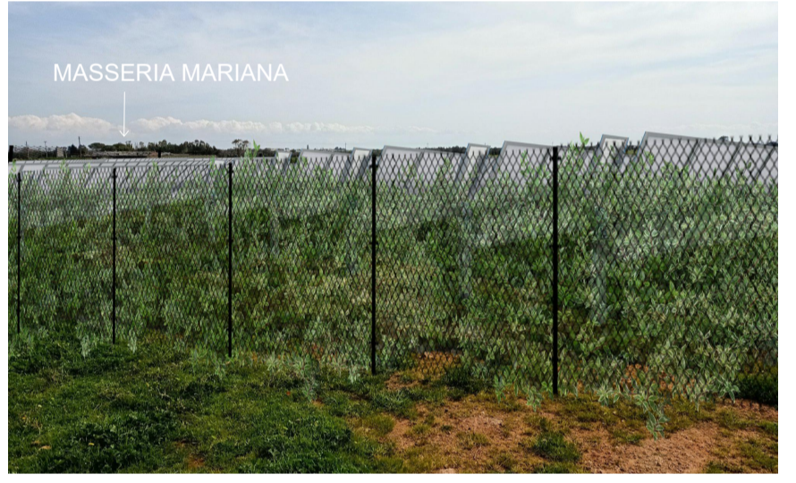
Vista 1 dell'area di impianto lungo la recinzione a nord ovest del lotto post operam