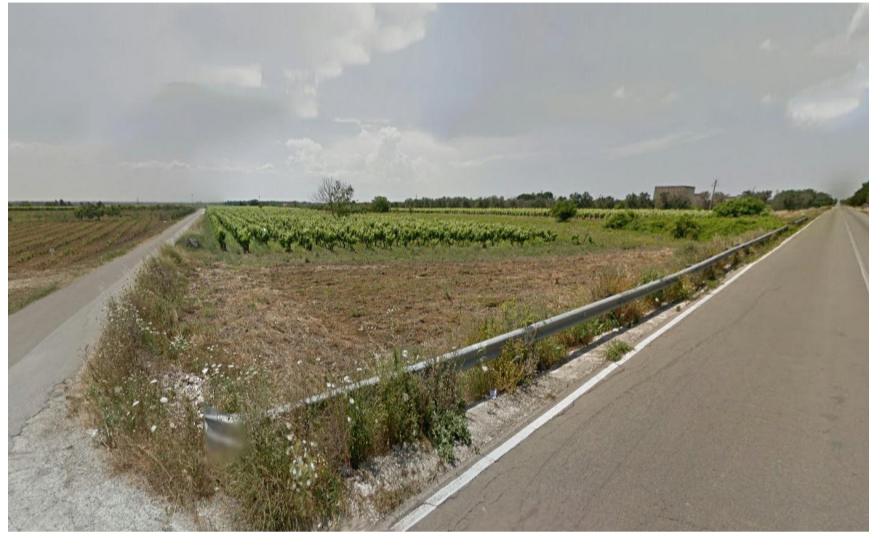
Vista 4 dalla strada a valenza paesaggistica SP San Donaci Mesagne a nord dell'area d'impianto ante operam