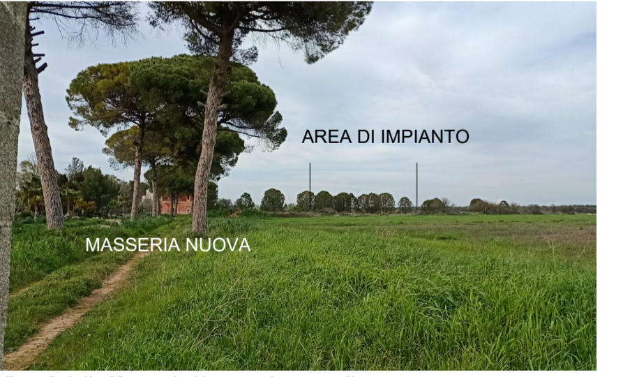
Vista 6 dalla Masseria Nuova e bosco adiacente post operam