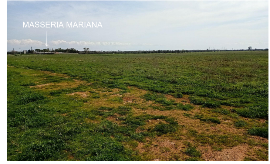
Vista 1 dell'area di impianto lungo la recinzione a nord ovest del lotto ante operam