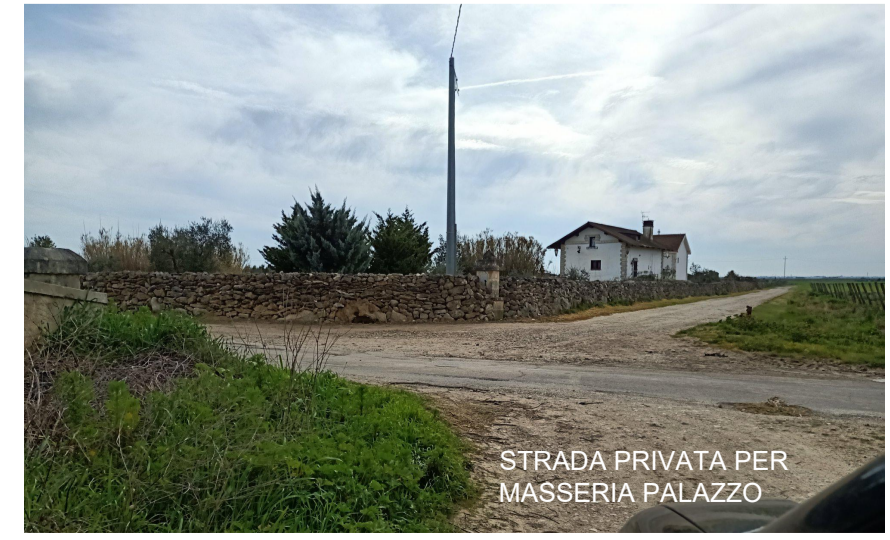
Vista 7 dalla strada privata di accesso alla Masseria Palazzo ante operam