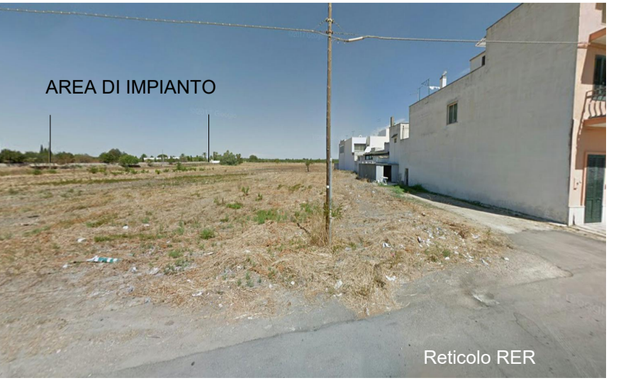
Vista 8 dal limite del reticolo RER Palude di San Donaci post operam