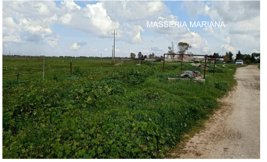
Vista 2 dal limite est dell' area di impianto ante operam