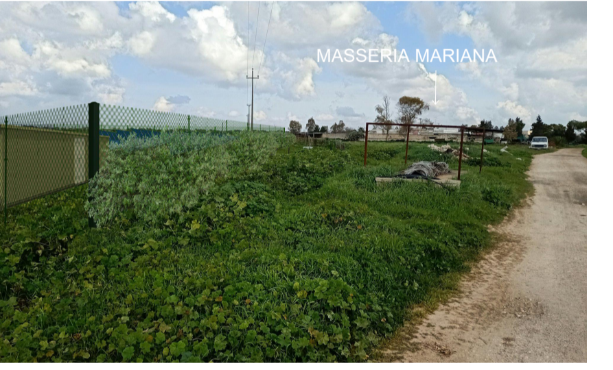
Vista 2 dal limite est dell' area di impianto post operam