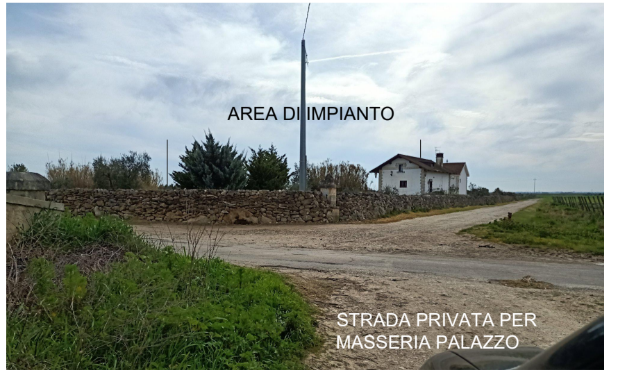
Vista 7 dalla strada privata di accesso alla Masseria Palazzo post operam