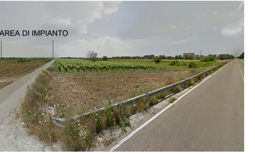
Vista 4 dalla strada a valenza paesaggistica SP San Donaci Mesagne a nord dell'area d'impianto post operam