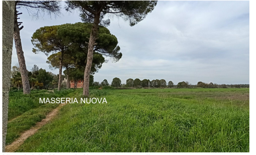
Vista 6 dalla Masseria Nuova e bosco adiacente ante operam