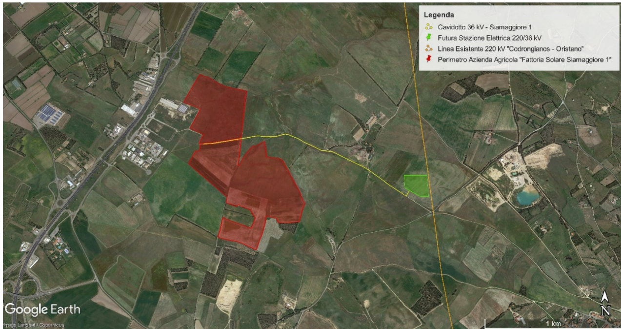
Figura 3: Inquadramento area impianto, percorso cavidotto e area nuova SE su Ortofoto

L'impianto agrivoltaico è ubicato nel Comune di Siamaggiore (OR) su un'area avente una superficie complessiva di circa 64 Ha, limitrofo all'infrastruttura viaria principale "Strada Statale SS131 Carlo Felice" e alla "Complanare Est" e confinante con zone industriali (P.I.P) che ricadono nei comuni di Siamaggiore e di Tramatzza. Al fine di connettere l'impianto agrivoltaico alla RTN è prevista la realizzazione di un cavidotto 36 kV di circa 1,8 km. Il cavidotto collega il nuovo l'impianto agrivoltaico alla futura Stazione Elettrica (SE) di Trasformazione 220/36 kV di Terna, da inserire in entra-esce alla linea RTN 220 kV "Codrongianos - Oristano" in un'area a destinazione agricola all'interno del Comune di Solarussa (OR).