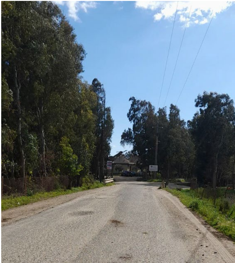
Figura 5: Restringimento strada a 4,7 m