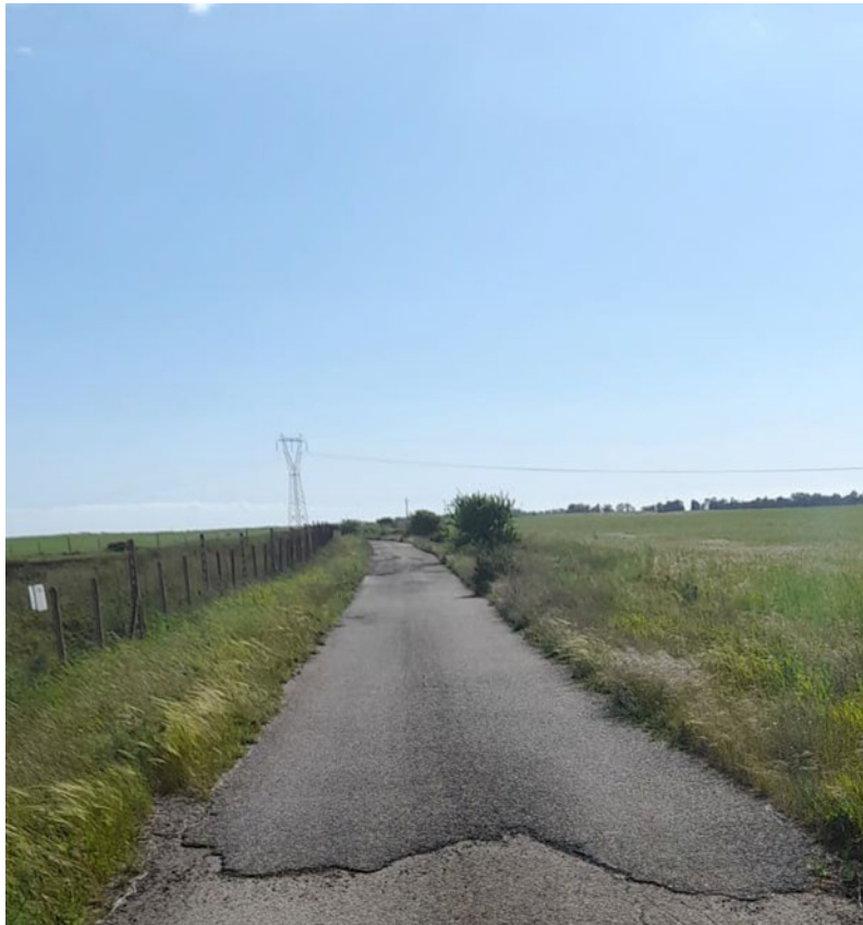
Figura 6: Tratto di strada terminale per accedere alla SE

Le strade sopra descritte sono pubbliche. Saranno da adeguare solo gli ultimi 380 m dal lato della stazione elettrica, mentre sarà realizzata ex-novo solo l'ultimo tratto di 57 m.