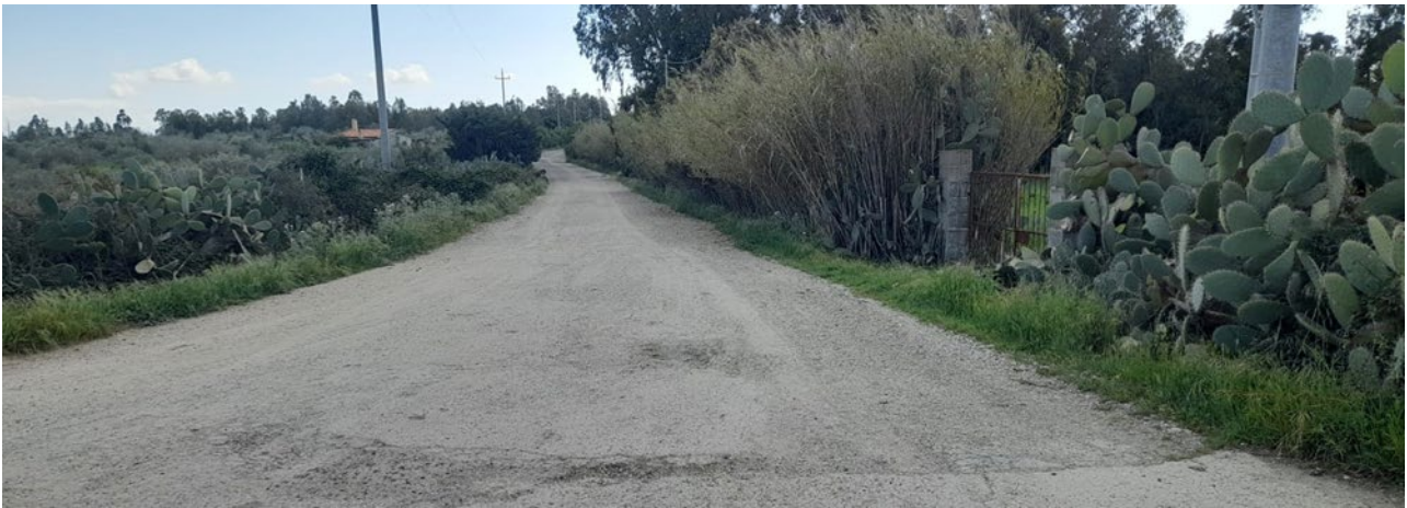
Figura 4: Imbocco strada larghezza 7,7 m

All'imbocco la larghezza della carreggiata è 7,7 m (Figura 4), per poi rimanere, sino all'accesso in stazione, di dimensioni sempre superiori a 5 m.