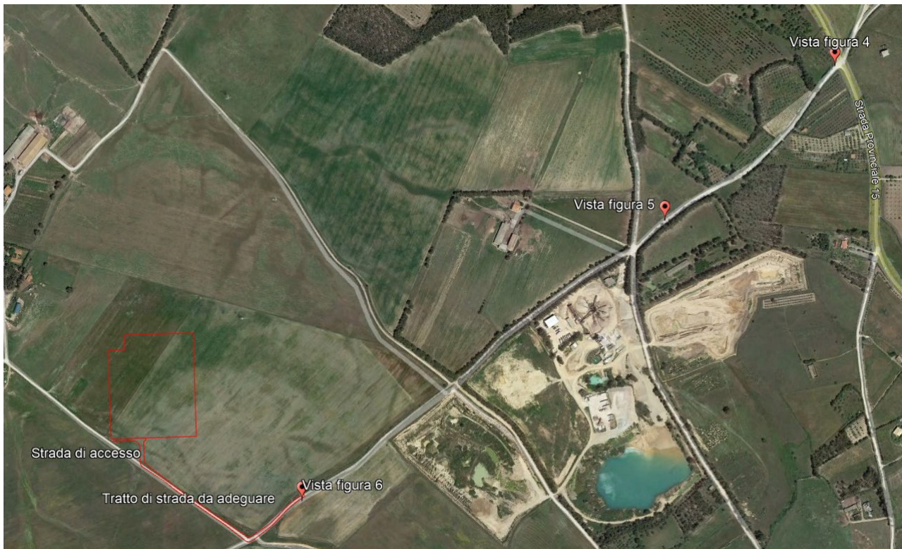
Figura 3: Posizionamento SE Bauladu e strada di accesso

La stazione elettrica SE 220/36 kV "Bauladu" sorge su un'area del contesto rurale del Comune di Solarussa, ad ovest della Strada Provinciale SP 15 e a est della SS 131 "Carlo Felice". L'identificazione della posizione della stazione SE 220/36 kV "Bauladu" è riportata in Figura 3.