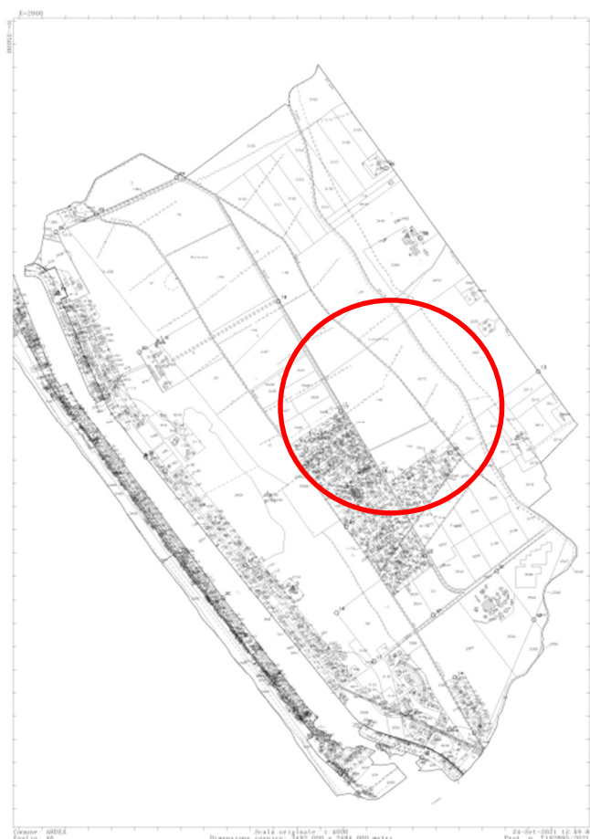
Figura 1- Inquadramento su catastale