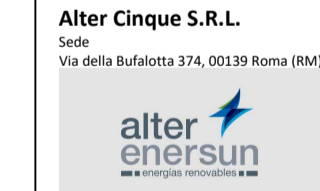
TAVOLA: TAV044 PROPRONENTE: Alter Cinque S.R.L. Sede Via della Bufalotta 374, 00199 Roma (RM)