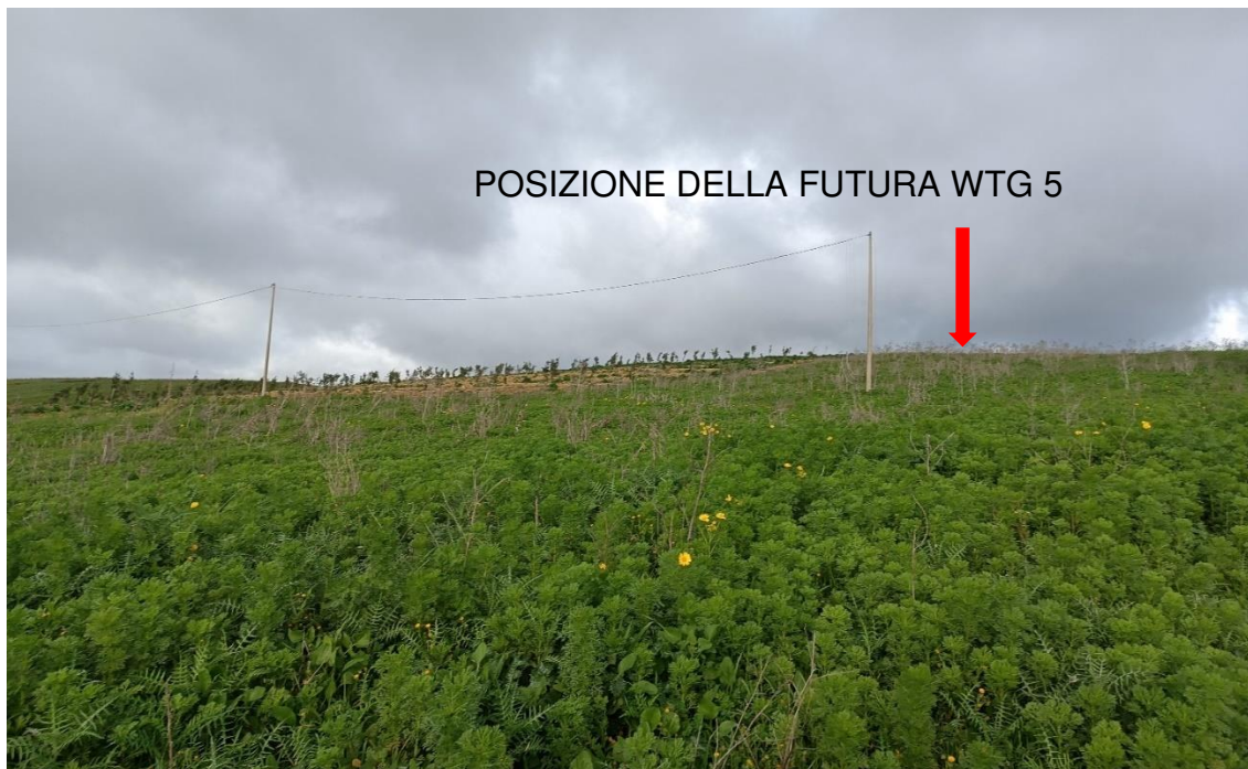
Figura 7 - Stato di fatto della futura piazzola per la turbina WTG 5