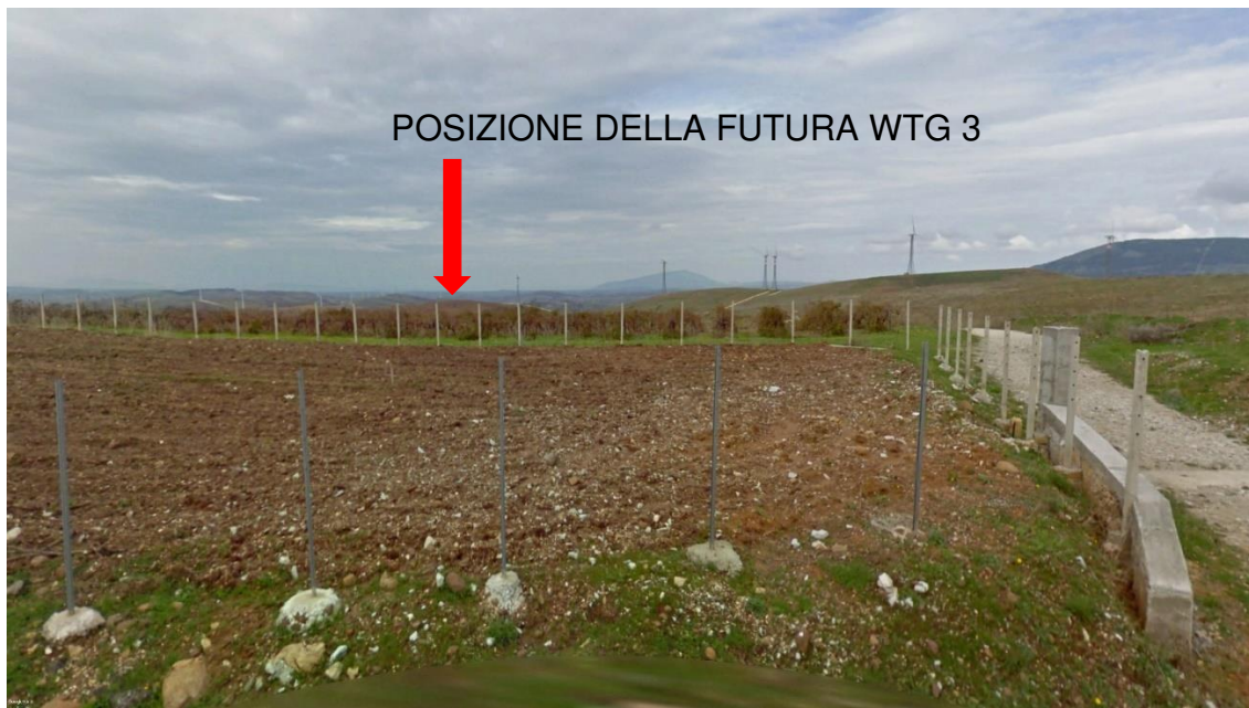
Figura 5 - Stato di fatto della futura piazzola per la turbina WTG 3