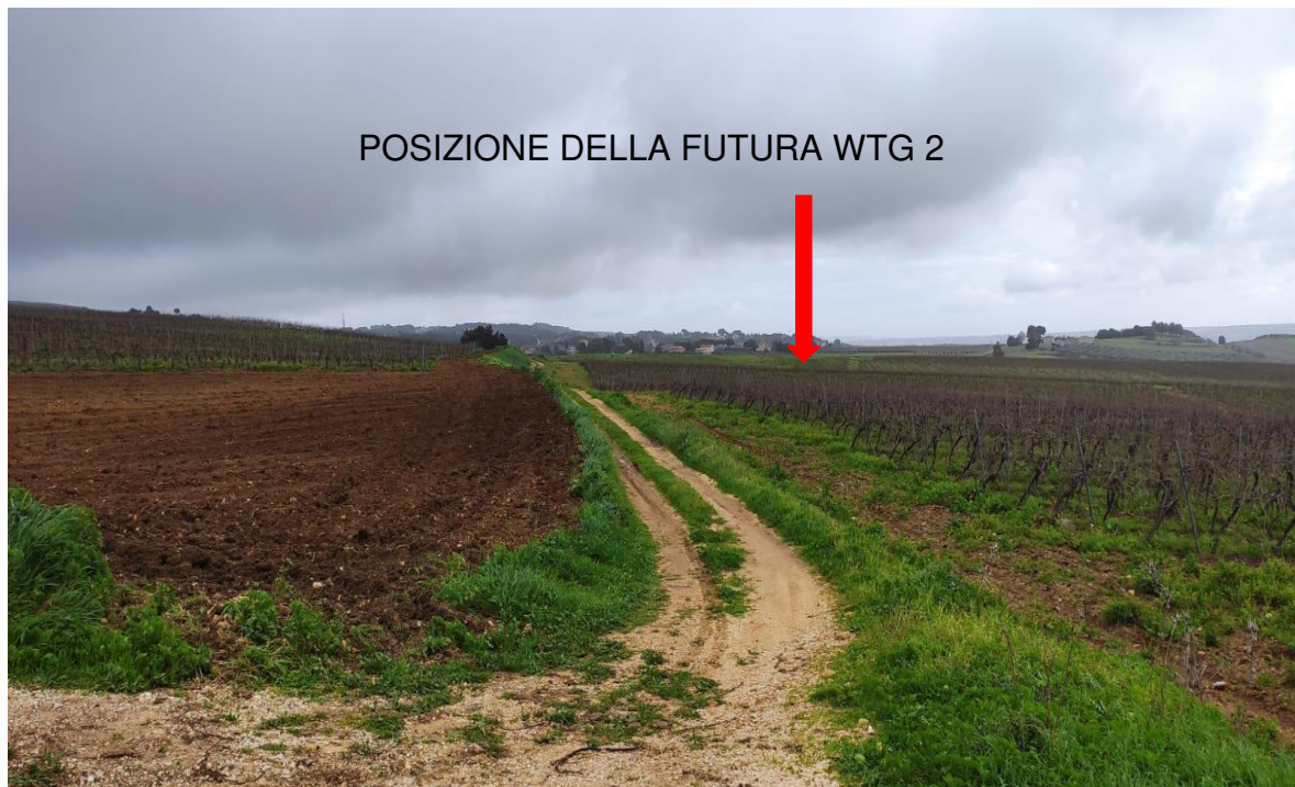
Figura 4 - Stato di fatto della futura piazzola per la turbina WTG 2