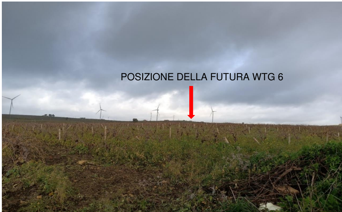
Figura 8 - Stato di fatto della futura piazzola per la turbina WTG 6