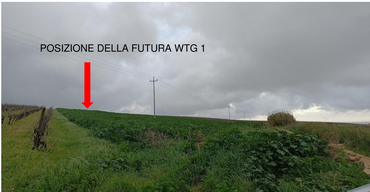
Figura 3 - Stato di fatto della futura piazzola per la turbina WTG 1