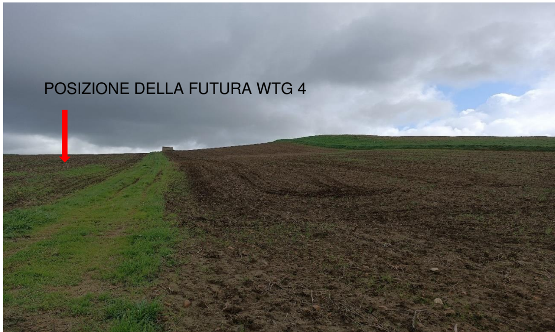
Figura 6 - Stato di fatto della futura piazzola per la turbina WTG 4