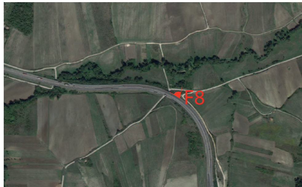
(F8) VALLESACCARDA_Autostrada A16 Napoli-Canosa: FOTOSIMULAZIONE