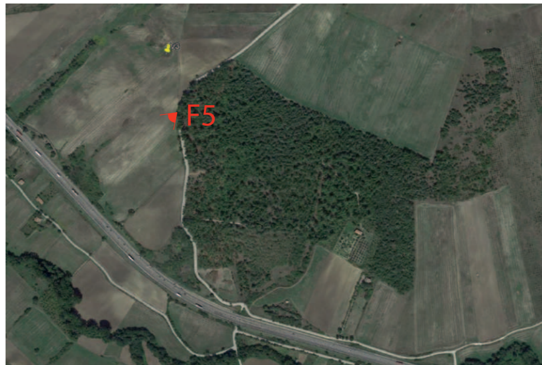
(F5) VALLESACCARDA_Pineta Mattine: Fotosimulazione