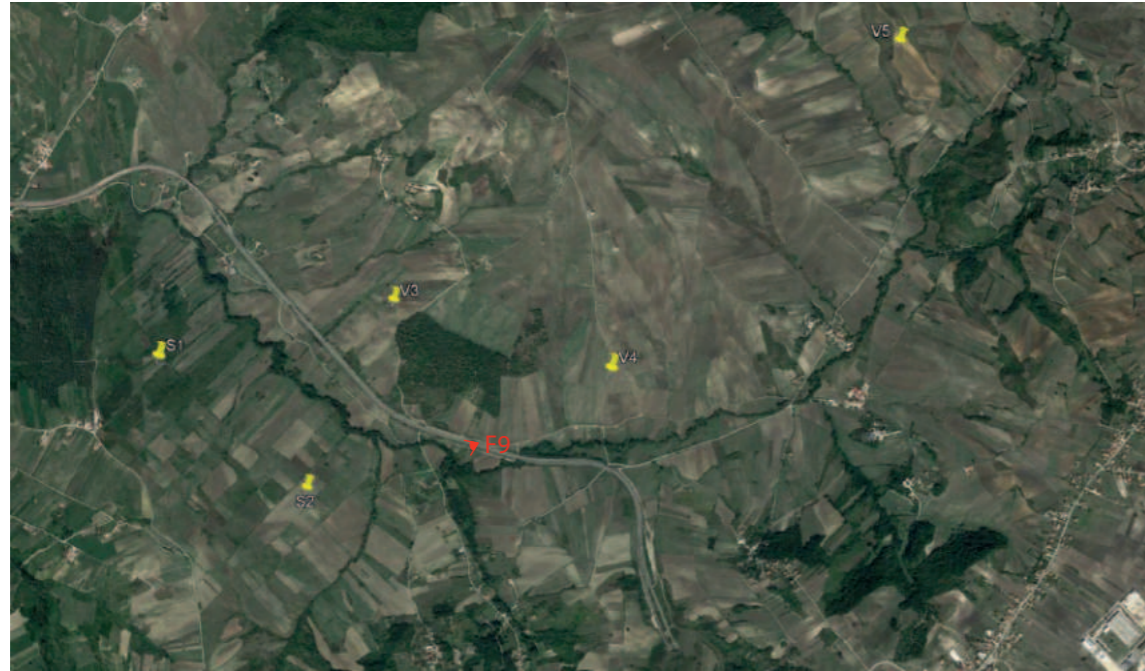
(F9) VALLESACCARDA_Autostrada A16 Napoli-Canosa: Stato di fatto

INQUADRAMENTO AREA PROGETTO CON PUNTI SCATTO FOTOGRAFICO