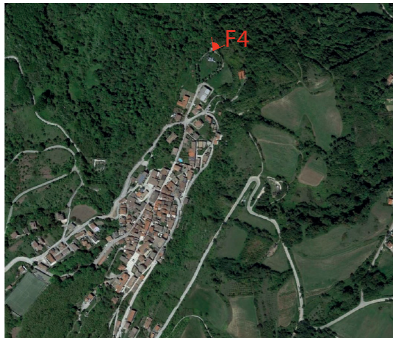
(F4) TREVICO_Punto panoramico: Fotosimulazione

COMUNE DI TREVICO (AV) COORDINATE WGS 84 SCATTO FOTOGRAFICO E 519800 N 4544609