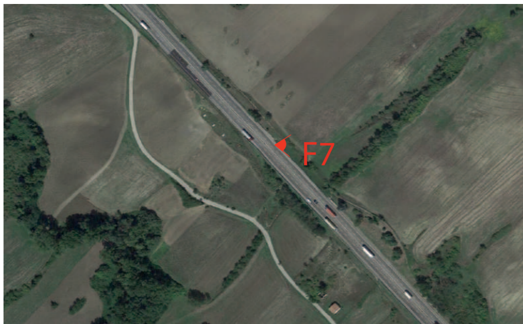
(F7) VALLESACCARDA_Autostrada A16 Napoli-Canosa: Fotosimulazione