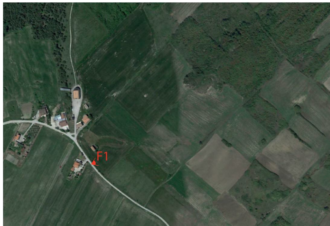
(F1) SAN SOSSIO BARONIA_Chiesa di San Michele: Fotosimulazione