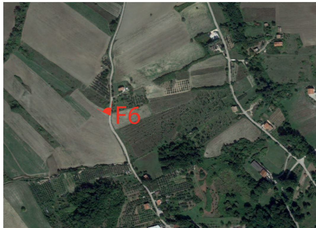
(F6) VALLESACCARDA_Contrada Filaro: Fotosimulazione