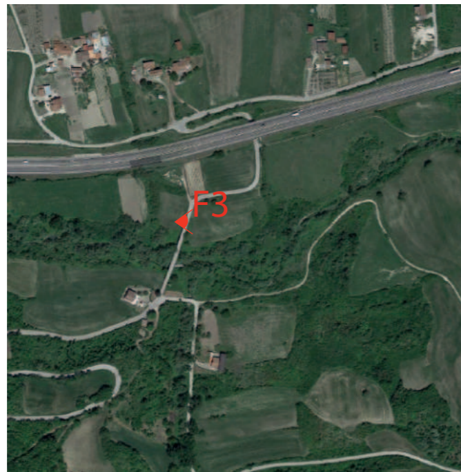
(F3) SAN SOSSIO BARONIA_Ponte Romano (Ruderi): Fotosimulazione