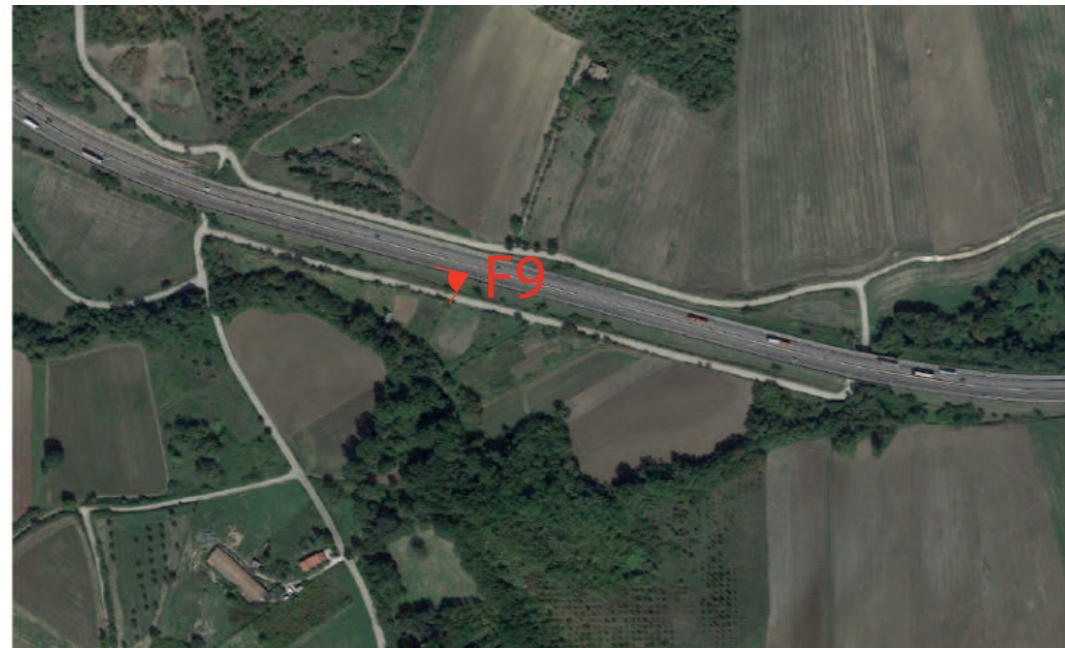
(F9) VALLESACCARDA_Autostrada A16 Napoli-Canosa: Fotosimulazione