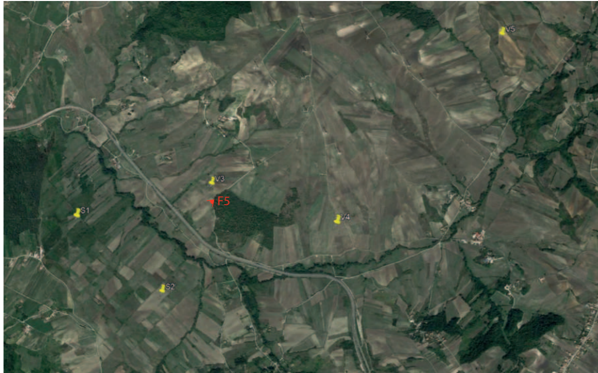
(F5) VALLESACCARDA_Pineta Mattine: Stato di fatto

INQUADRAMENTO AREA PROGETTO CON PUNTI SCATTO FOTOGRAFICO