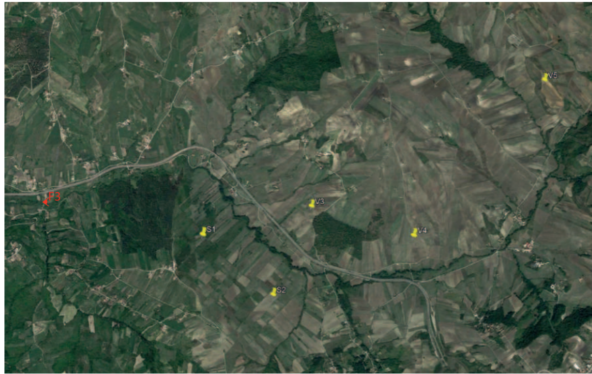
(F3) SAN SOSSIO BARONIA_Ponte Romano (Ruderi): Stato di fatto

INQUADRAMENTO AREA PROGETTO CON PUNTI SCATTO FOTOGRAFICO