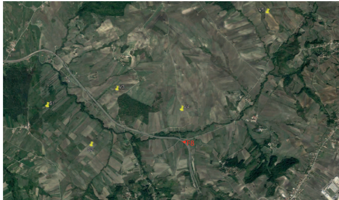
(F8) VALLESACCARDA_Autostrada A16 Napoli-Canosa: Stato di fatto

INQUADRAMENTO AREA PROGETTO CON PUNTI SCATTO FOTOGRAFICO