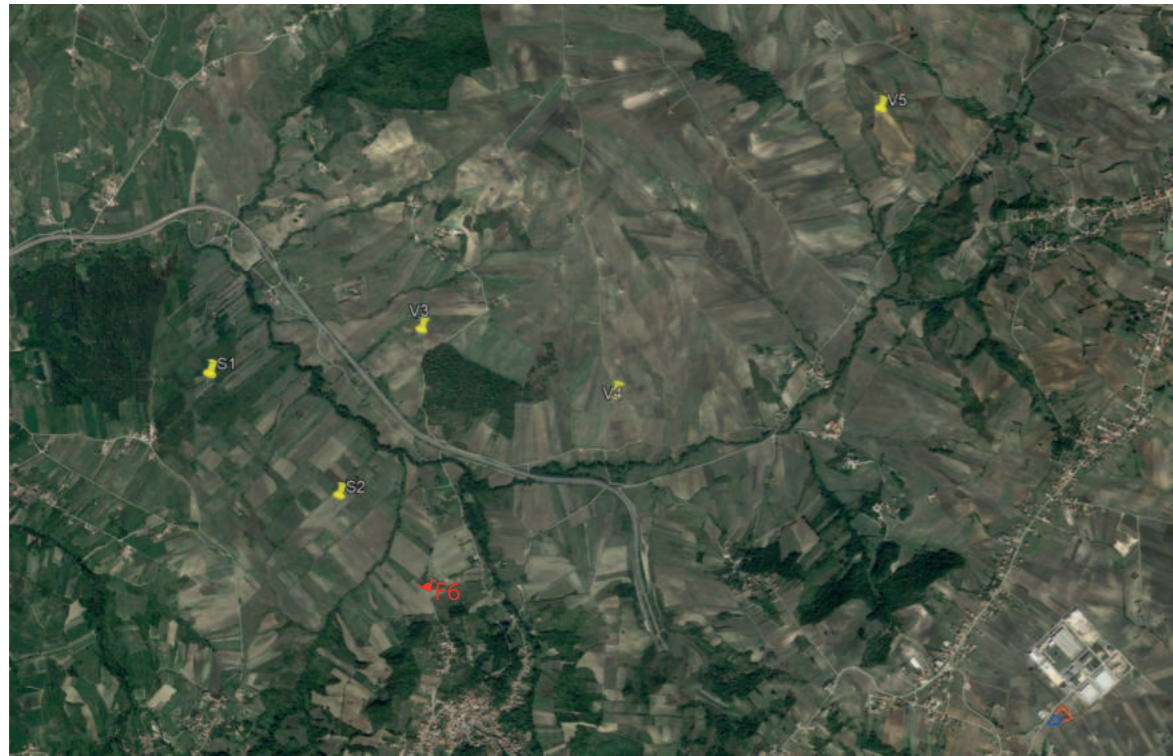
(F6) VALLESACCARDA_Contrada Filaro: Stato di fatto

INQUADRAMENTO AREA PROGETTO CON PUNTI SCATTO FOTOGRAFICO