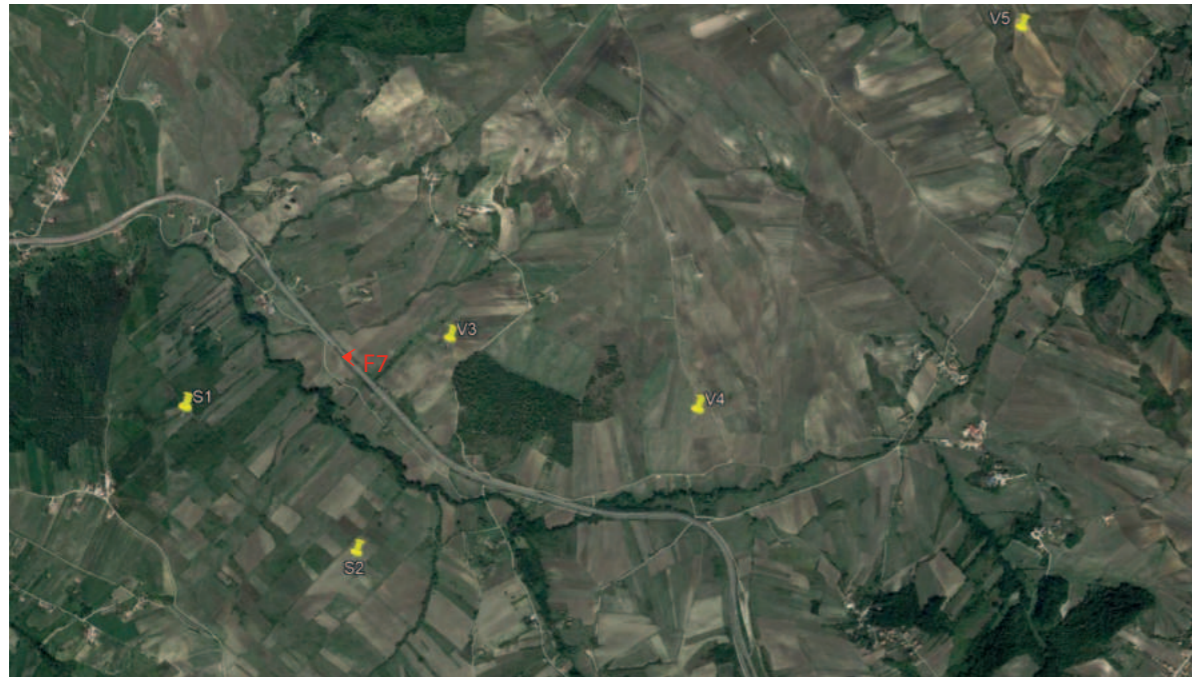
(F7) VALLESACCARDA_Autostrada A16 Napoli-Canosa: Stato di fatto

INQUADRAMENTO AREA PROGETTO CON PUNTI SCATTO FOTOGRAFICO