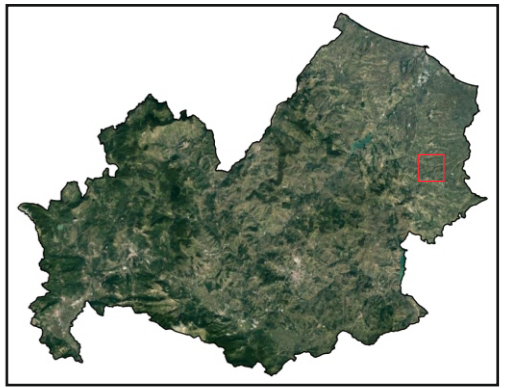
Sfondo Immagine Satellitare