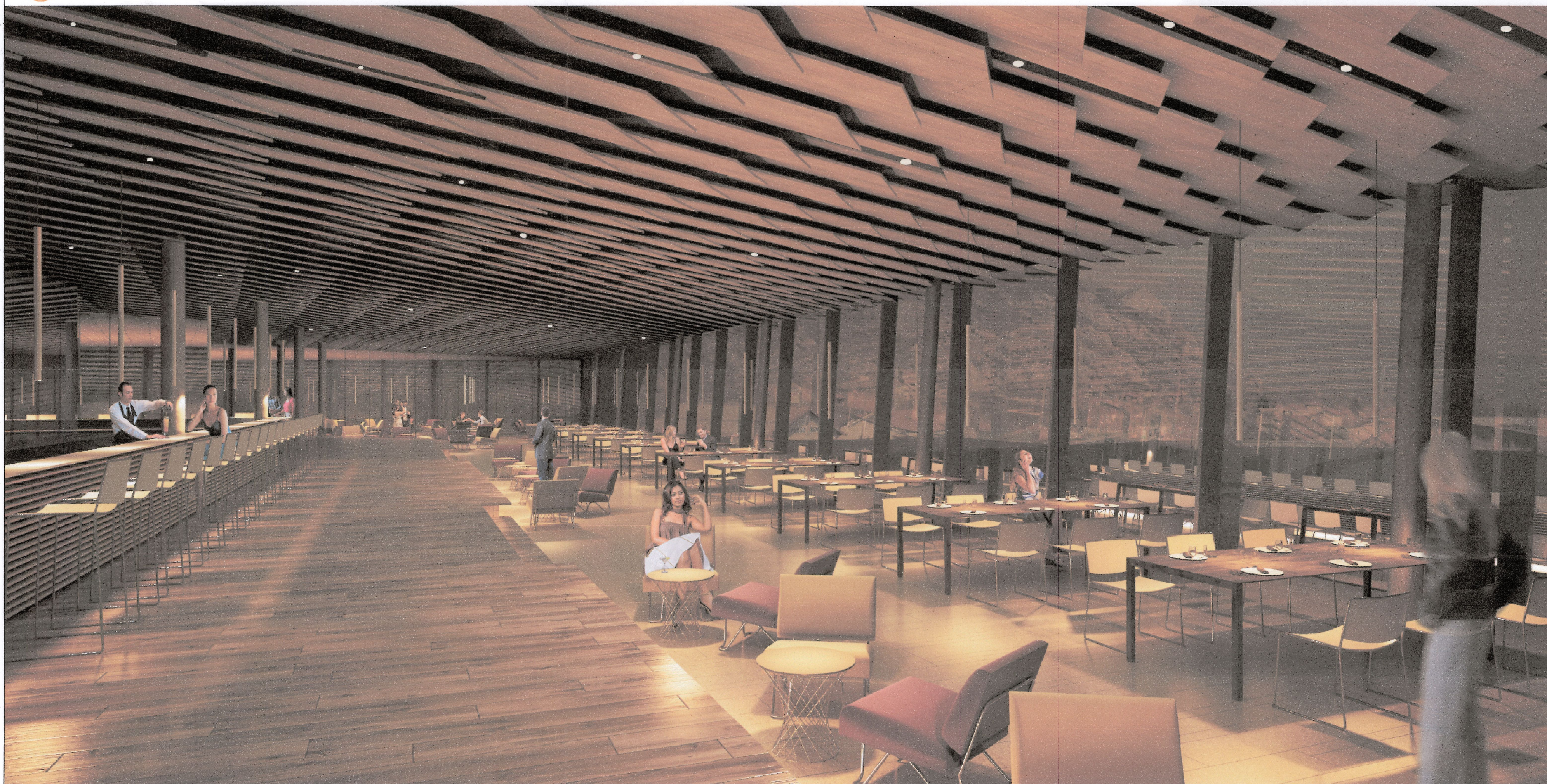
02 Vista del ristorante, primo piano / Vue depuis le restaurant au premier étage