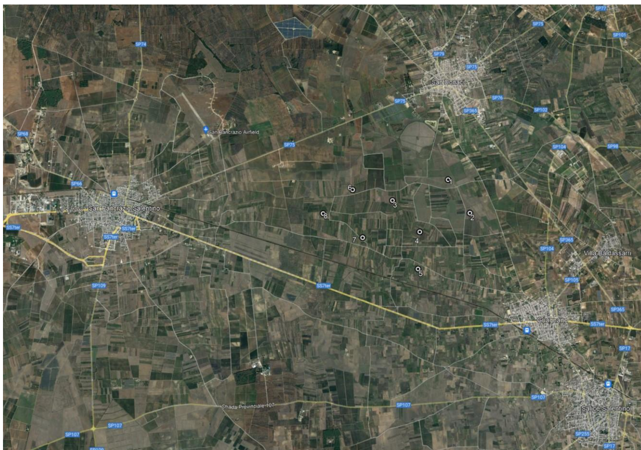
Figura 1.1 - Inquadramento territoriale dell'area dell'impianto eolico.

L'area di indagine comprende un buffer di almeno 5 km rispetto al layout di impianto ed è situata nei territori di Guagnano (LE), San Donaci (BR) e zone limitrofe.