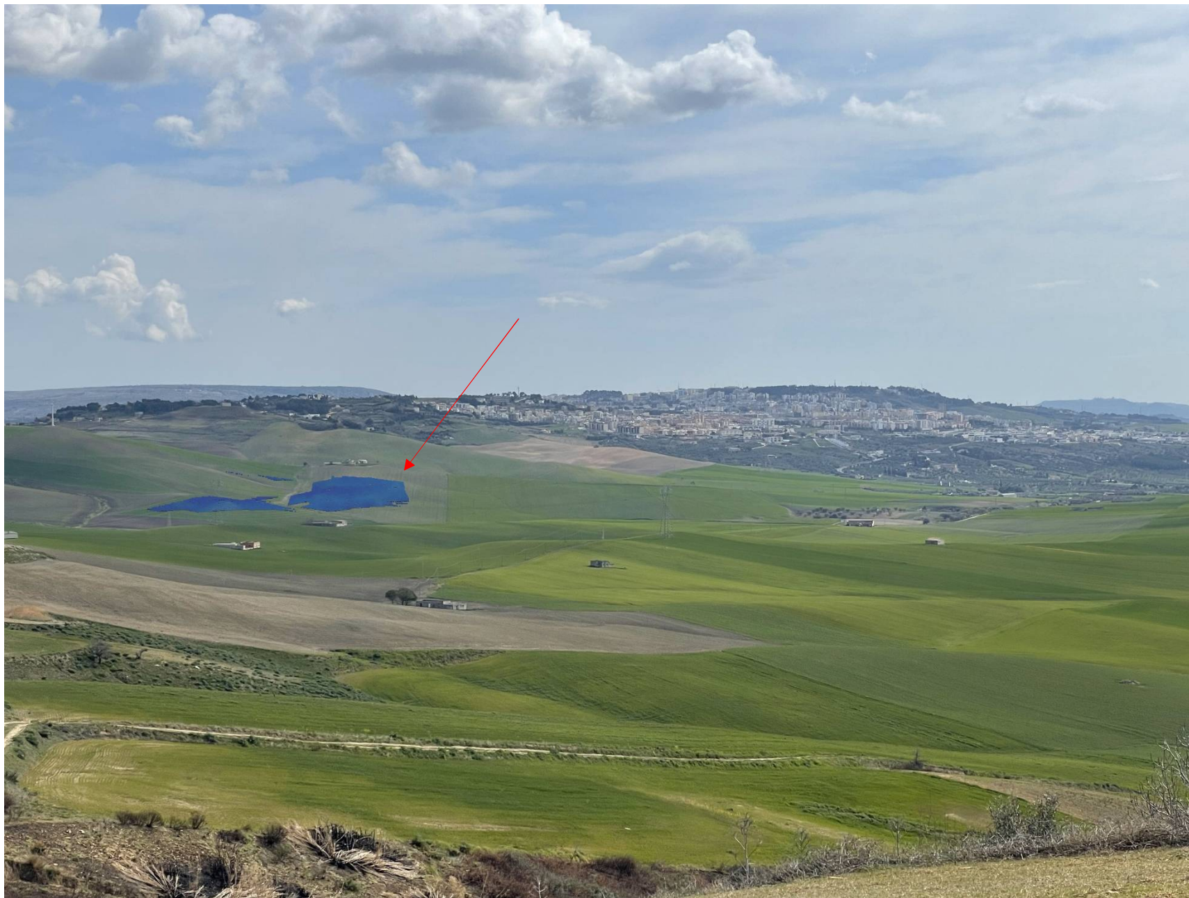
Foto 7. Stato di progetto