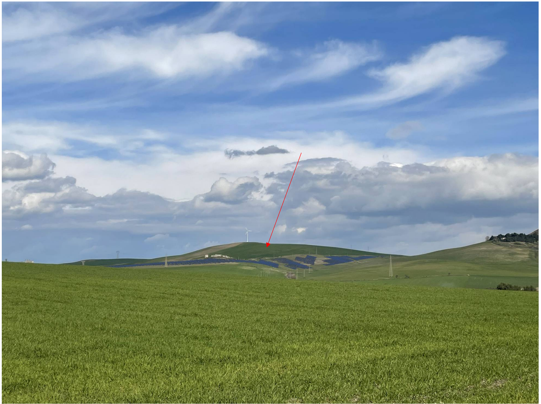
Foto 9. Stato di Progetto