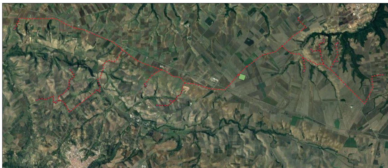
Figura 2 - Inquadramento Territoriale - Ortofoto

L'area interessata dal Progetto si colloca, dal punto di vista amministrativo, nella parte settentrionale della Provincia di Potenza, tra i Comuni di Venosa e Montemilone.