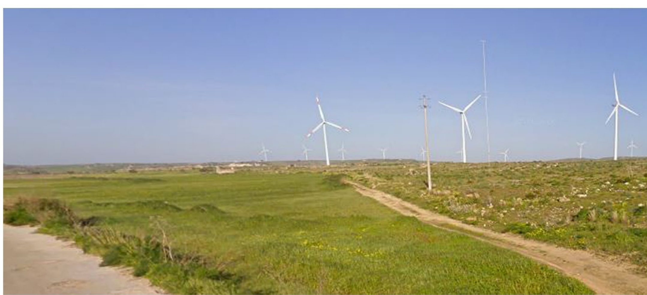
FOTOINSEIRIMENTO 10 - ANTE OPERAM - Dal punto di ripresa fotografico Baglio e torre Grimesi - Mazaro del Vallo.