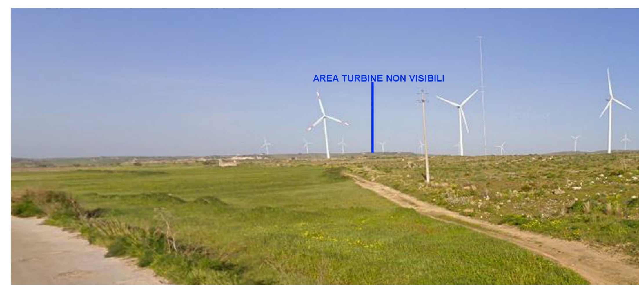
FOTOINSEIRIMENTO 10 - POST OPERAM - Dal punto di ripresa fotografico Baglio e torre Grimesi - Mazaro del Vallo, che dista dall'aerogeneratore più vicino 10 Km, il parco eolico NON risulta visibile.