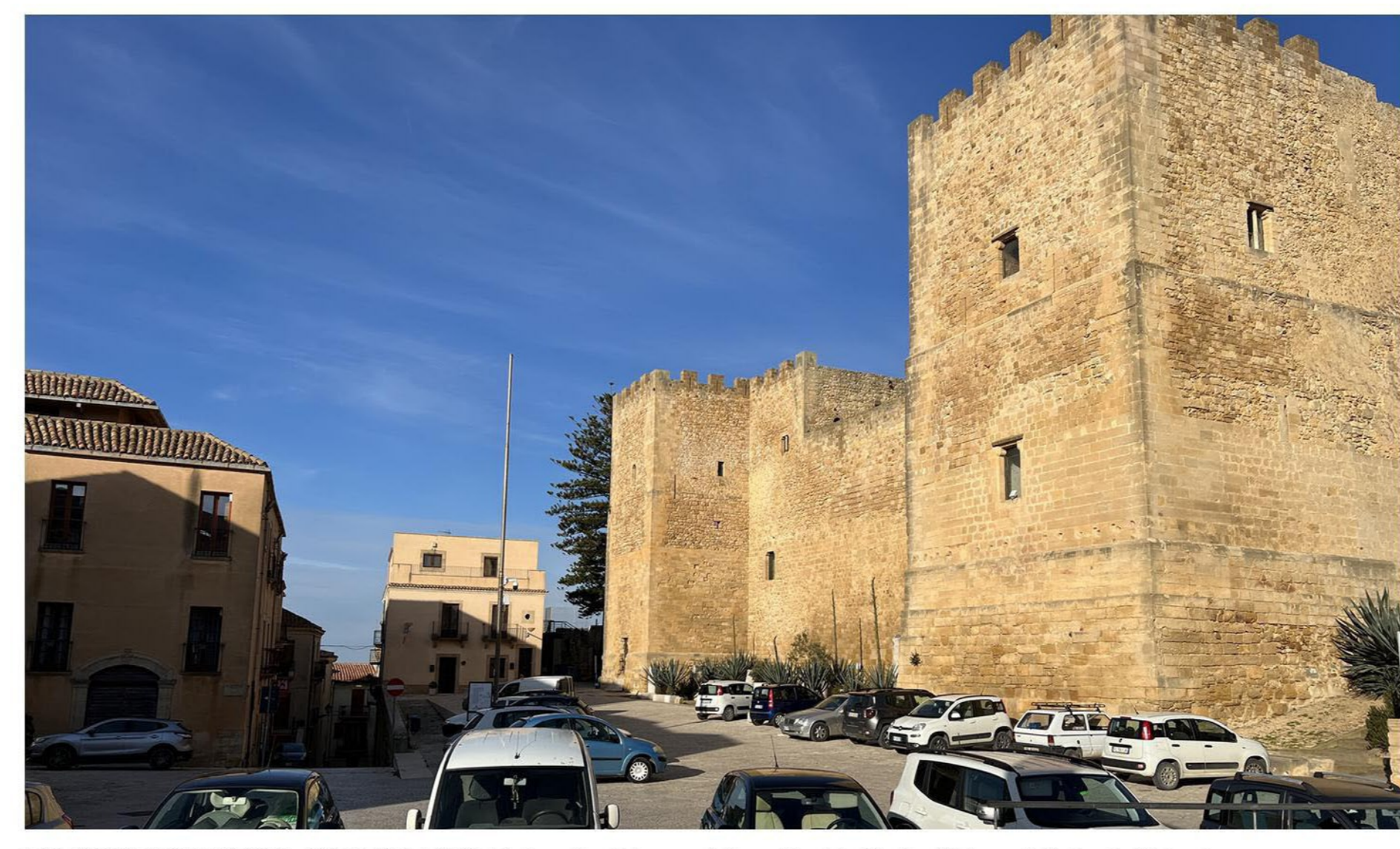
FOTOINSEIRIMENTO 5 - ANTE OPERAM: Dal punto di ripresa fotografico Ex Madre Chiesa di Salemi - Salemi.