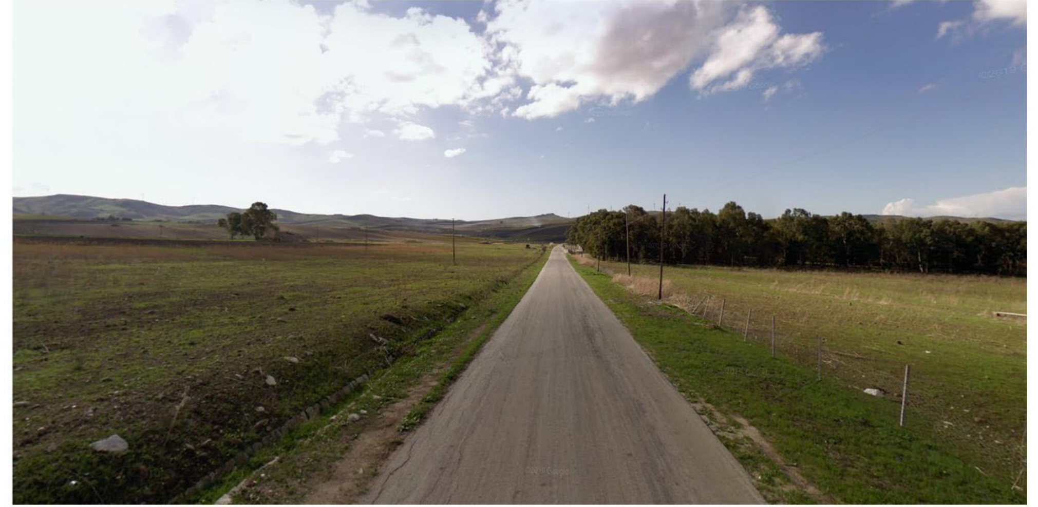
FOTOINSEIRIMENTO 1 - ANTE OPERAM: Dal punto di ripresa fotografico Lago Rubino - Trapani.