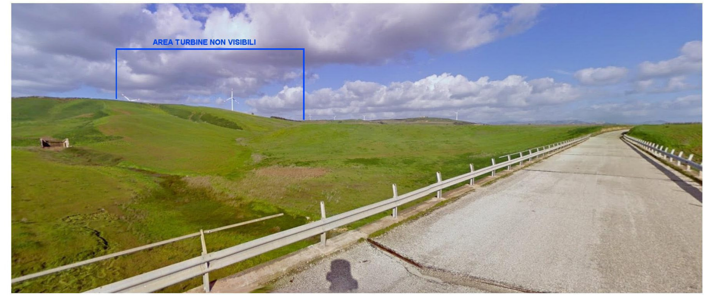
FOTOINSEIRIMENTO 7 - POST OPERAM: Dal punto di ripresa fotografico Lago della Trinità - Castelvetrano, che dista dall'aerogeneratore più vicino 10 Km, il Parco eolico NON risulta visibile.