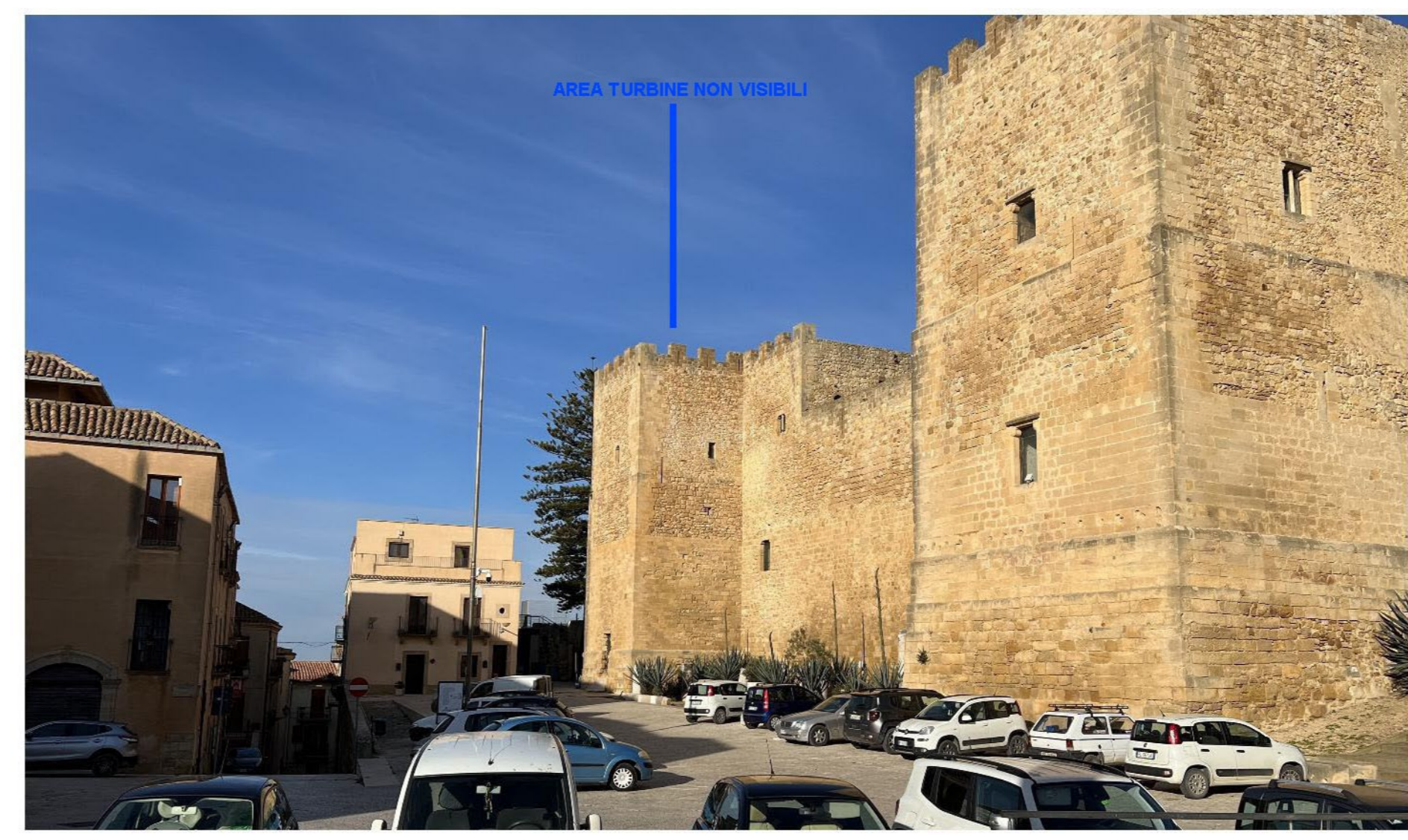
FOTOINSEIRIMENTO 5 - POST OPERAM: Dal punto di ripresa fotografico, Ex Madre Chiesa di Salemi - Salemi, che dista dall'aerogeneratore più vicino circa 7 Km, il Parco eolico NON risulta visibile.