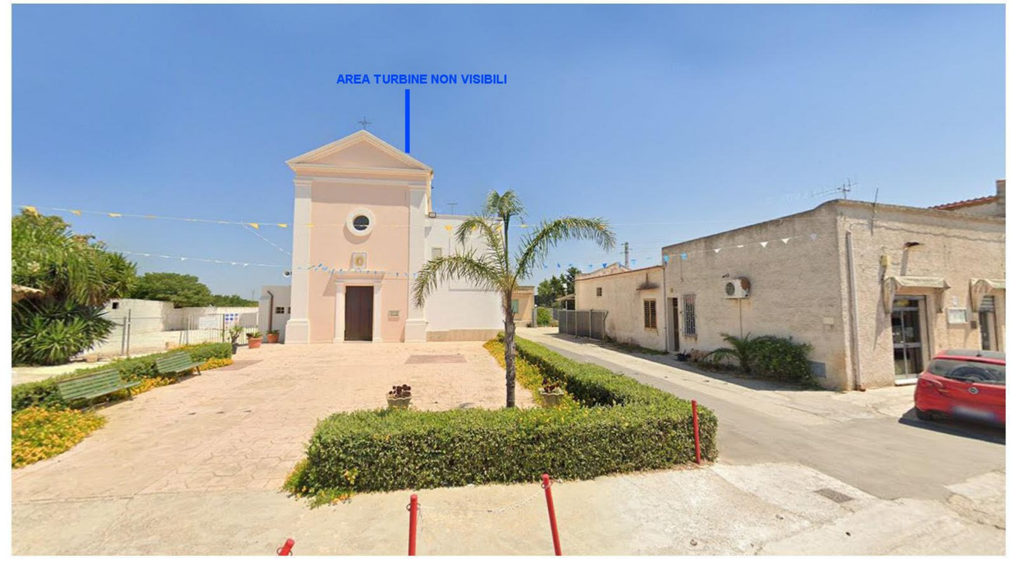
FOTOINSEIRIMENTO 8 - ANTE OPERAM: Dal punto di ripresa fotografico Chiesa Maria SS. della Cava - Marsala, che dista dall'aerogeneratore più vicino circa 10 Km, il Parco eolico NON risulta visibile.