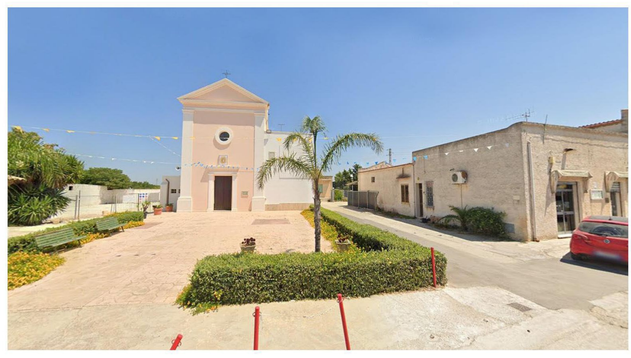
FOTOINSEIRIMENTO 8 - POST OPERAM: Dal punto di ripresa fotografico Chiesa Maria SS. della Cava - Marsala.