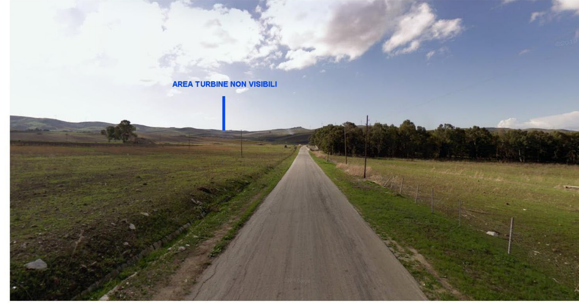
FOTOINSEIRIMENTO 1 - POST OPERAM: Dal punto di ripresa fotografico Lago Rubino - Trapani che dista dall'aerogeneratore più vicino circa 7 Km, il Parco eolico NON risulta visibile.