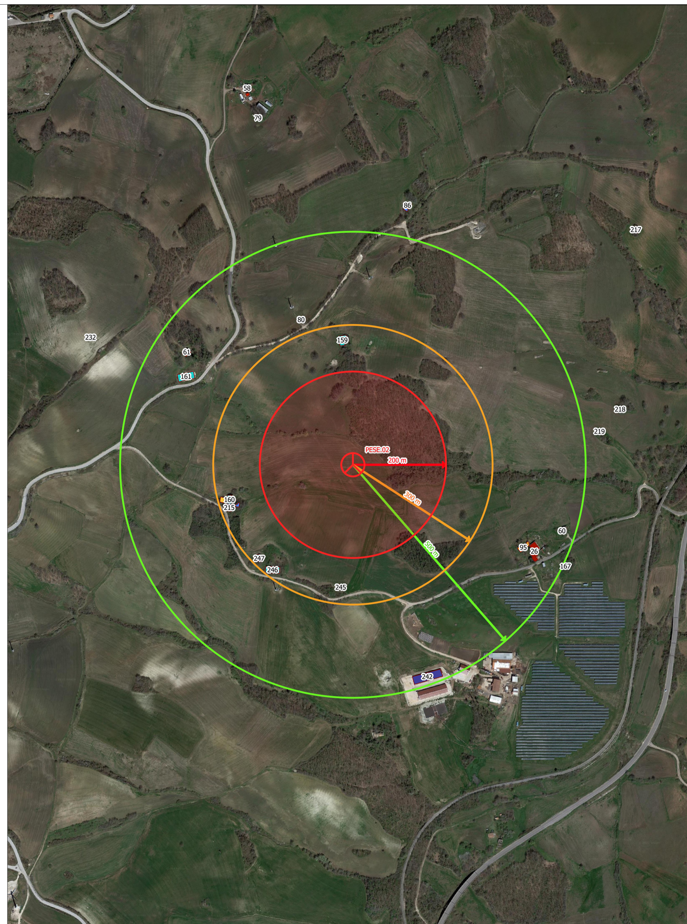
ESTRATTO DI ORTOFOTO CON INDICAZIONE DEI FABBRICATI SCALA 1:5.000