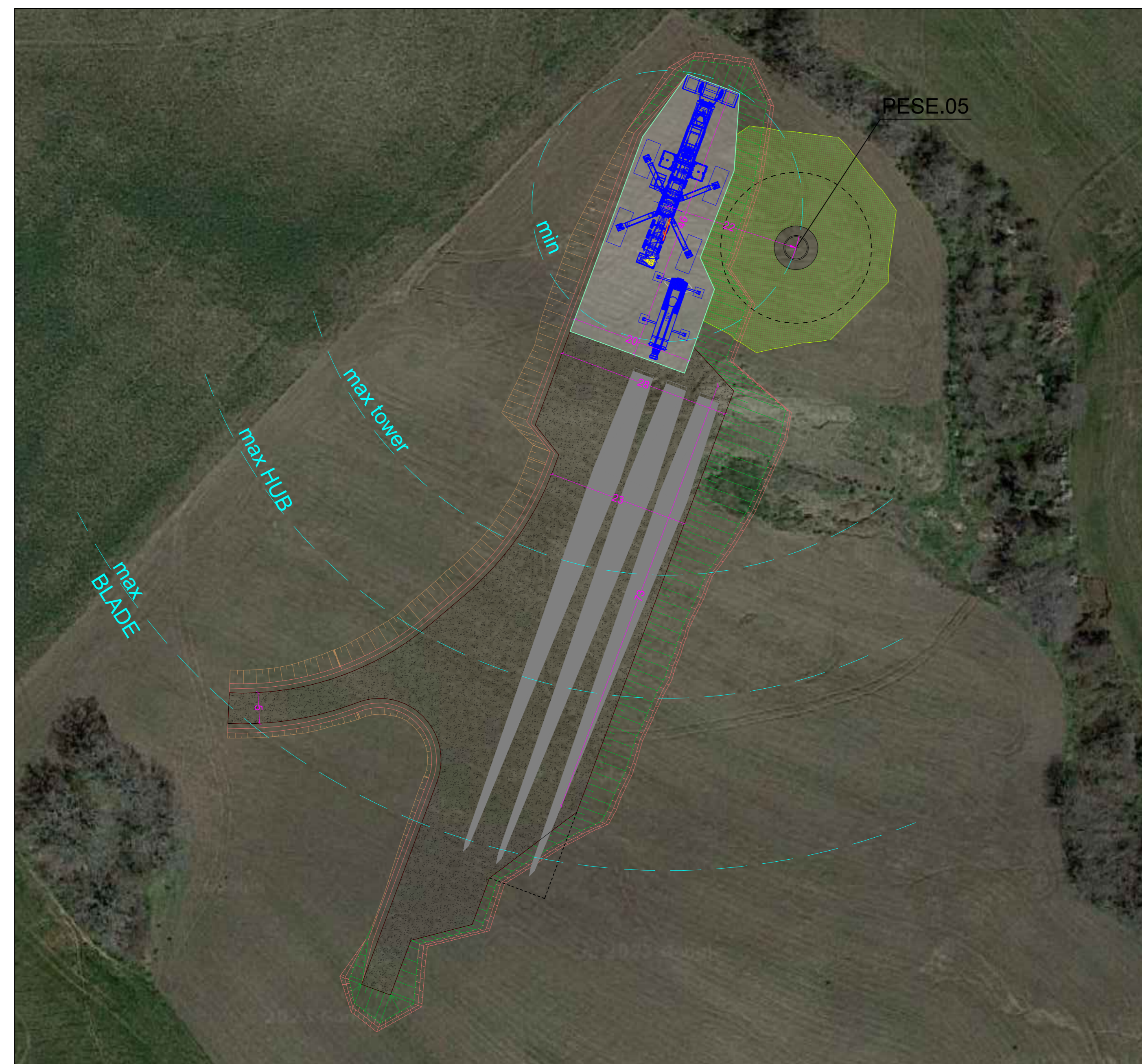
CONFIGURAZIONE 4 - MONTAGGIO LAME - SCALA 1:500