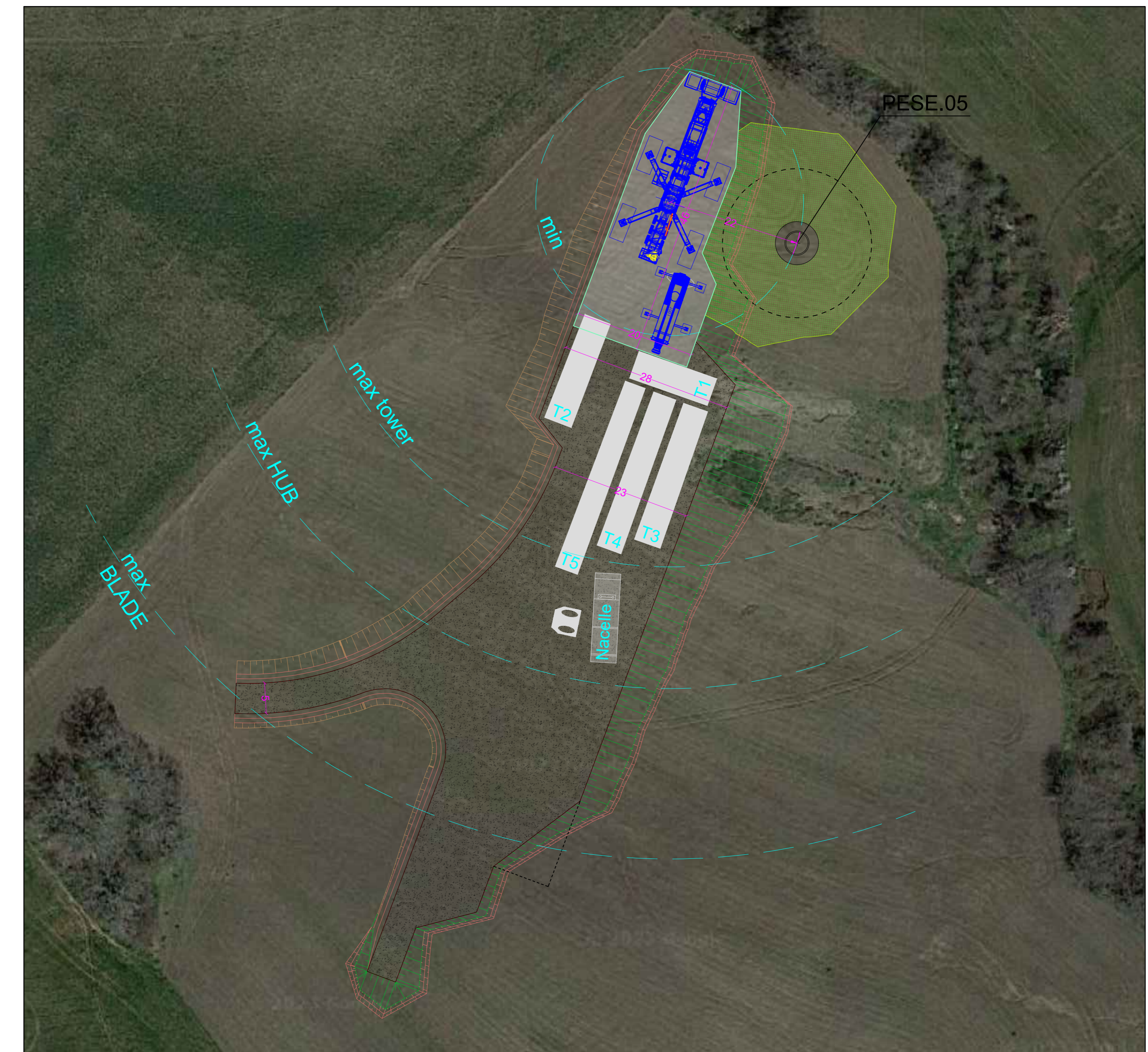
CONFIGURAZIONE 3- MONTAGGIO TRAMI E NAVICELLA - SCALA 1:500