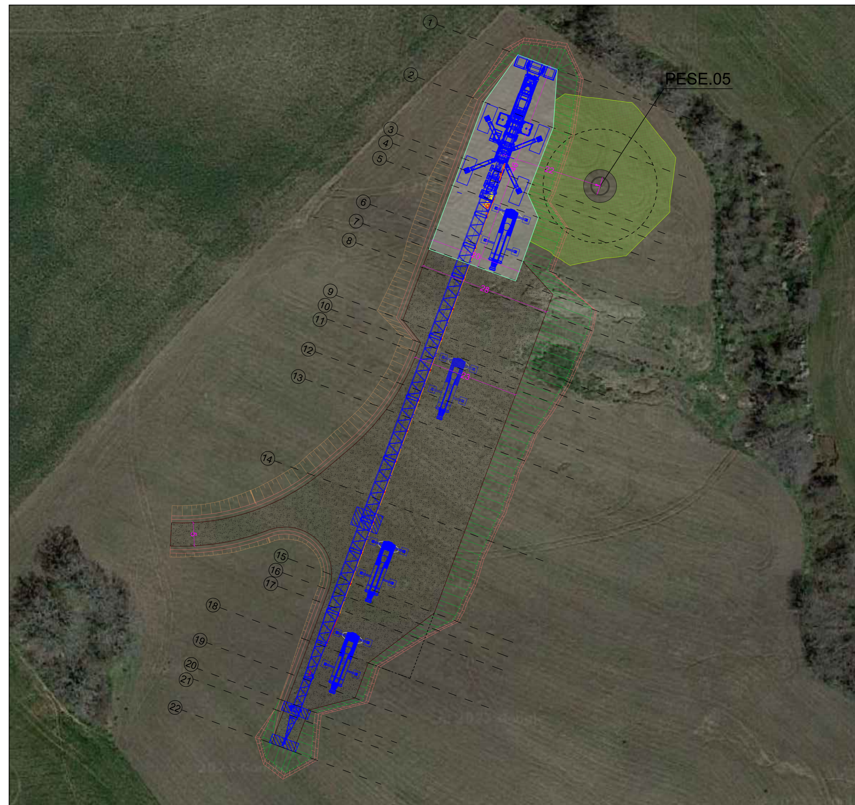
CONFIGURAZIONE 2 - MONTAGGIO GRU TRALICCIATA - SCALA 1:500