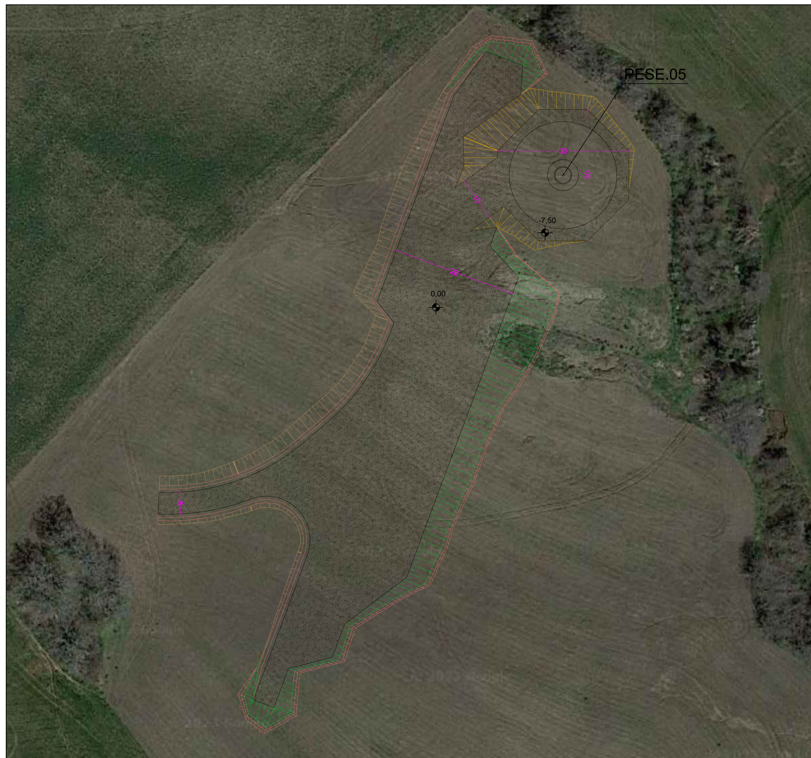
CONFIGURAZIONE 1 - SCAVO DI FONDAZIONE - SCALA 1:500