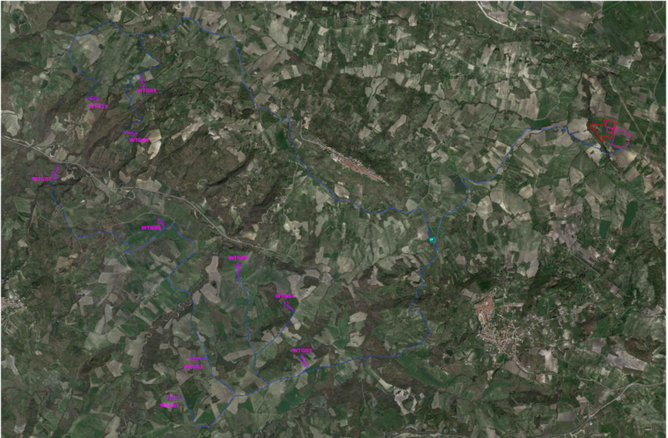
Figura 1 Inquadramento territoriale delle opere su base ortofotografica