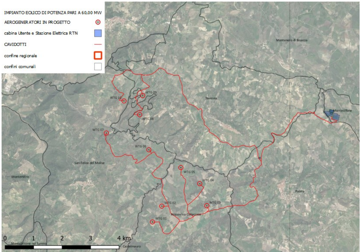
Figura 1 aerofoto ambito territoriale area d'impianto