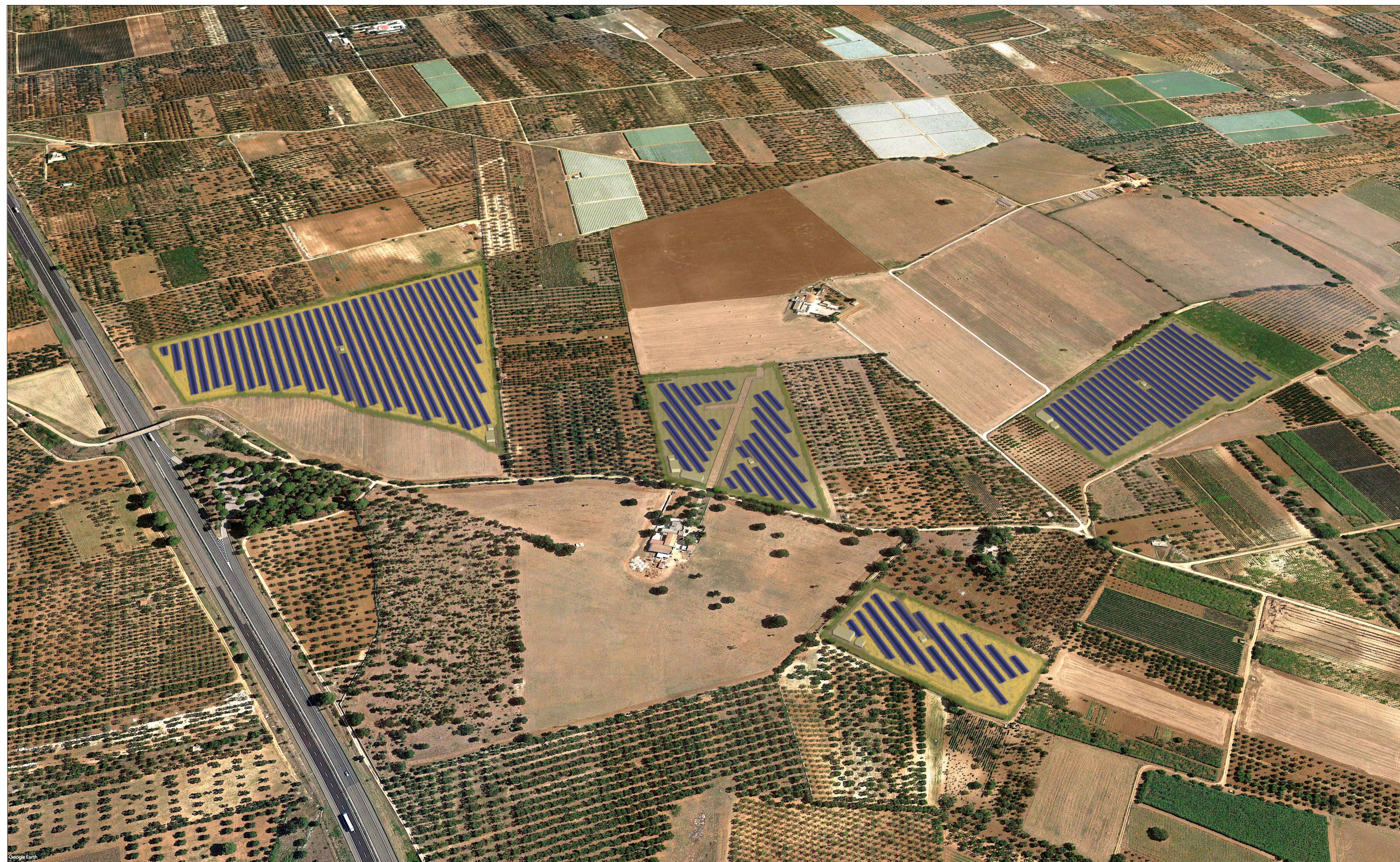
BRIEVIEW STATO DI PROGETTO - AREA NORD