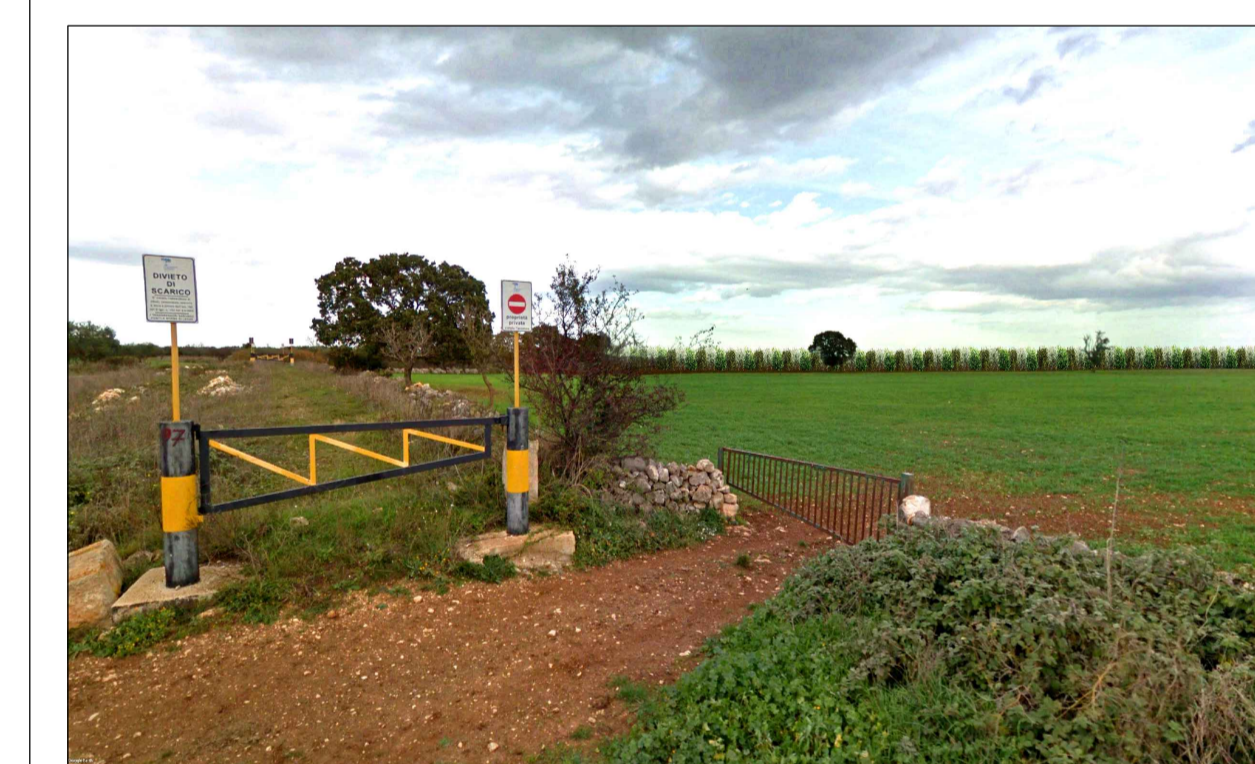
FOTOINSERIMENTO 2 - STATO DI PROGETTO