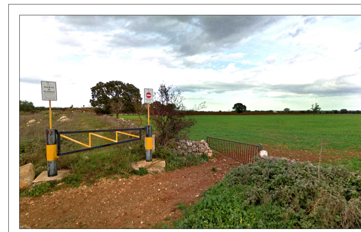
FOTOINSERIMENTO 2 - STATO DI FATTO