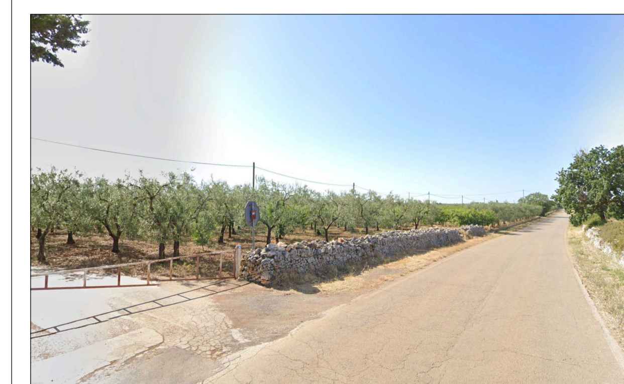
PUNTO DI PRESA FOTOGRAFICA 14