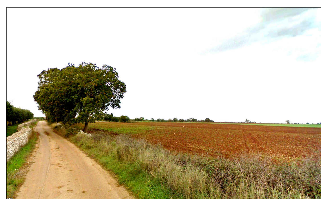
FOTOINSERIMENTO 1 - STATO DI FATTO