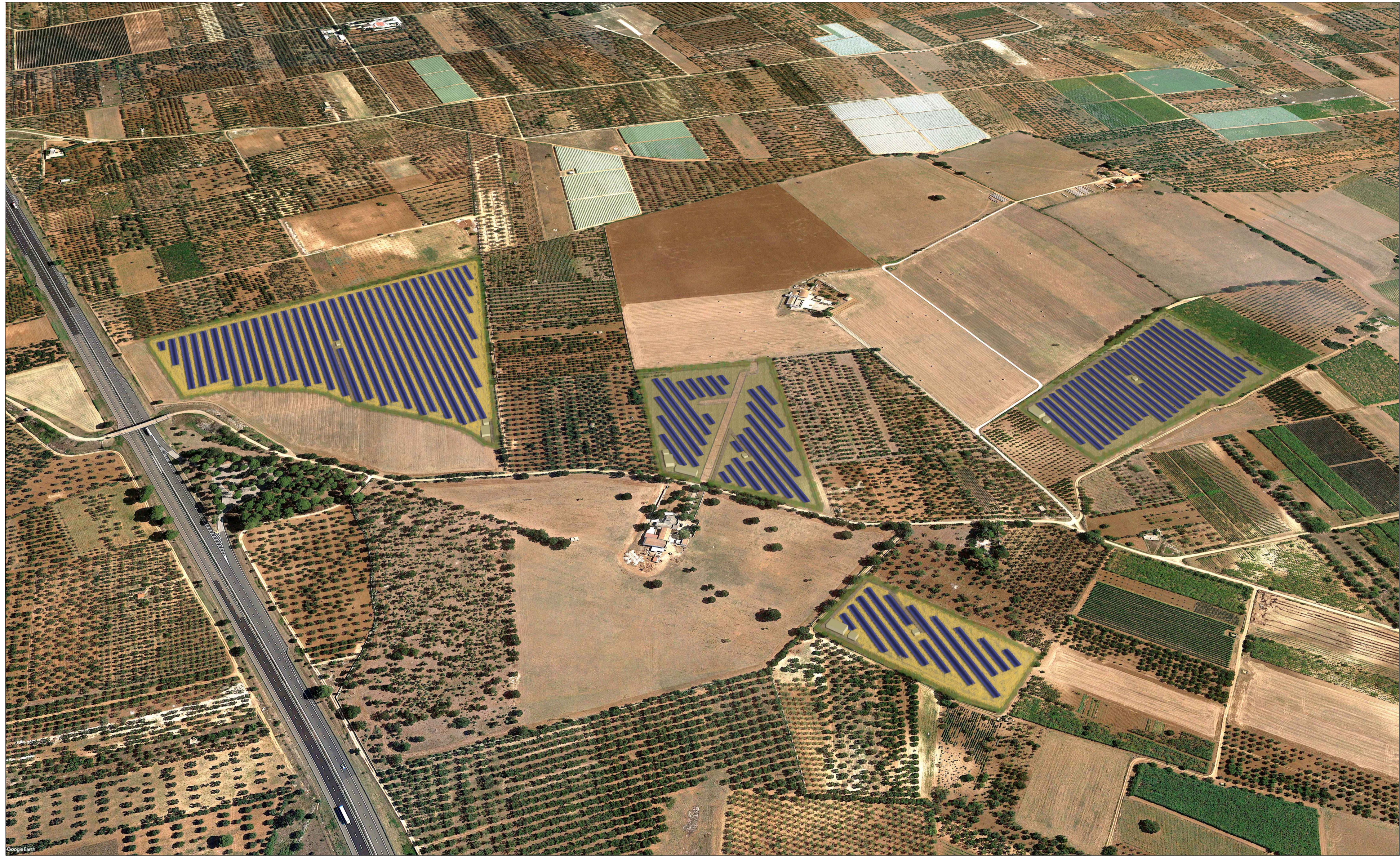
BRIEVIEW STATO DI PROGETTO - AREA NORD