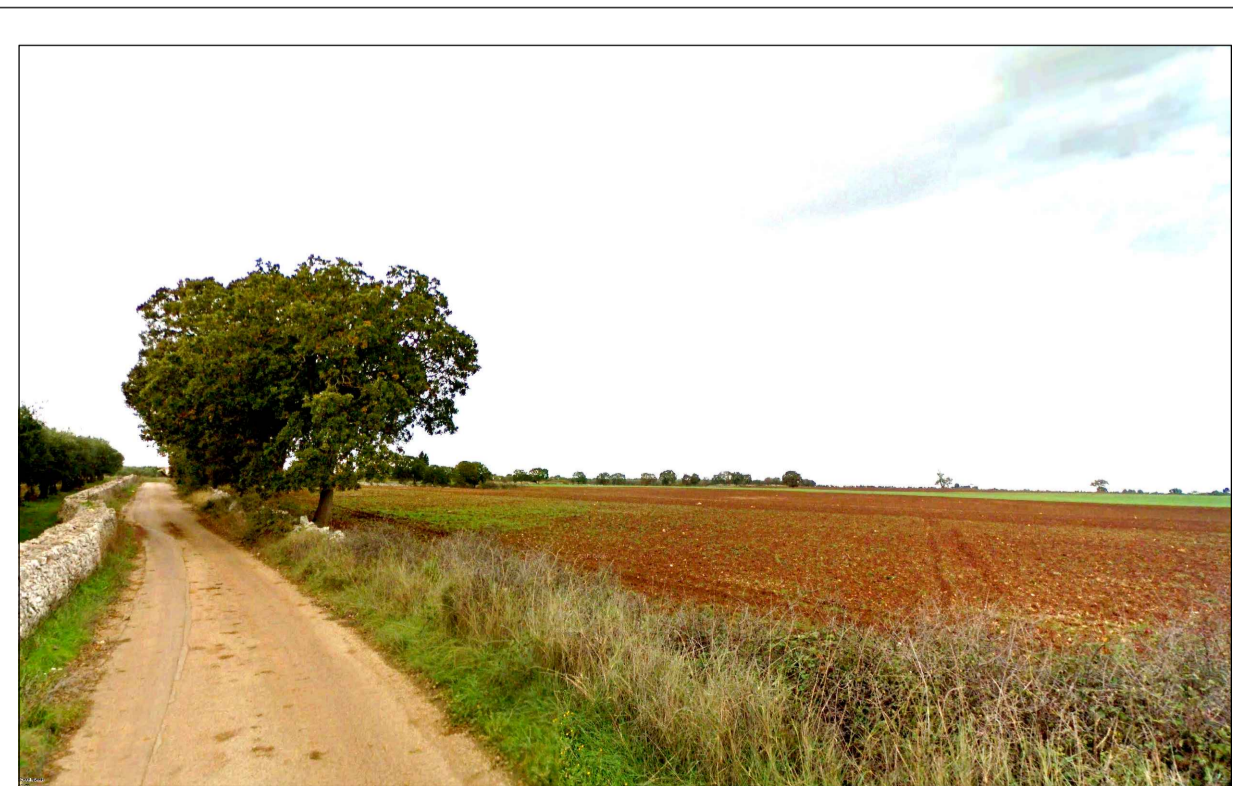
FOTOINSERIMENTO 1 - STATO DI FATTO