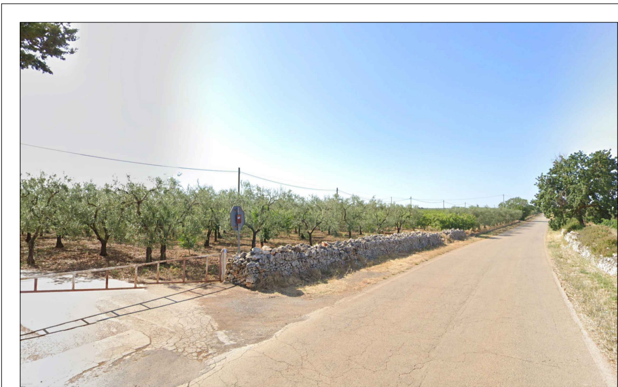
PUNTO DI PRESA FOTOGRAFICA 14