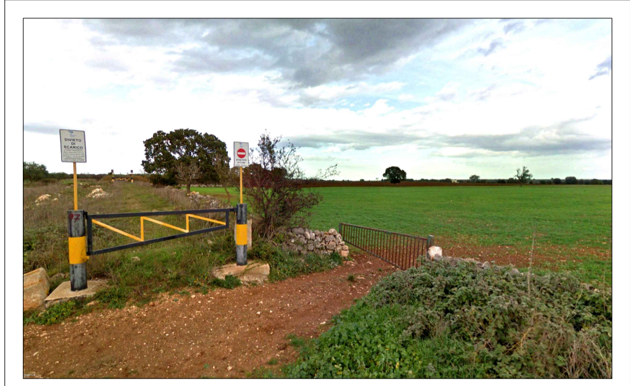
FOTOINSERIMENTO 2 - STATO DI FATTO