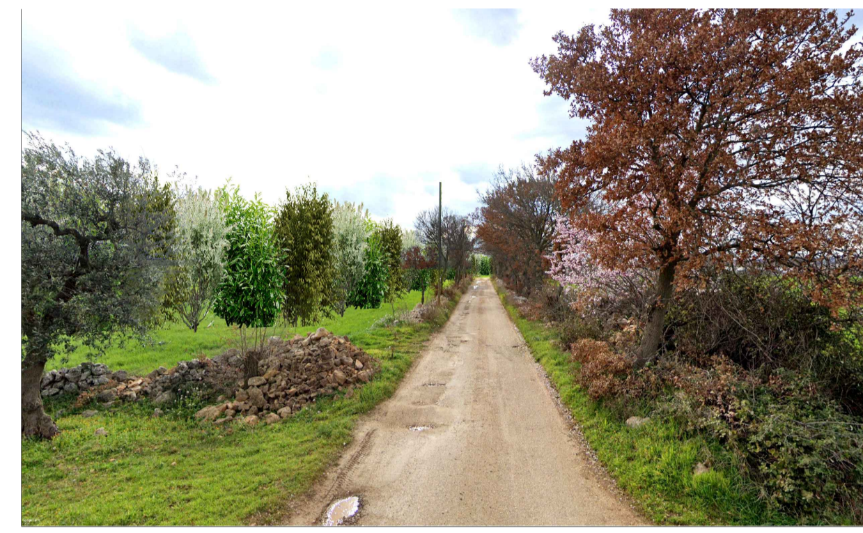
FOTOINSERIMENTO 4 - STATO DI PROGETTO