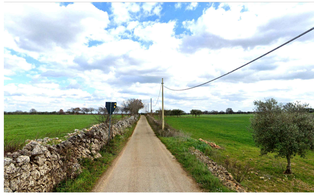
FOTOINSERIMENTO 5 - STATO DI FATTO