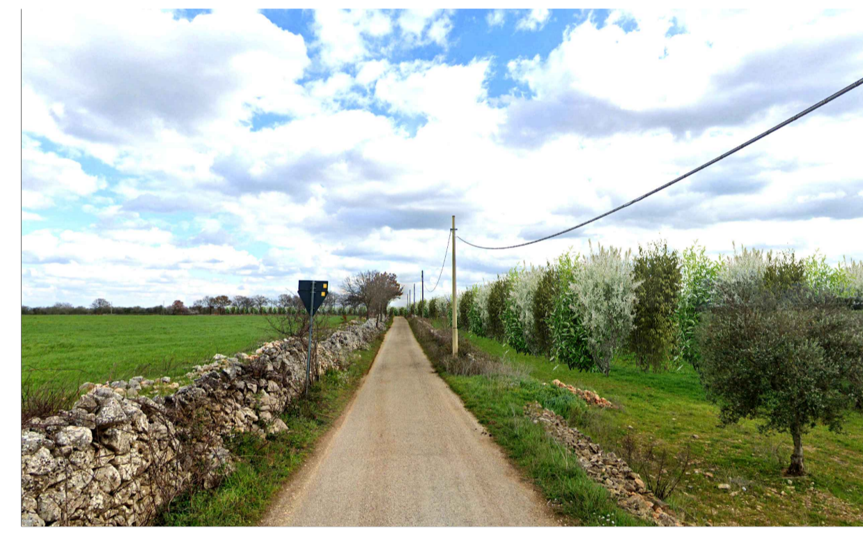
FOTOINSERIMENTO 5 - STATO DI PROGETTO