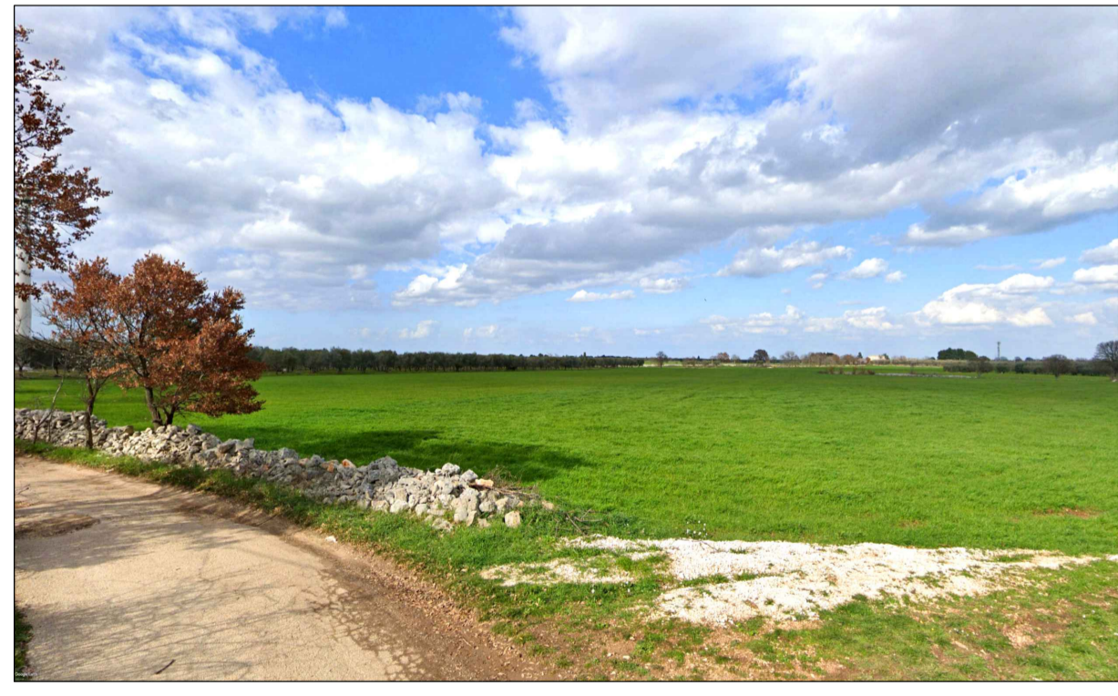
FOTOINSERIMENTO 6 - STATO DI FATTO