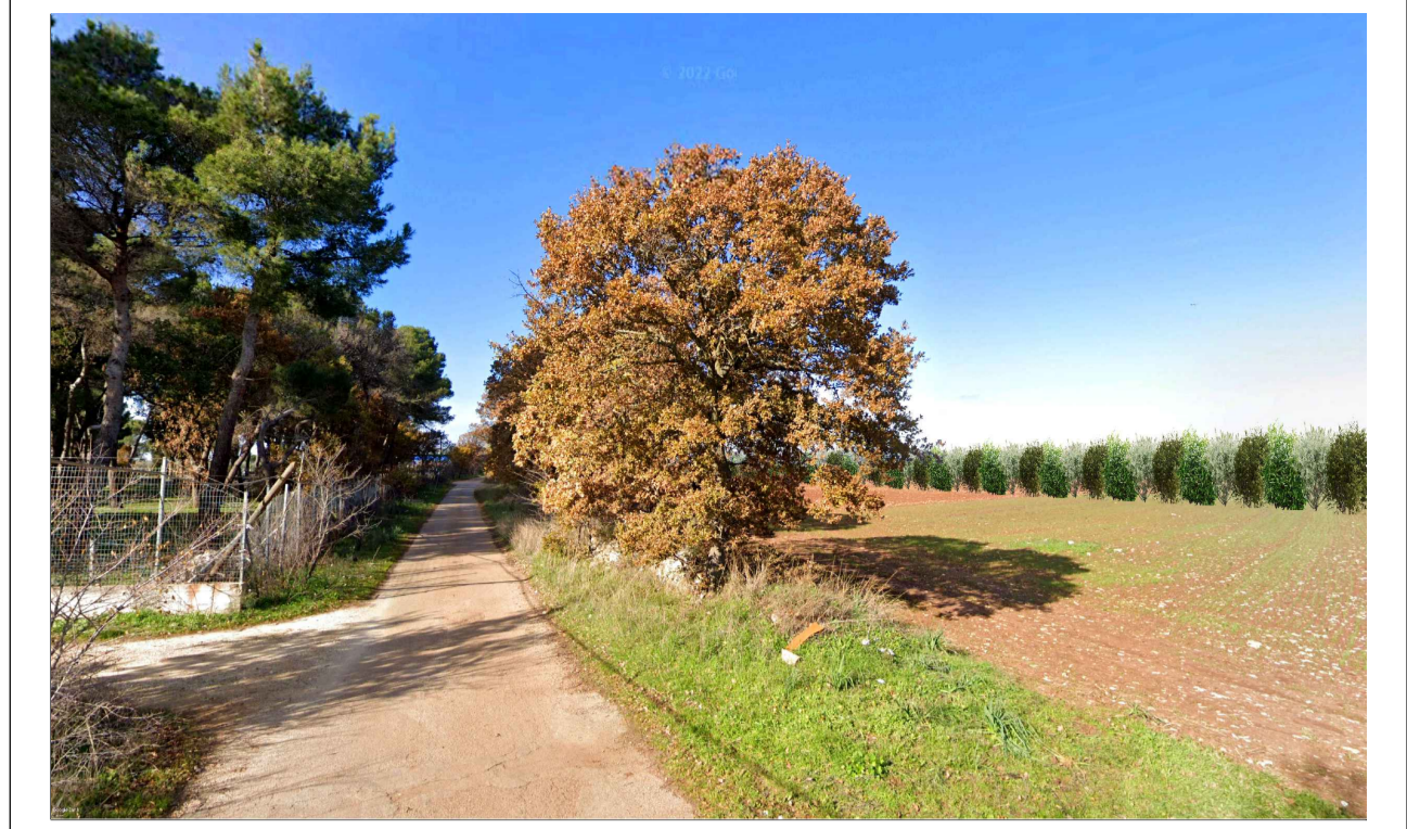
FOTOINSERIMENTO 11 - STATO DI FATTO