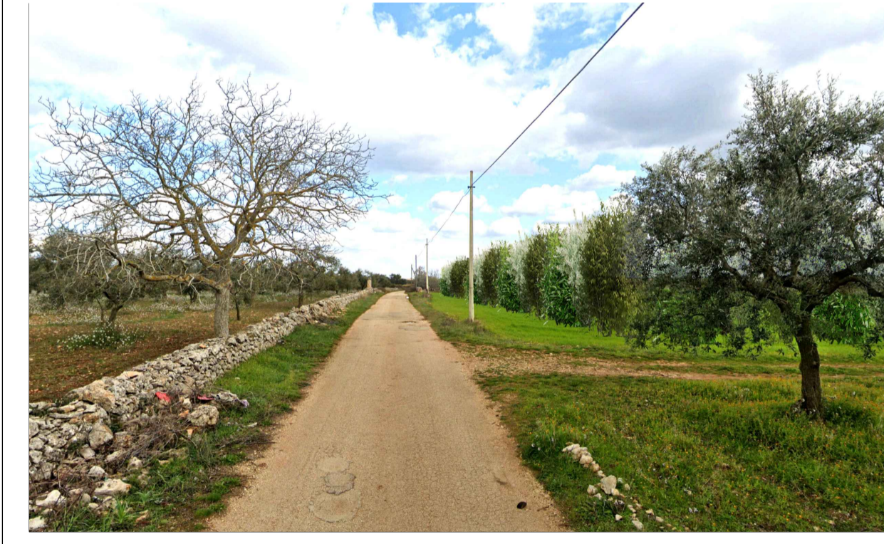
FOTOINSERIMENTO 8 - STATO DI PROGETTO