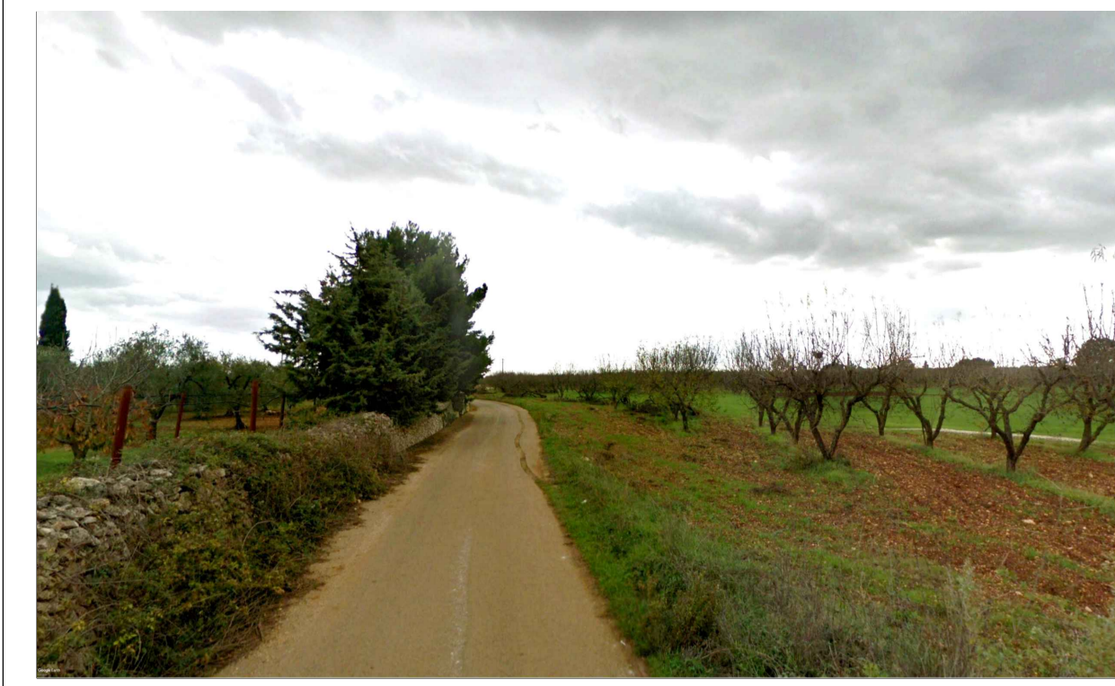
FOTOINSERIMENTO 7 - STATO DI FATTO