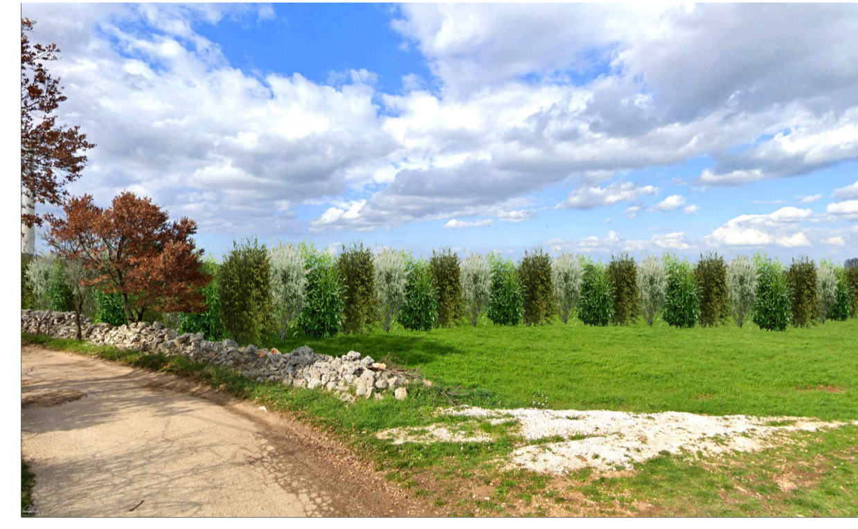
FOTOINSERIMENTO 6 - STATO DI PROGETTO