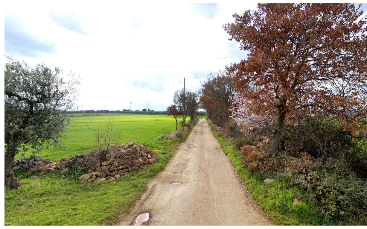
FOTOINSERIMENTO 4 - STATO DI FATTO