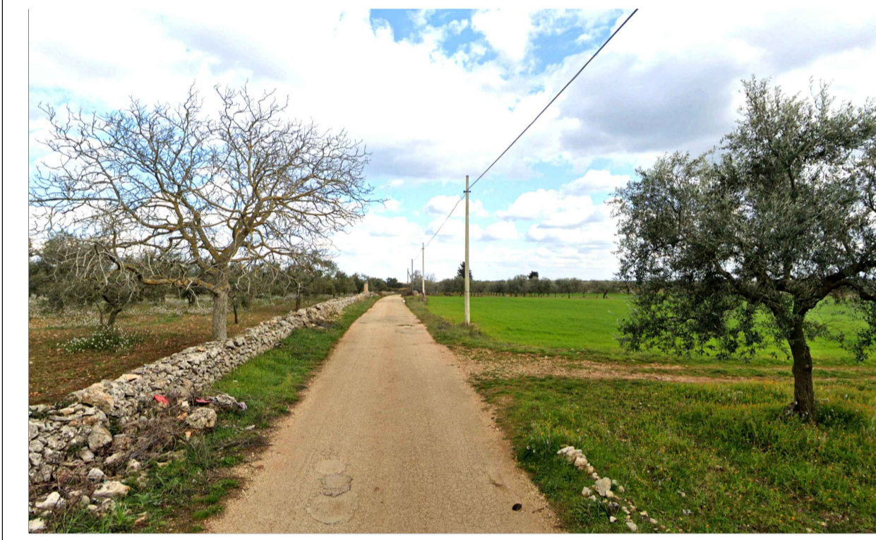
FOTOINSERIMENTO 8 - STATO DI FATTO