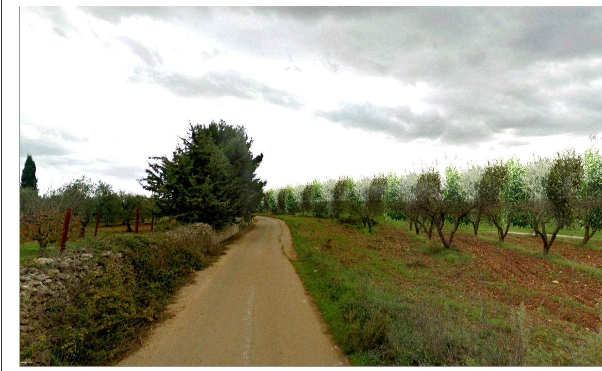
FOTOINSERIMENTO 7 - STATO DI PROGETTO