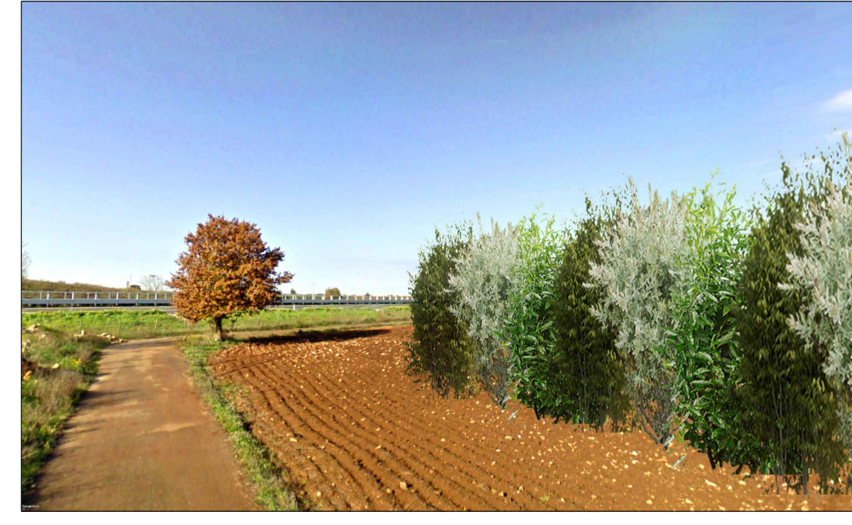
FOTOINSERIMENTO 13 - STATO DI PROGETTO