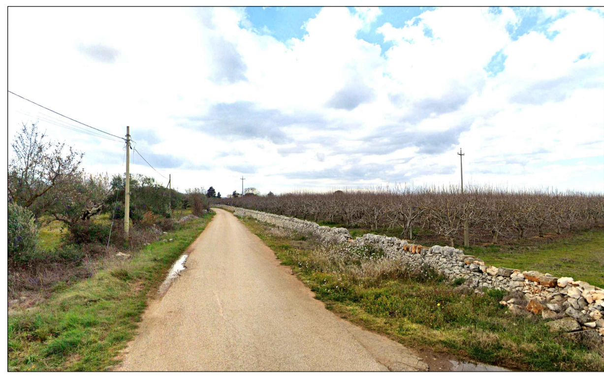
FOTOINSERIMENTO 3 - STATO DI FATTO