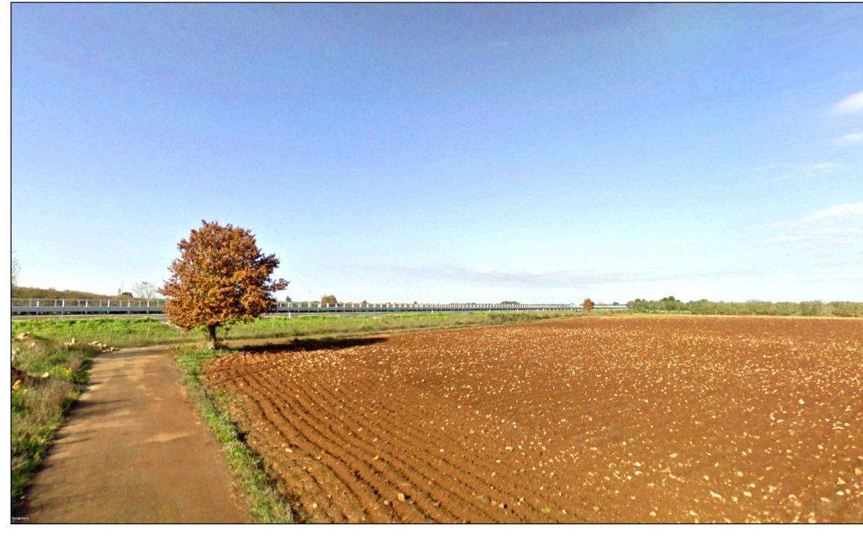
FOTOINSERIMENTO 13 - STATO DI FATTO