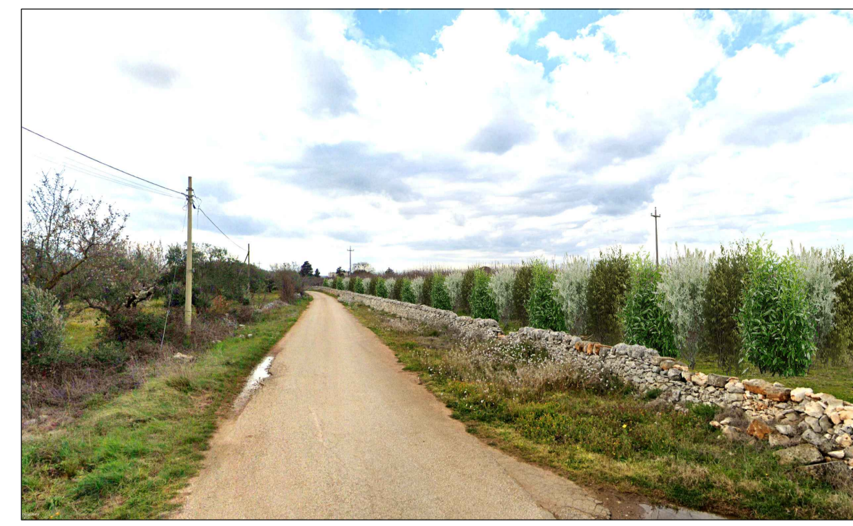
FOTOINSERIMENTO 3 - STATO DI PROGETTO