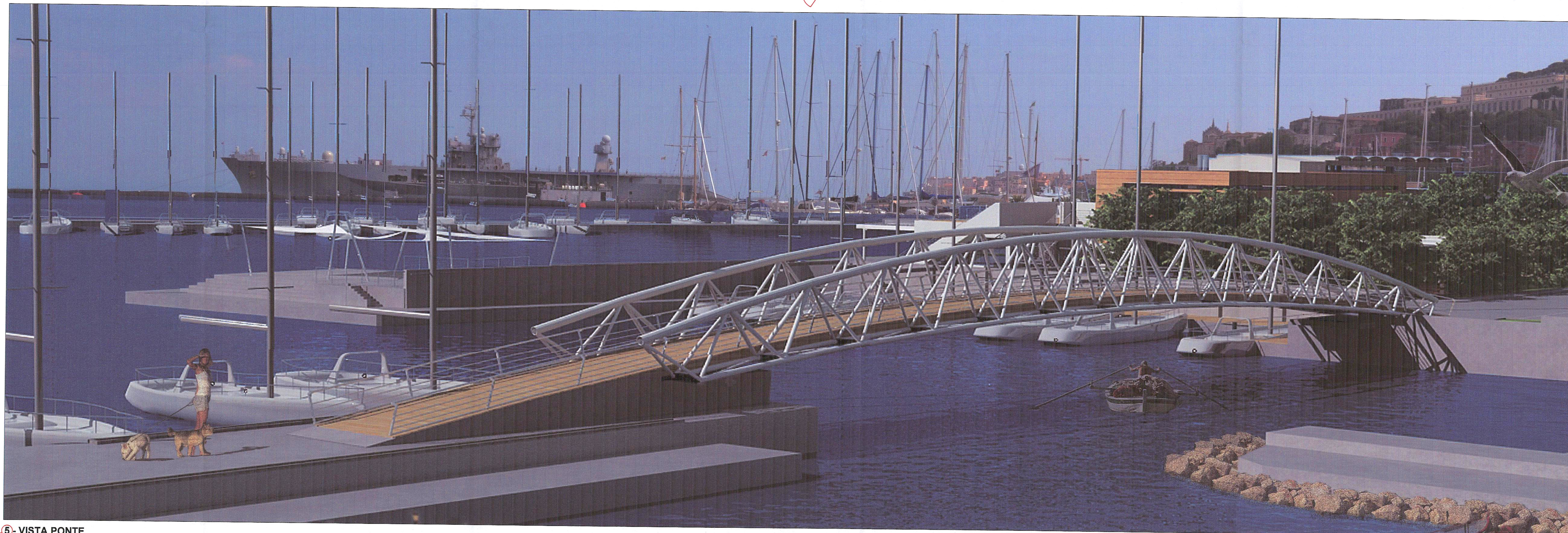
5- VISTA PONTE