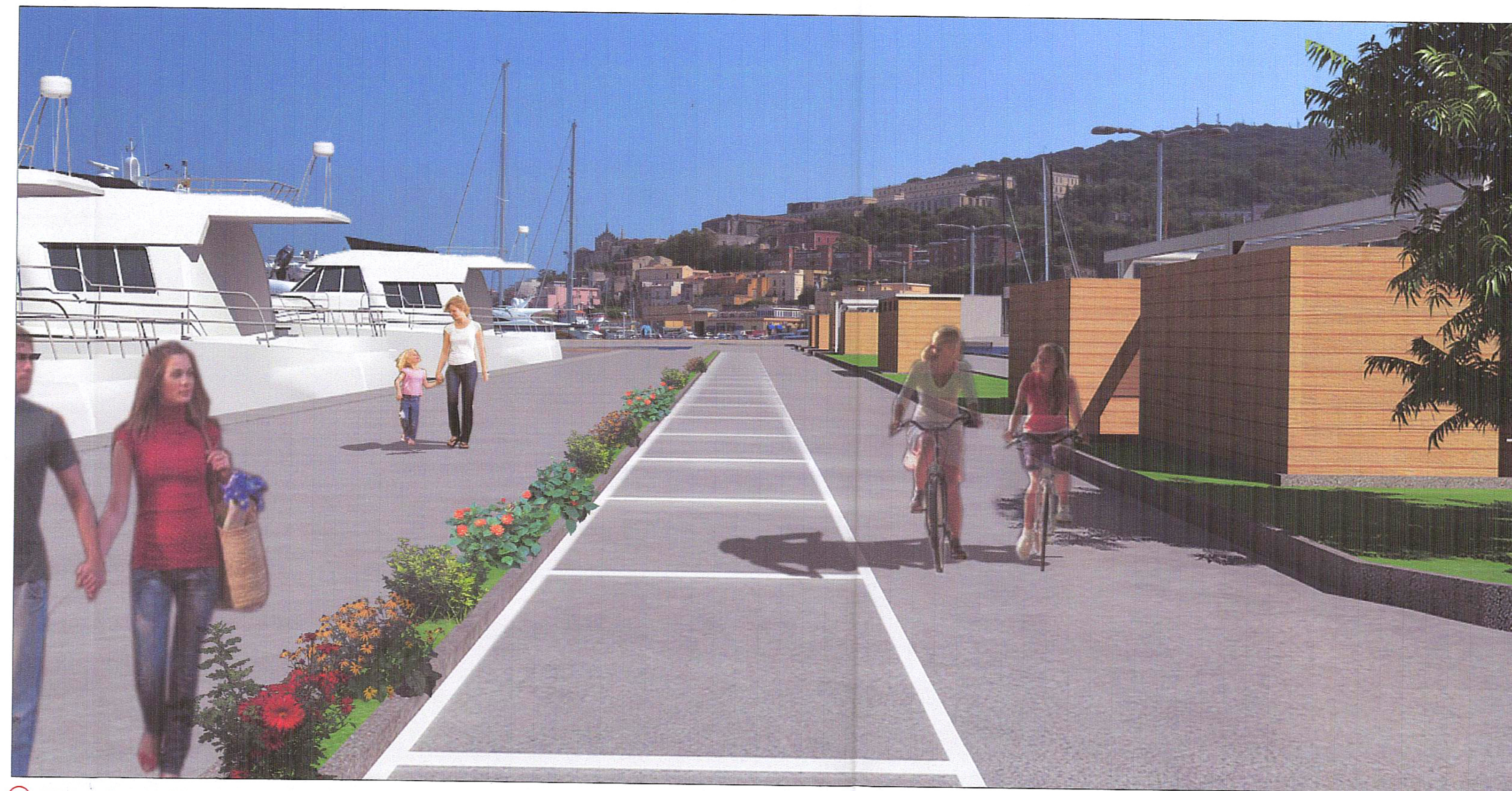
2- VISTA BANCHINA ED EDIFICIO DP2