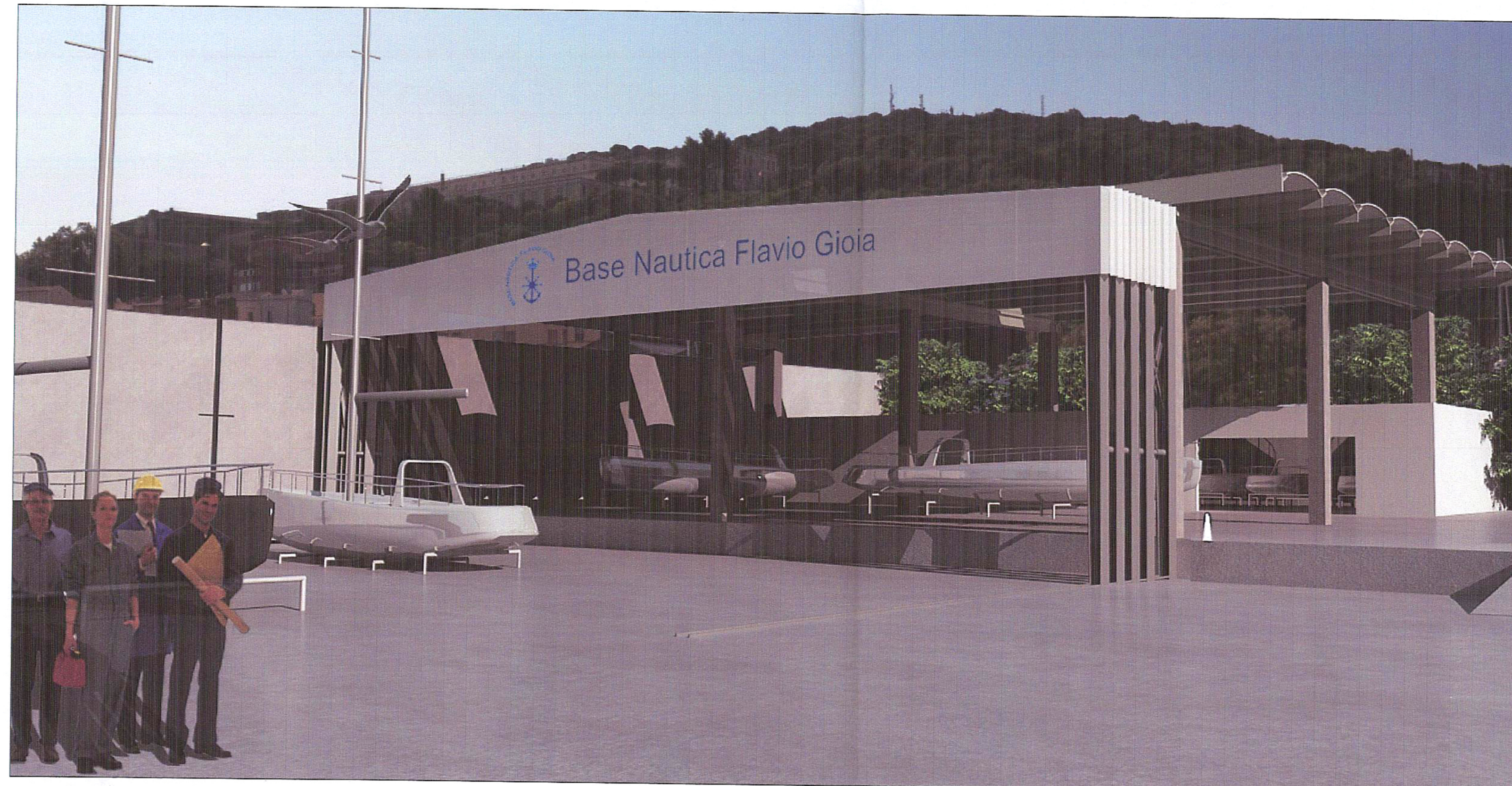
4- VISTA CAPANNONE C_RL1 e C_RL2