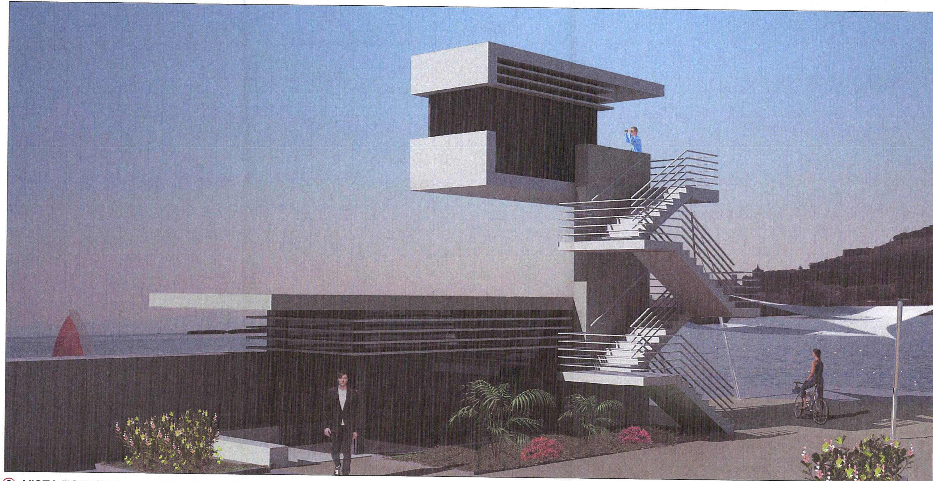
3- VISTA TORRE DI CONTROLLO TC