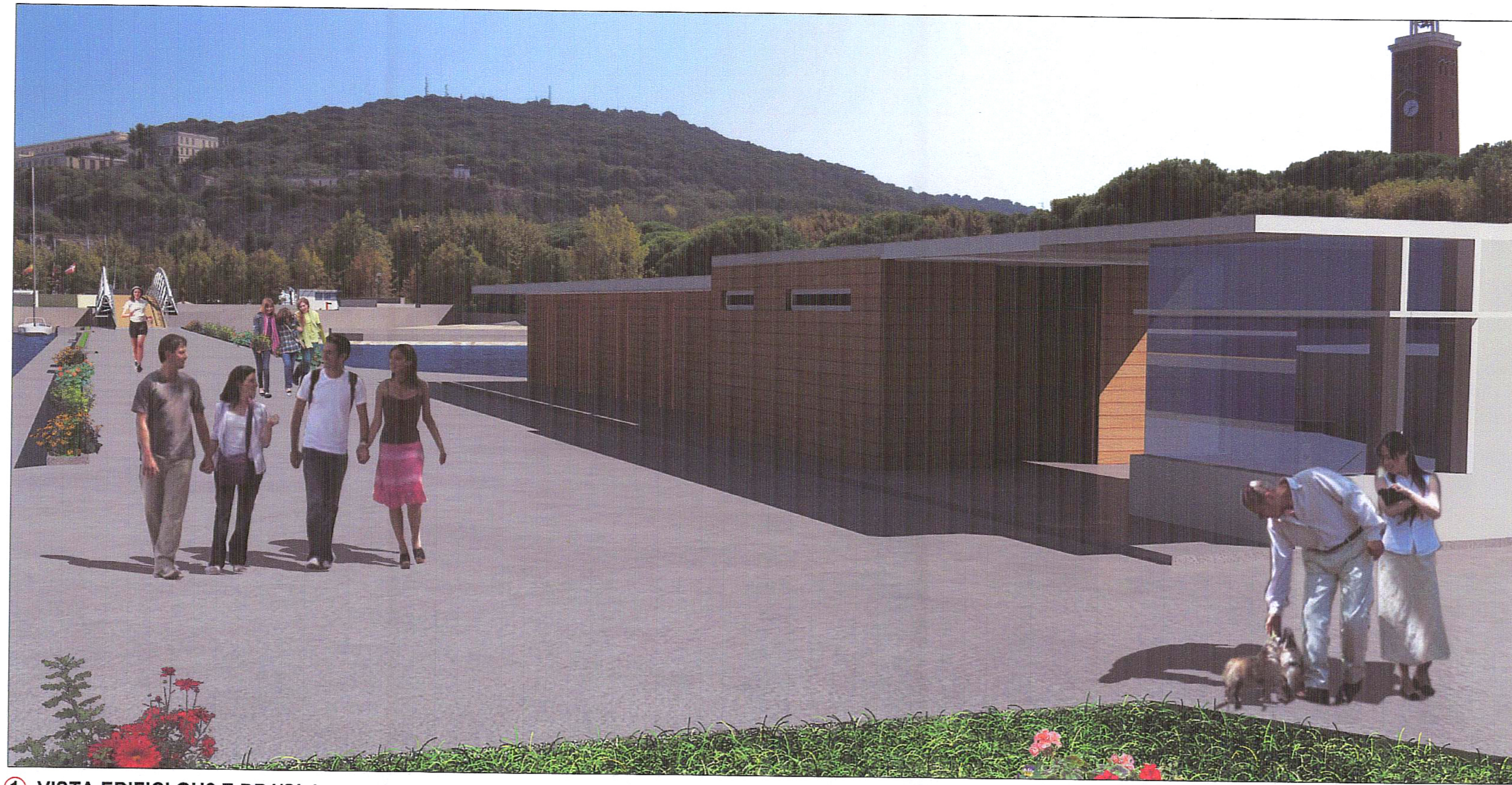
1- VISTA EDIFICI GU2 E DP4/SL4