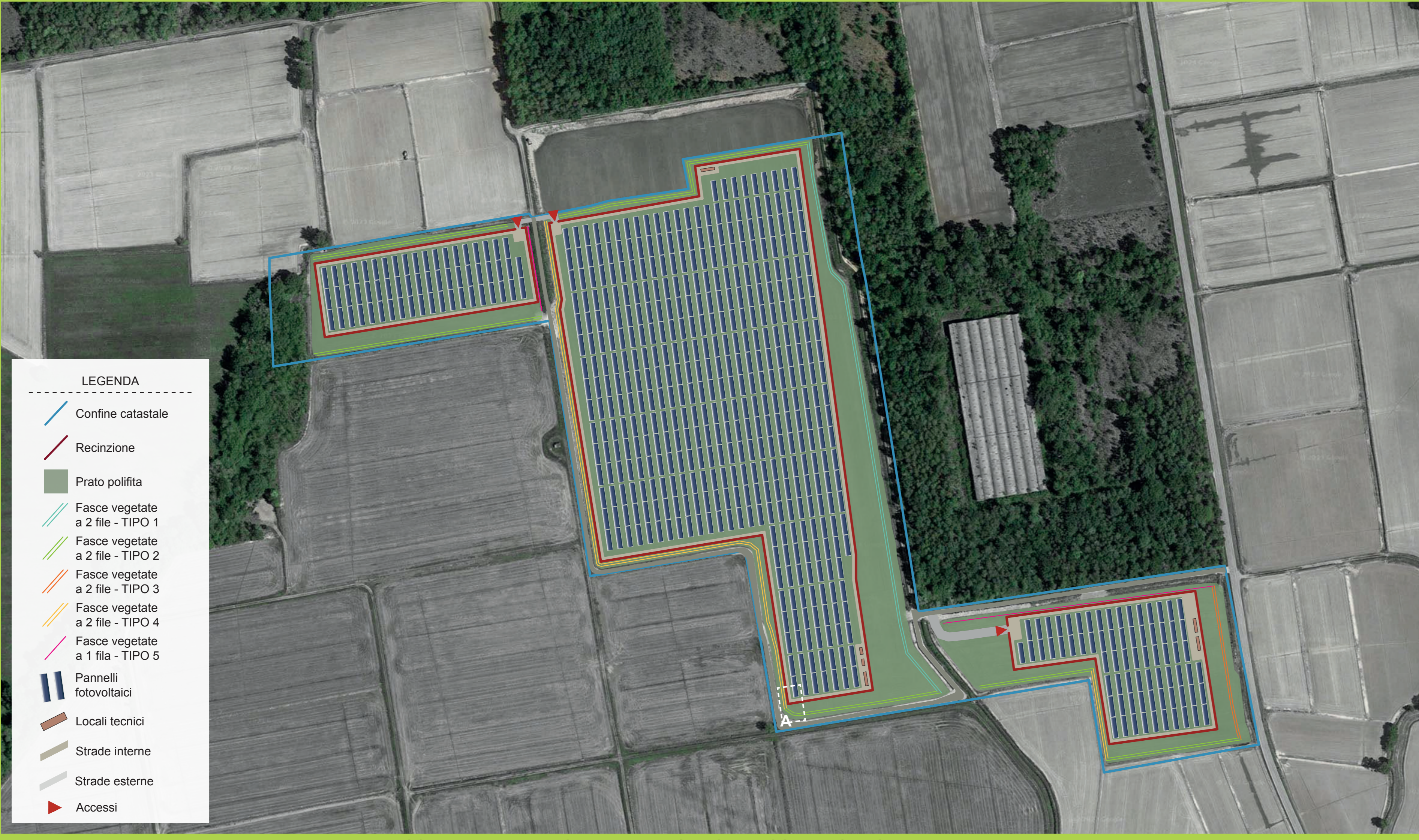
SCALA 1:2500 | OPERE DI MITIGAZIONE E COMPENSAZIONE AMBIENTALE