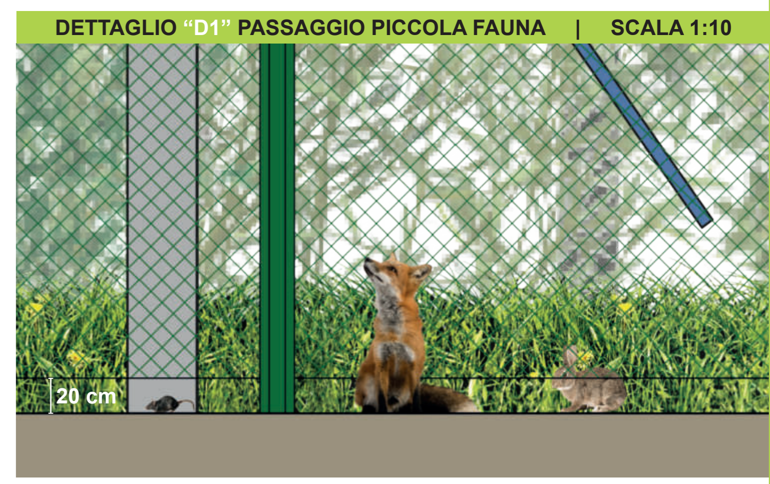
DETTAGLIO "D1" PASSAGGIO PICCOLA FAUNA | SCALA 1:10