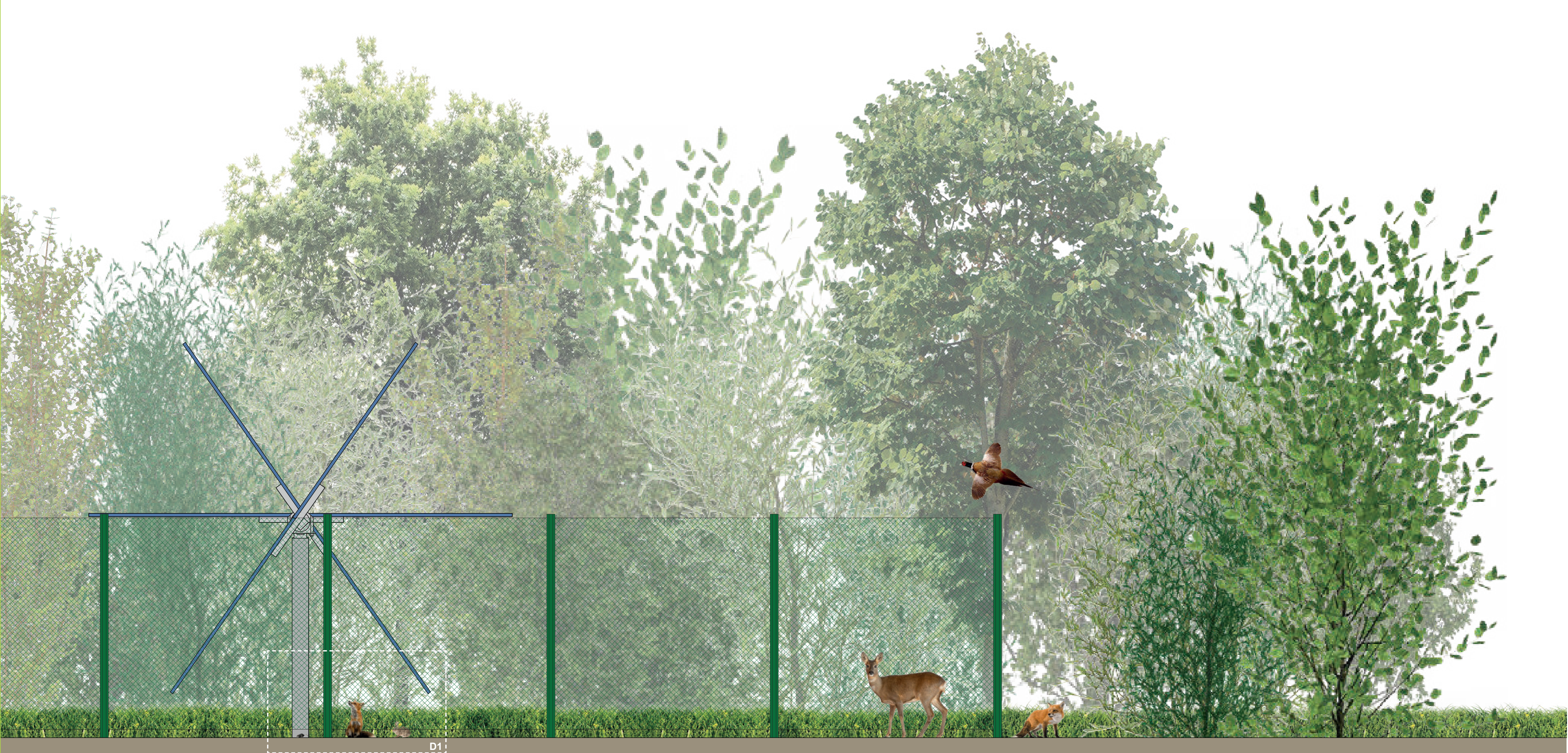
SCALA 1:20 | SEZIONE "A" - PARTICOLARE OPERE PASSAGGIO FAUNA