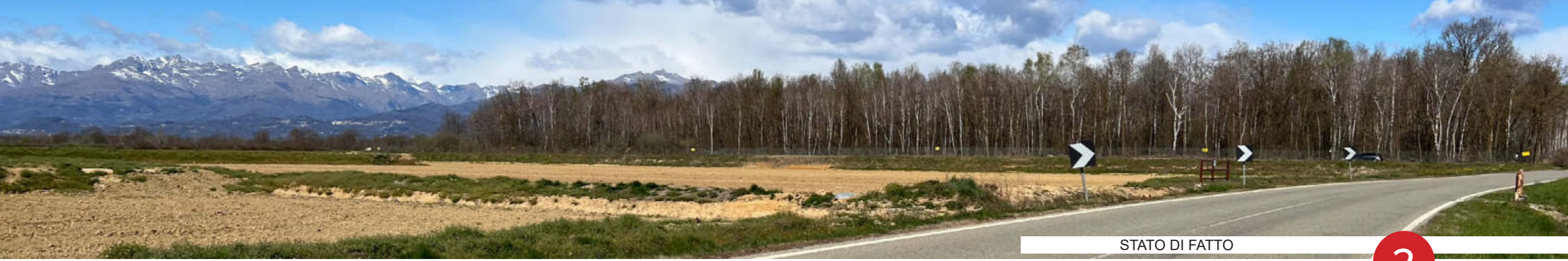
STATO DI FATTO IMPIANTO FOTOVOLTAICO