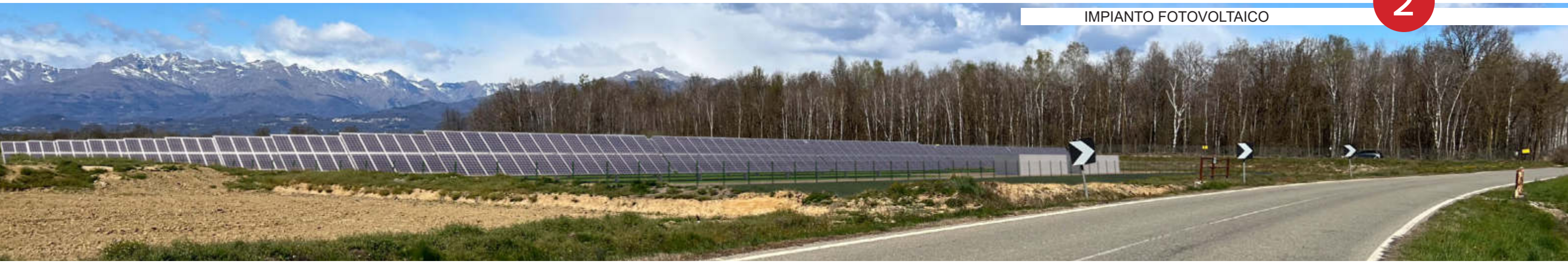
MITIGAZIONI PAESAGGISTICO- AMBIENTALI