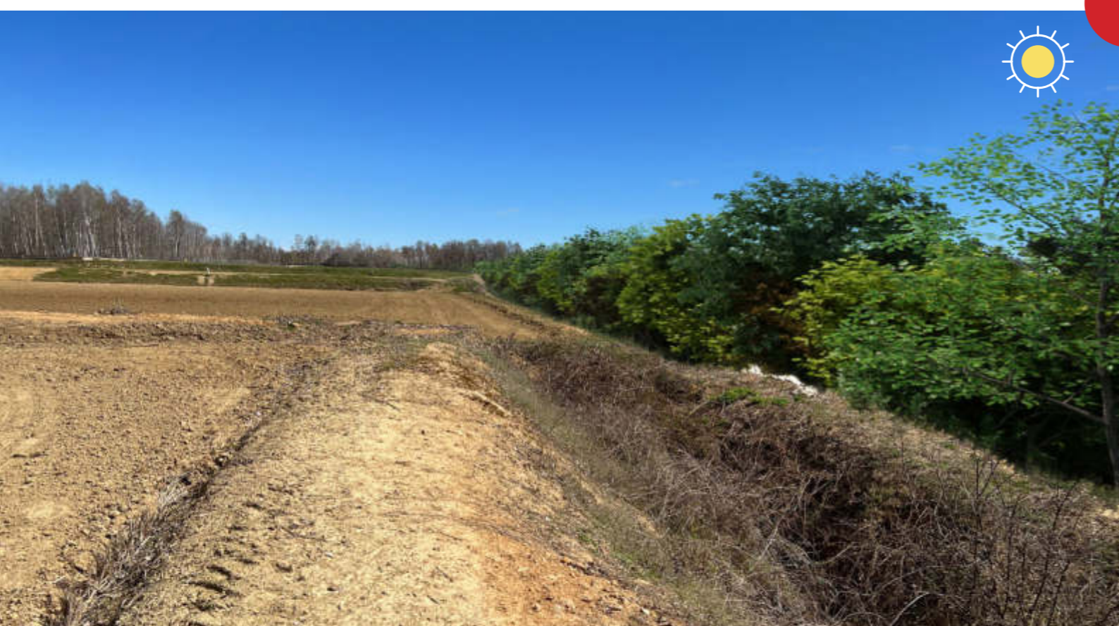
MITIGAZIONI PAESAGGISTICO- AMBIENTALI