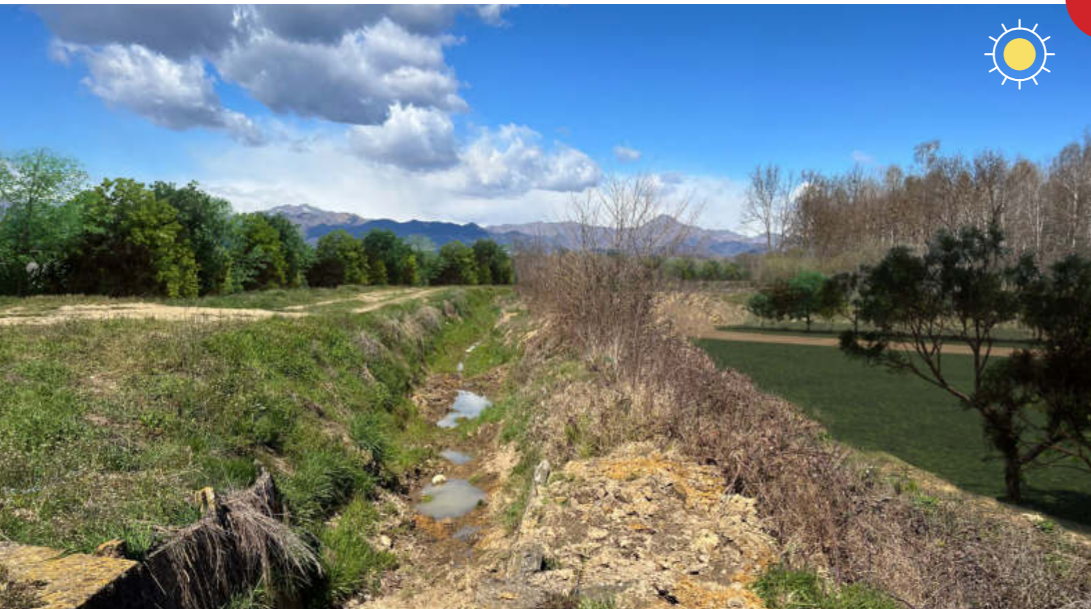
MITIGAZIONI PAESAGGISTICO- AMBIENTALI