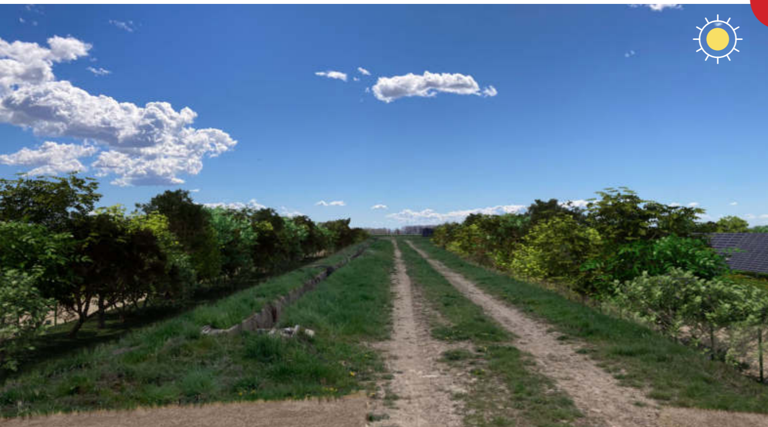
MITIGAZIONI PAESAGGISTICO- AMBIENTALI