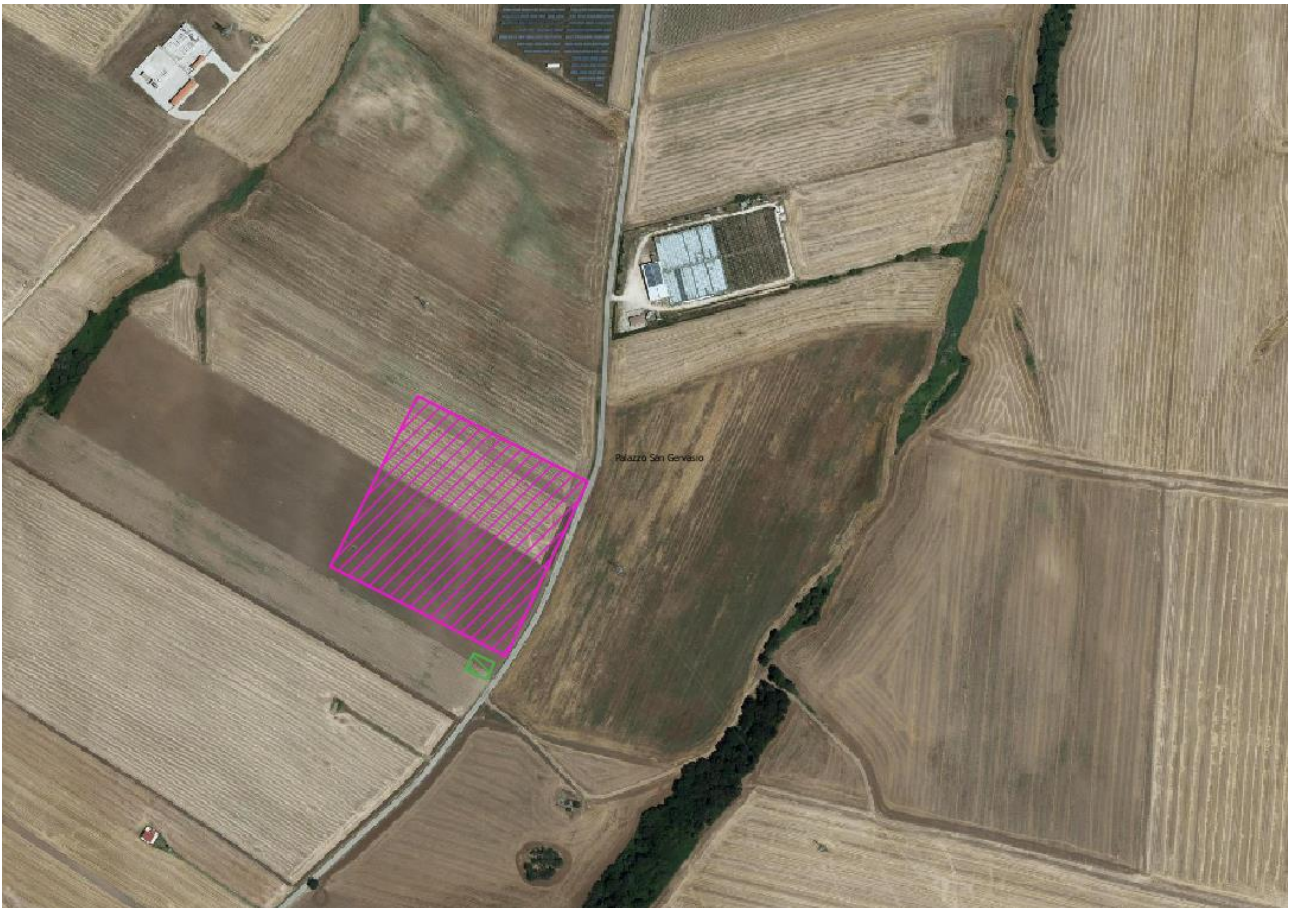
Figura 2 -Ipotesi posizionamento futura SE-Terna (in viola), in verde posizionamento Stazione di Consegna