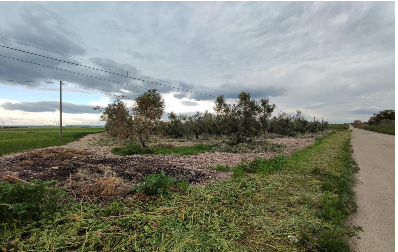
Visuale paesaggistica del fondo agricolo