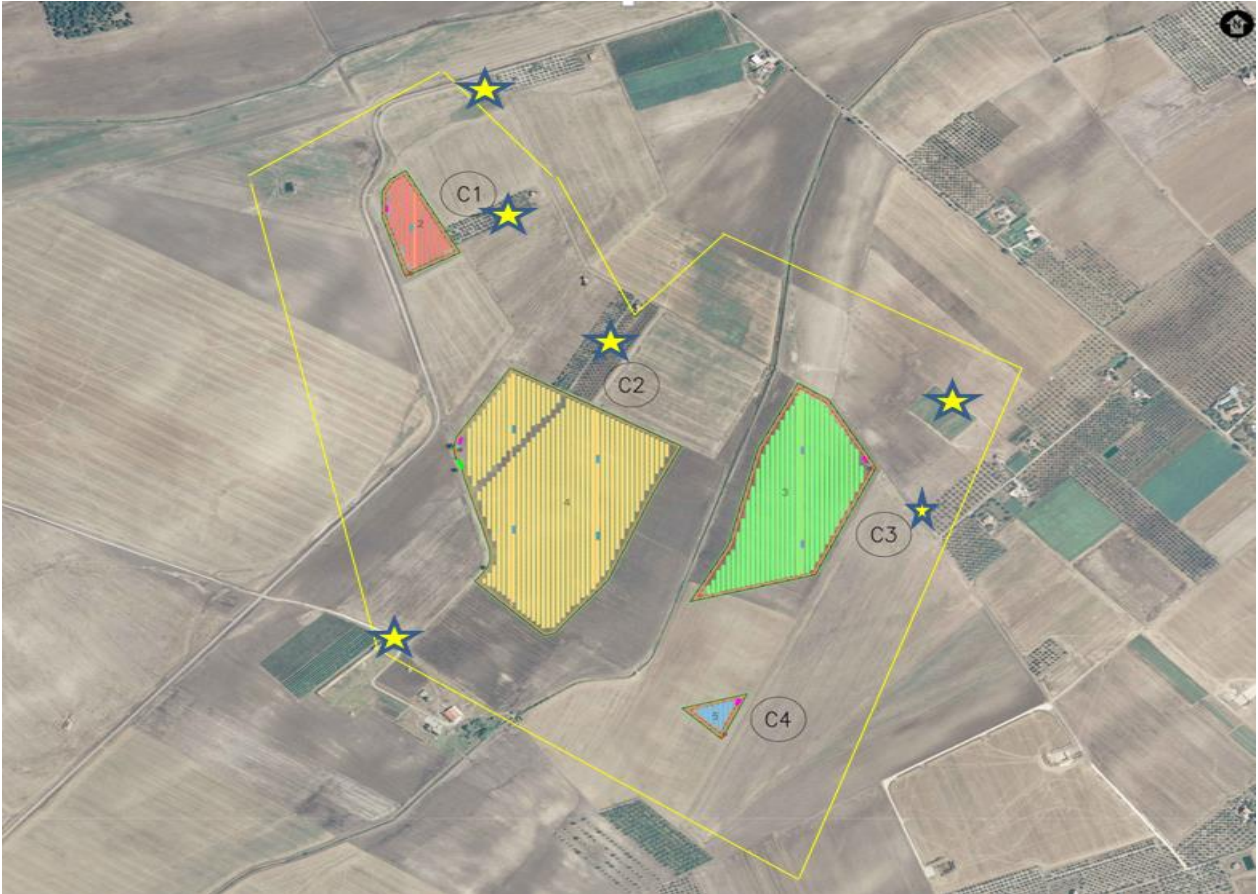
Agro di Troia – buffer 500 mt