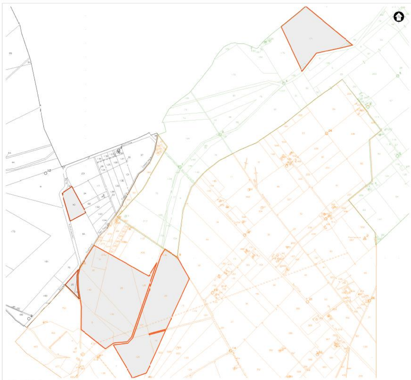
Mappa catastale agro di Troia