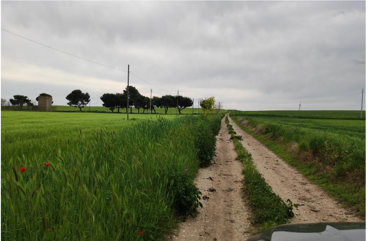
Elementi paesaggistici nei pressi del sito