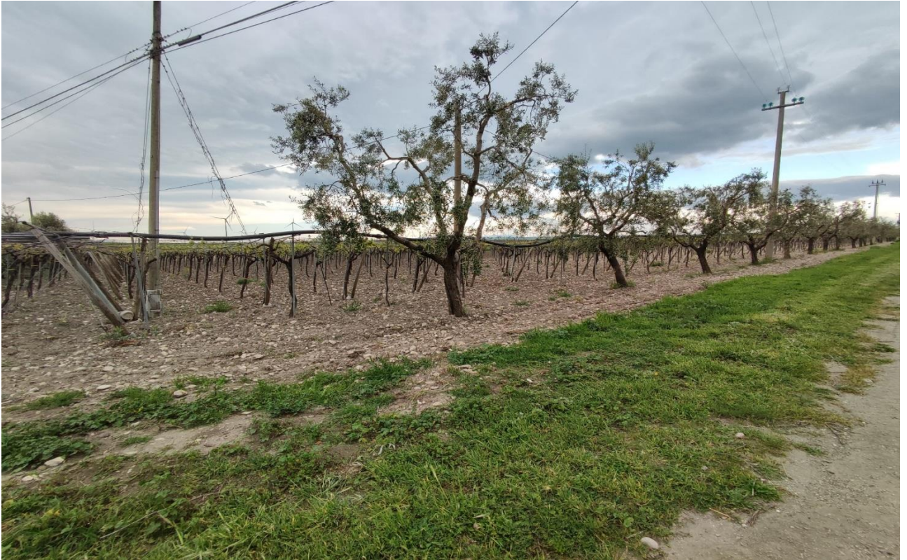
Coltivazione di un appezzamento olivetato nell'area perimetrale sud - ovest