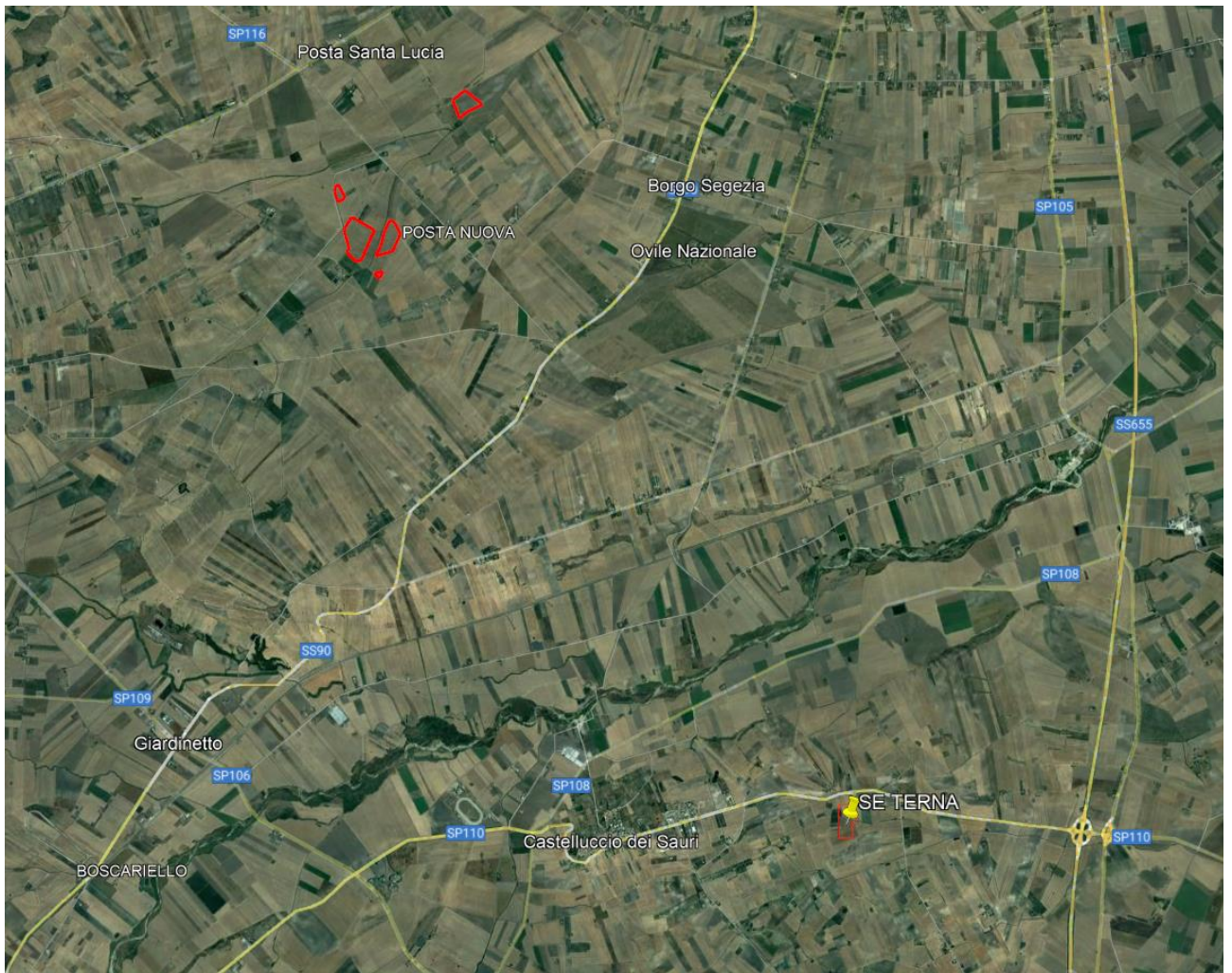
Ortofoto agro di Troia

Il PTCP di Foggia ha individuato degli Ambiti di paesaggio che caratterizzano il territorio provinciale a cui ha abbinato una sintetica individuazione dei sistemi di tutela, intesi non come vincoli allo sviluppo del territorio quanto, diversamente, come opportunità per la tutela e la valorizzazione della risorsa paesaggio. L'area individuata per lo sviluppo del progetto fotovoltaico ricade tra il comprensorio del Tavoliere e il promontorio del Gargano.