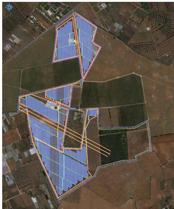
Figura 1. Individuazione dell'impianto agrivoltaico "Masseria Palombi" in territorio di Nardò

Il progetto definitivo delle opere di rete previste per la connessione dell'impianto alla Rete di Trasmissione Nazionale, composto dalla Stazione di trasformazione Terna 380 kV/150kV e dalla Substatione 150 kV/30kV, costituisce parte integrante del progetto definitivo dell'impianto fotovoltaico, è redatto a cura del produttore Nardò Solar Energy S.r.l. ed è integralmente allegato all'istanza di autorizzazione.