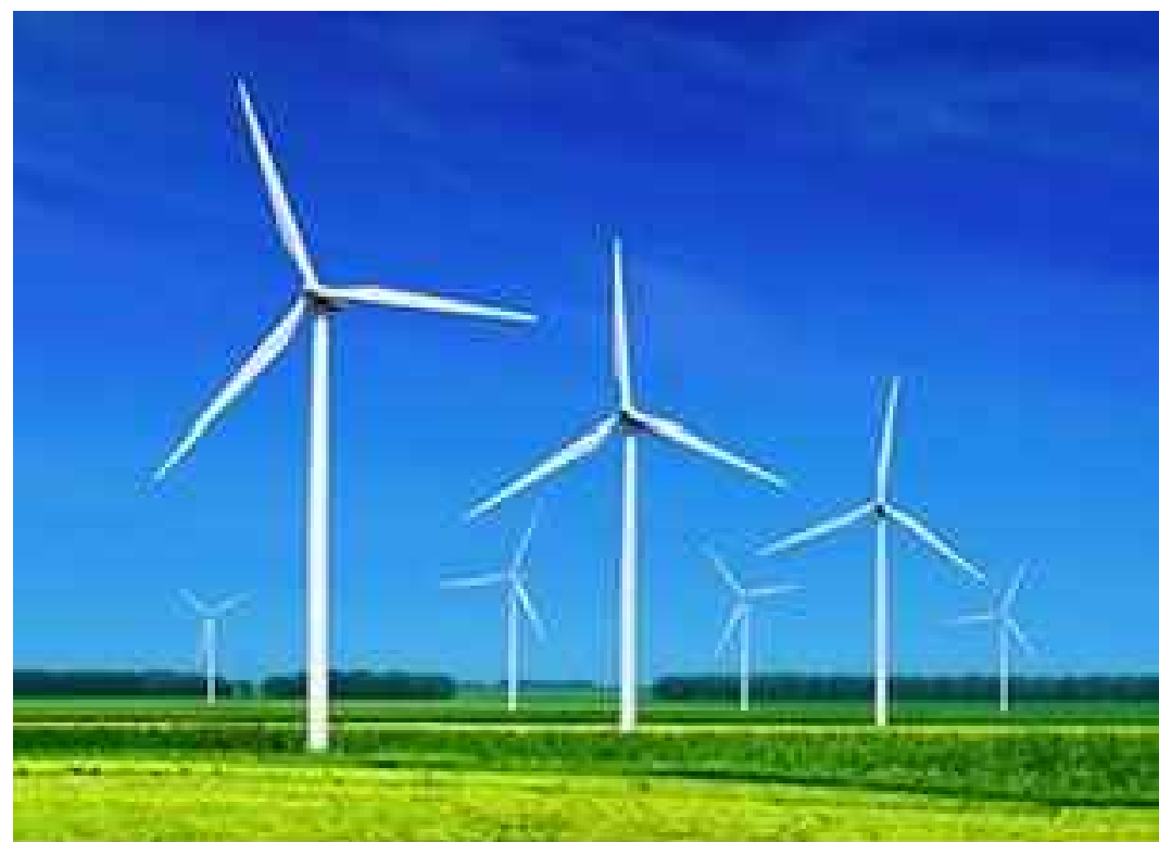
PROGETTO DEFINITIVO PARCO EOLICO "FAUCI"