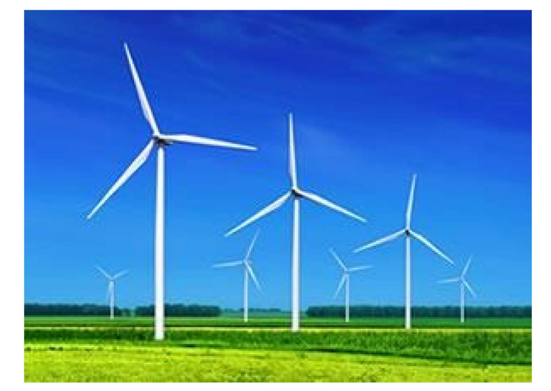
PROGETTO DEFINITIVO PARCO EOLICO "FAUCI"

TAVOLA: FA_AMB_T16.2 SCALA: 1:10000 FORMATO: A0