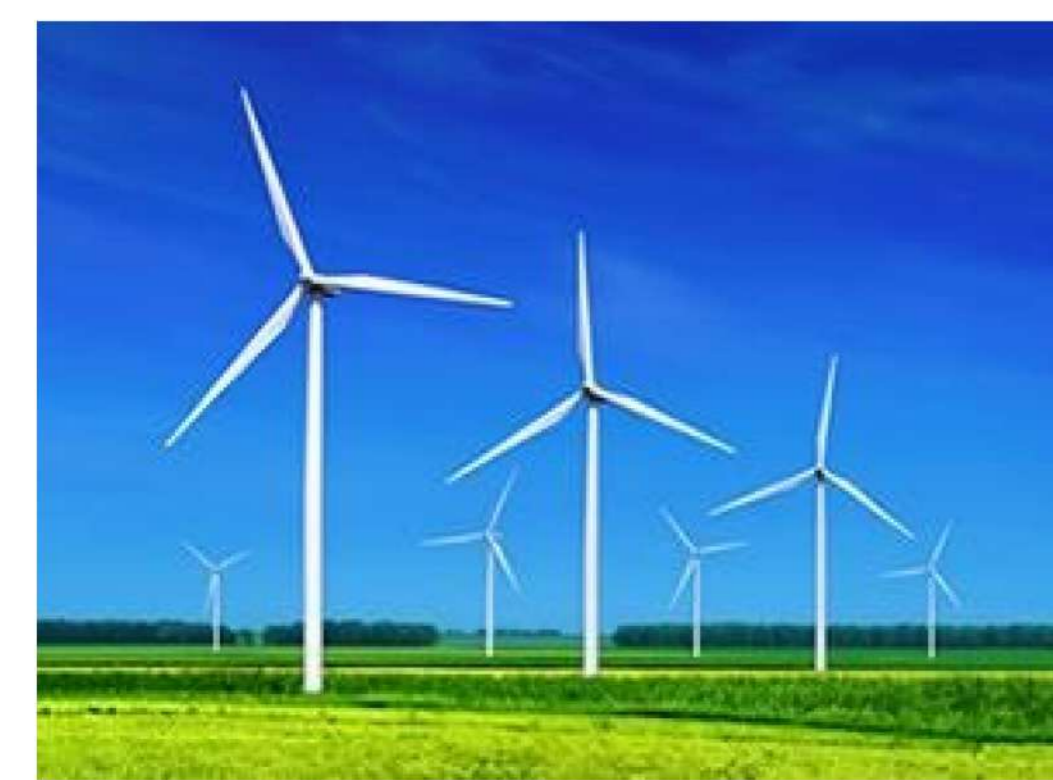
PROGETTO DEFINITIVO PARCO EOLICO "FAUCI"

TAVOLA: FA_AMB_T16 SCALA: 1:50000 FORMATO: A0