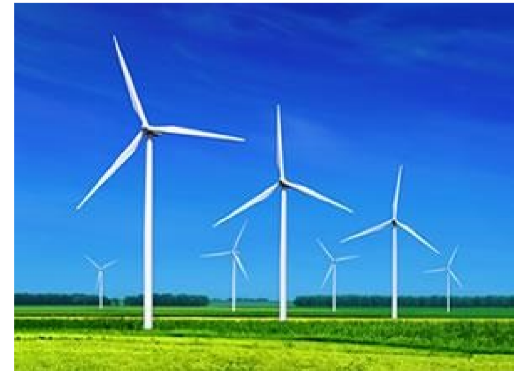
PROGETTO DEFINITIVO PARCO EOLICO "FAUCI"