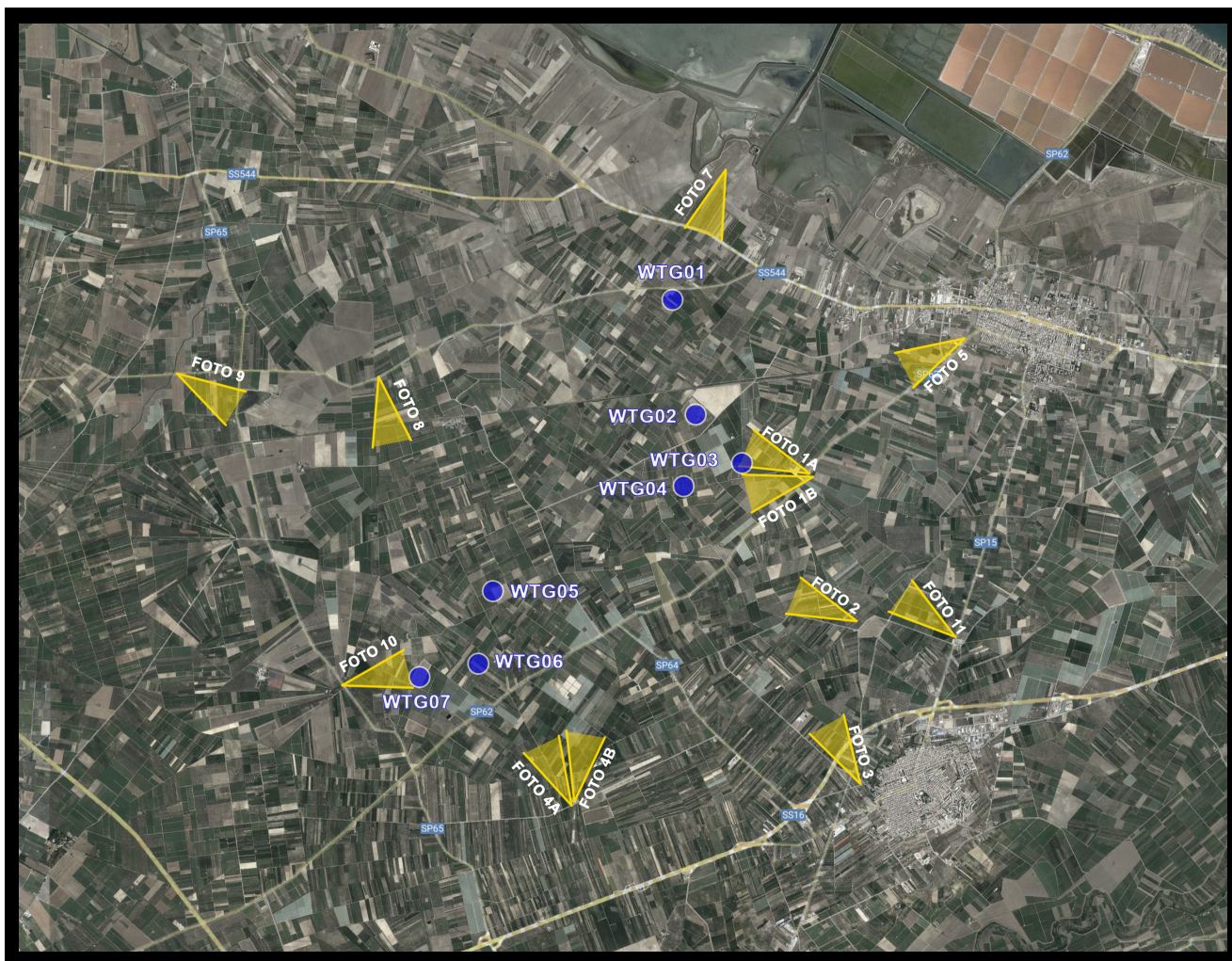
Figura 4 - Individuazione dei punti di presa fotografica dagli elementi sensibili

mentre i punti di vista da cui si è analizzata la visibilità del parco eolico di progetto sono indicati sull'ortofoto seguente, e sono stati individuati all'interno di un buffer di 10 km intorno alle torri, da alcuni dei vincoli paesistici presenti nell'area in esame: