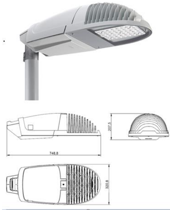
Figura 1 - esempio apparecchiatura a led – tipologico Philips Selenium

Tutti i locali saranno illuminati con plafoniere stagne, contenenti uno o due lampade fluorescenti da 18/36/58W secondo necessità.