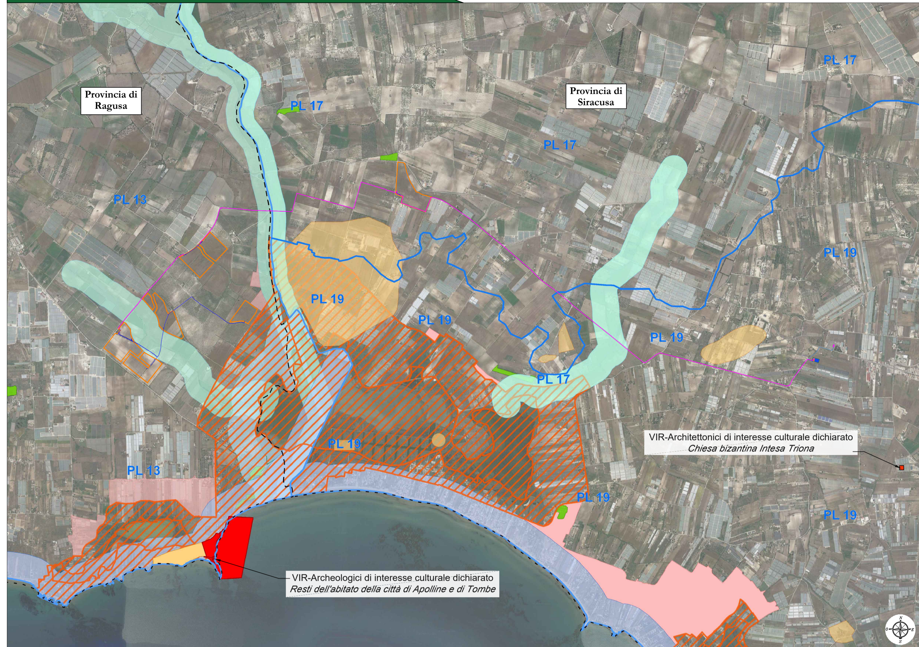
PTPR Ragusa e Siracusa - Beni paesaggistici - VIR - Scala 1:25.000