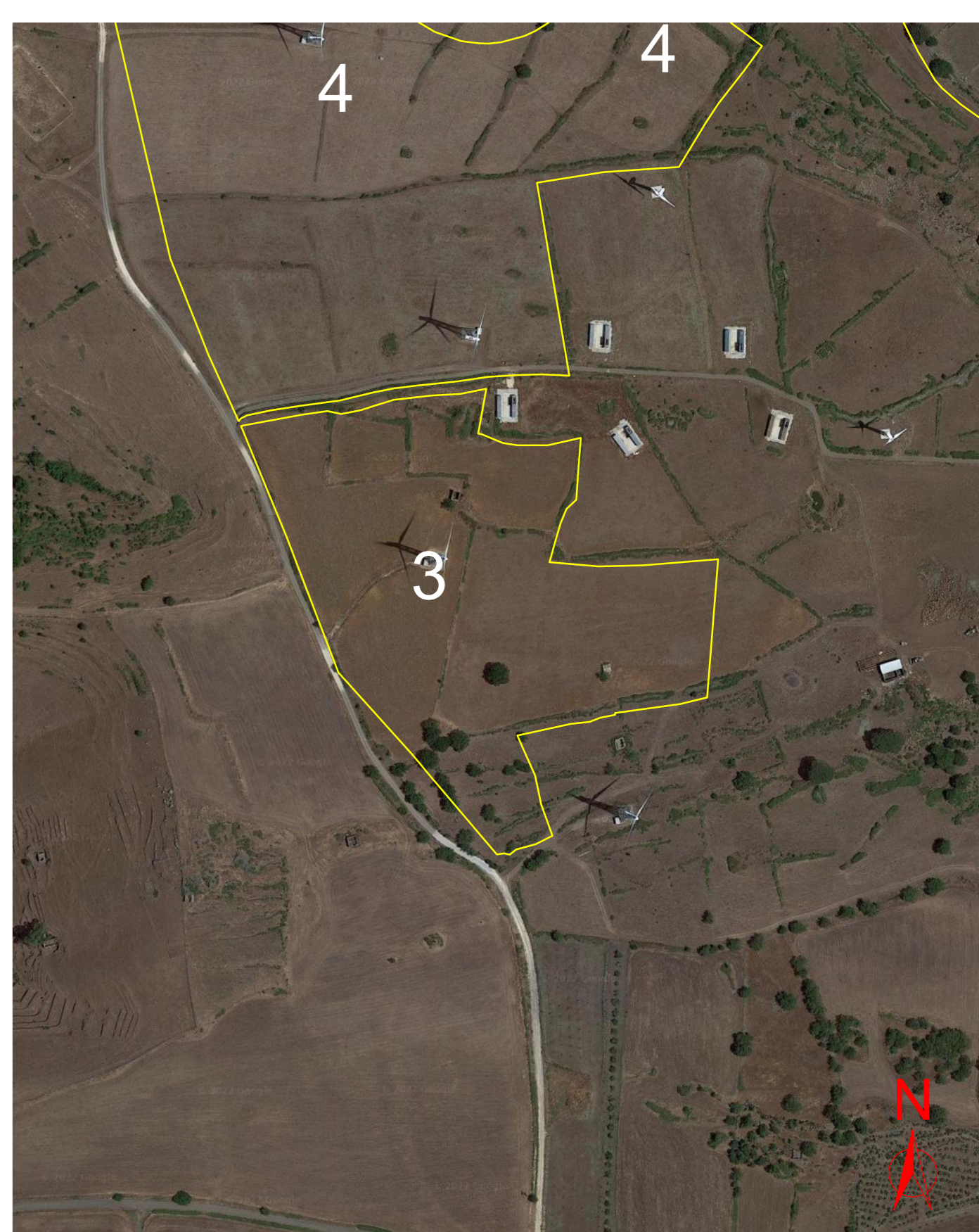
Particolare su foto satellitare AREA 3