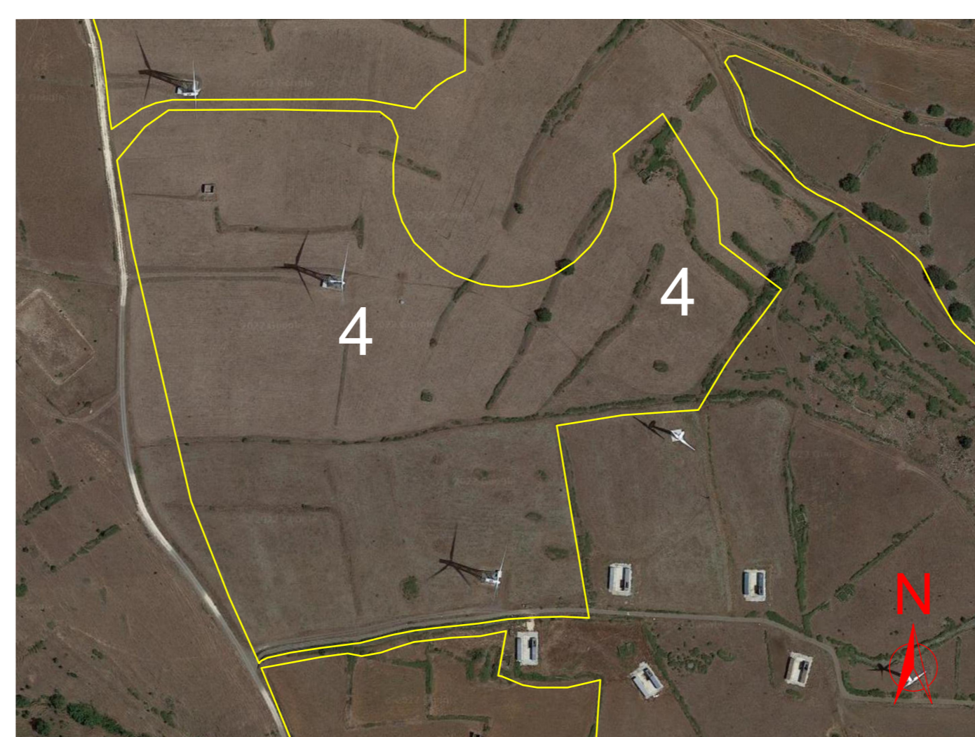
Particolare su foto satellitare AREA 4