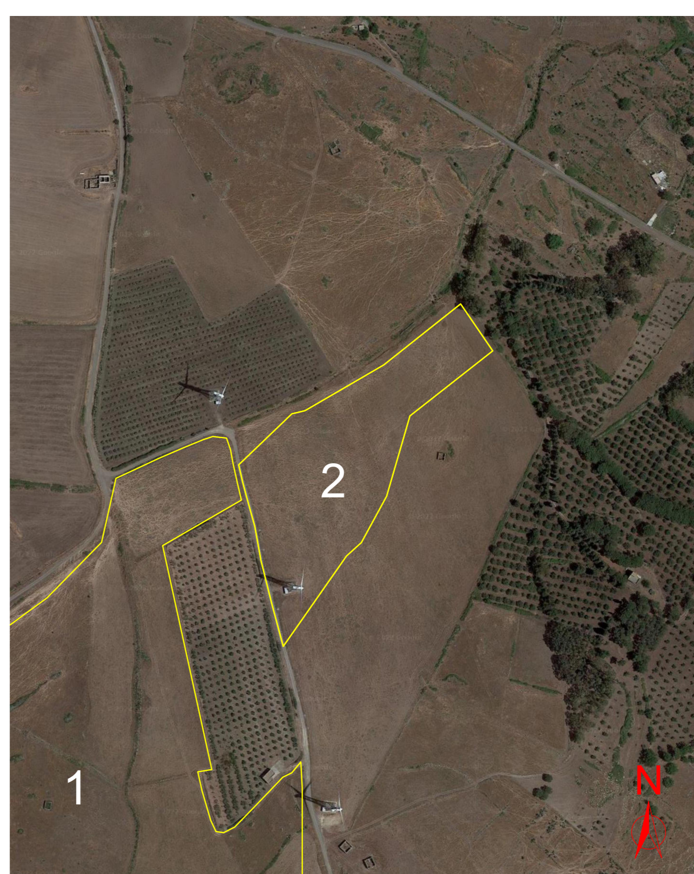
Particolare su foto satellitare AREA 2