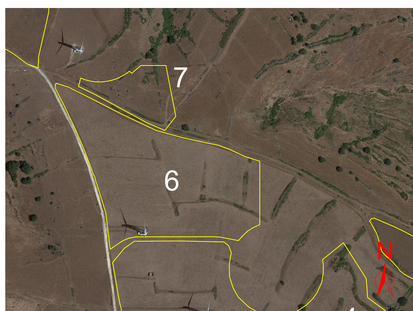
Particolare su foto satellitare AREA 6 e 7