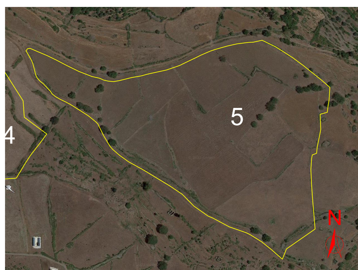
Particolare su foto satellitare AREA 5