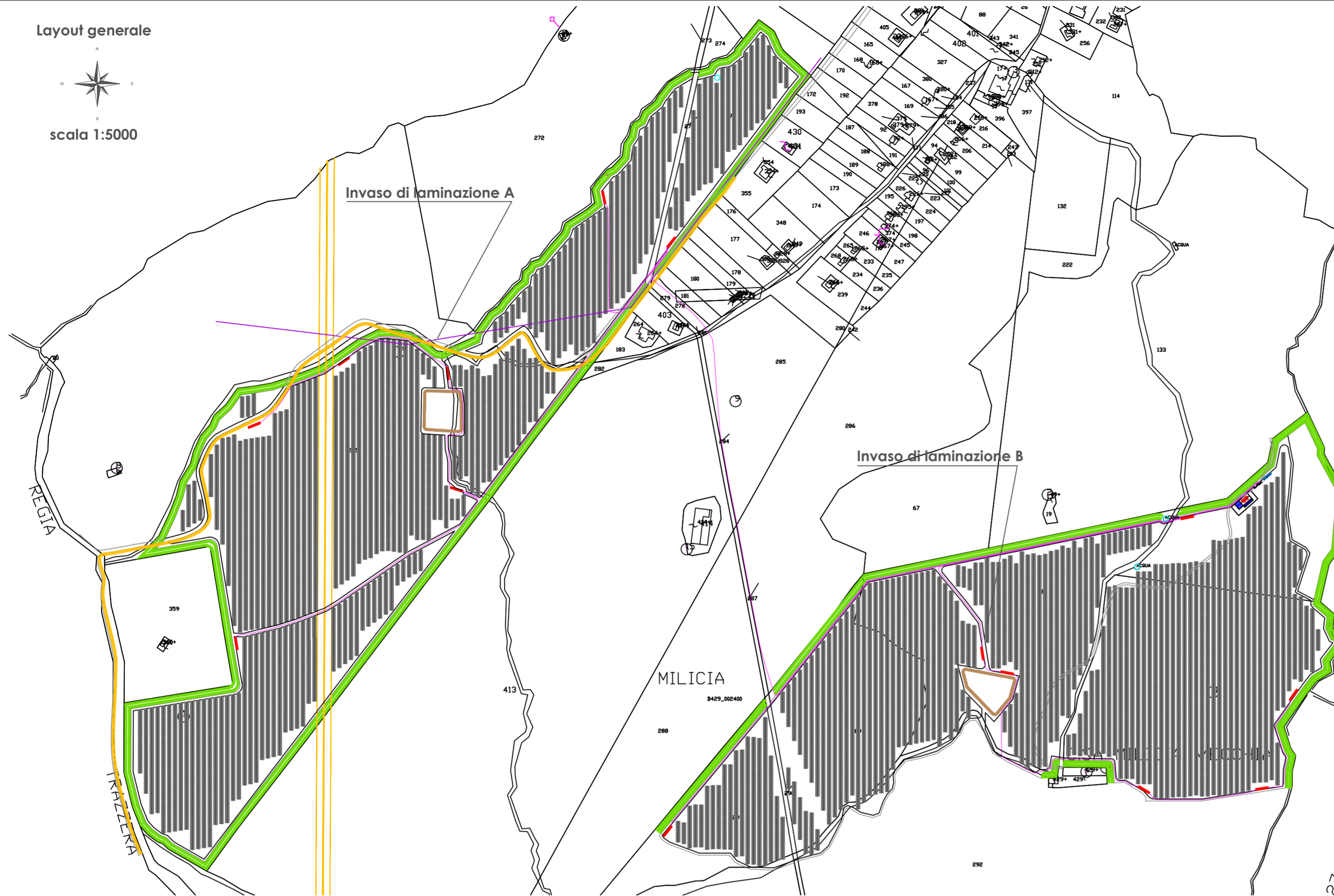
Invaso di laminazione A