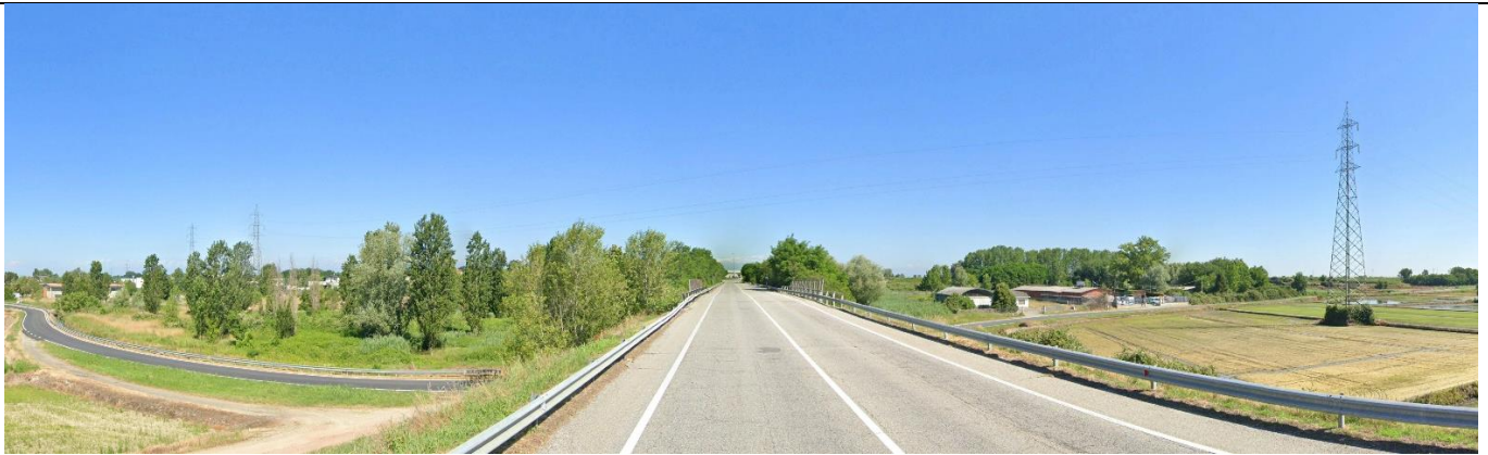
Fotoinserimento da Punto di vista F- Stato post operam