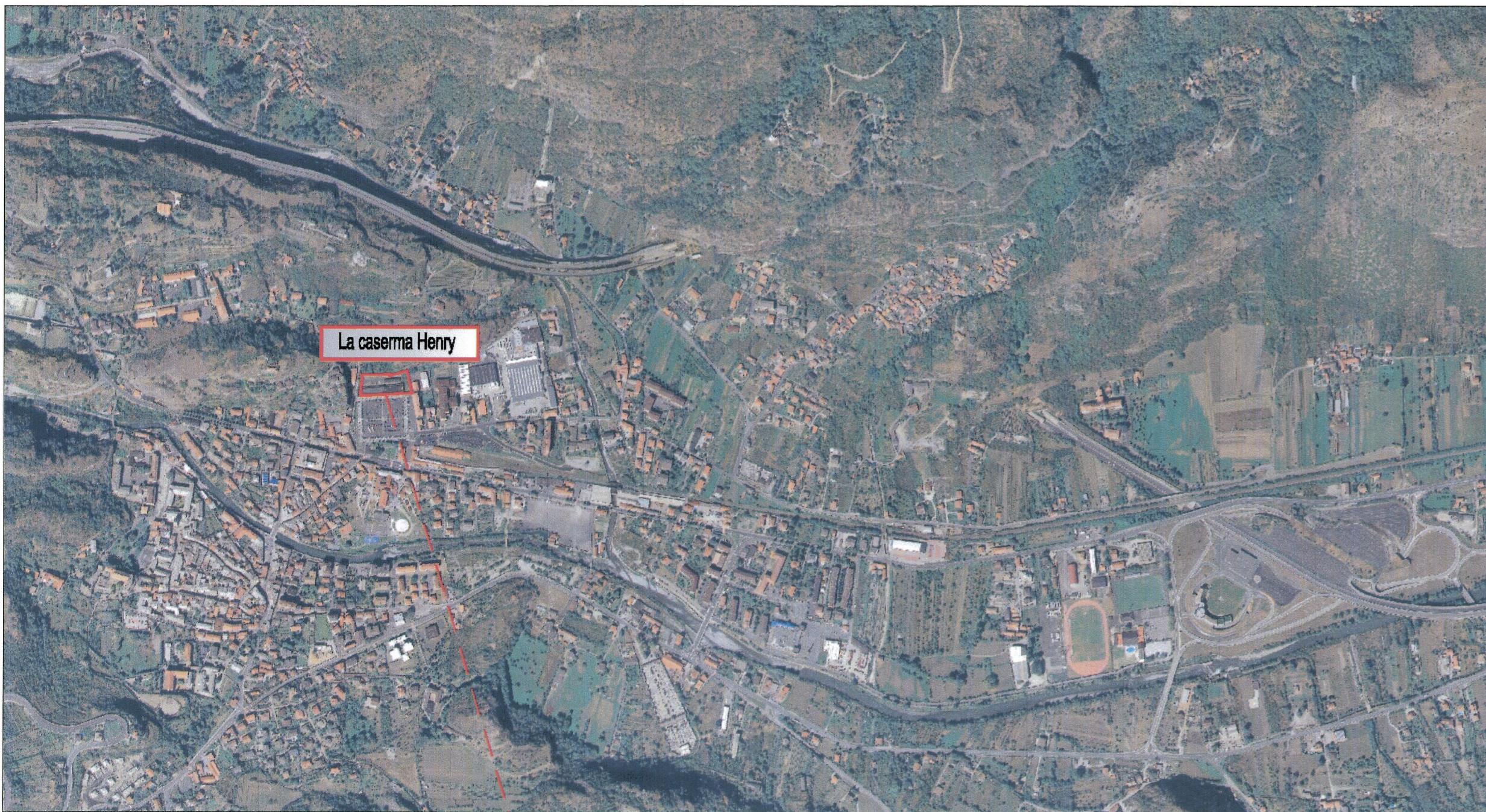
INQUADRAMENTO DI AREA VASTA SU FOTO AEREA - SCALA 1:10.000