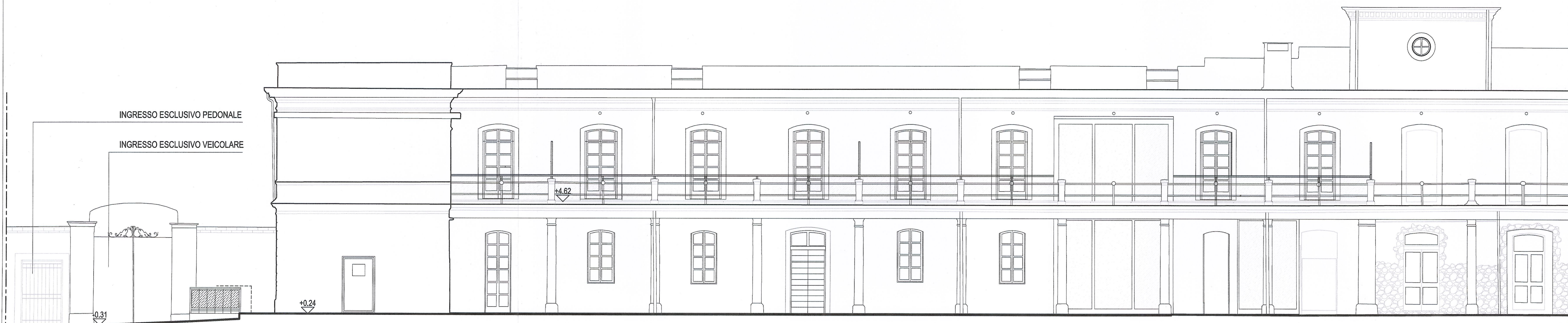
CORPO CASERMA - PROSPETTO NORD