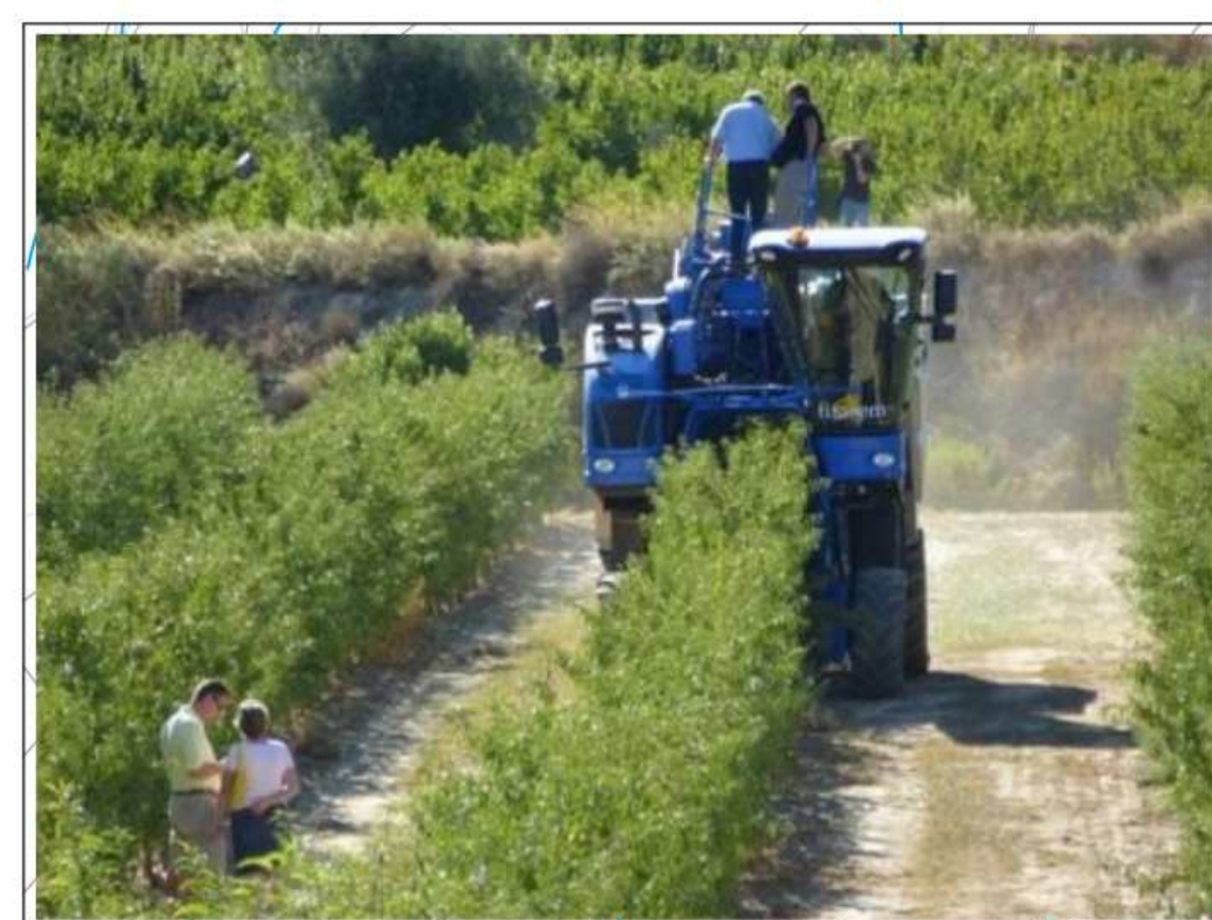
Metodo di raccolta in mandorleto superintensivo