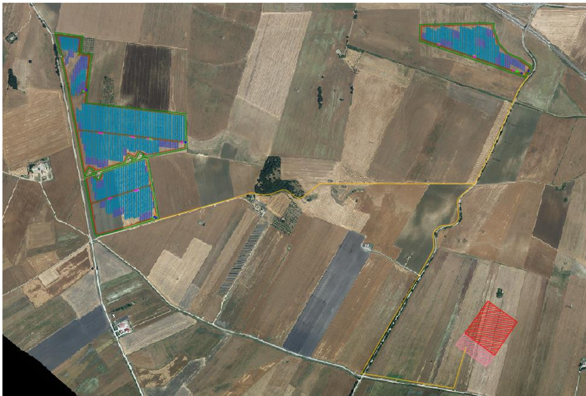
PLANIMETRIA GENERALE CAMPO FOTOVOLTAICO