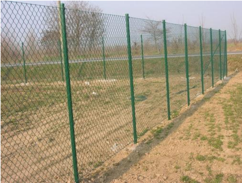
Figura 02- Esempio tipologico della recinzione perimetrale

Tale recinzione, di colore verde naturale, non presenterà cordoli di fondazione posti alla base, ma si procederà solo con la sola infissione dei pali a sostegno, ad eccezione delle zone di accesso in cui sono presenti dei pilastri a sostegno delle cancellate d'ingresso. Come sostegni alla recinzione verranno utilizzati pali metallici sagomati.