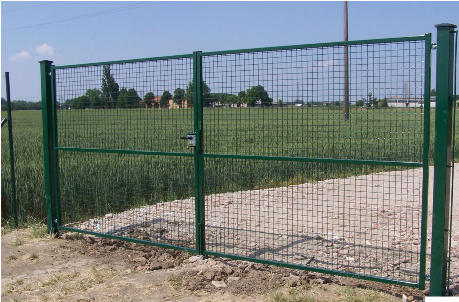
Figura 03- Esempio tipologico cancello della recinzione perimetrale

Tale recinzione, di colore verde naturale, non presenterà cordoli di fondazione posti alla base, ma si procederà solo con la sola infissione dei pali a sostegno, ad eccezione delle zone di accesso in cui sono presenti dei pilastri a sostegno delle cancellate d'ingresso. Come sostegni alla recinzione verranno utilizzati pali metallici sagomati.