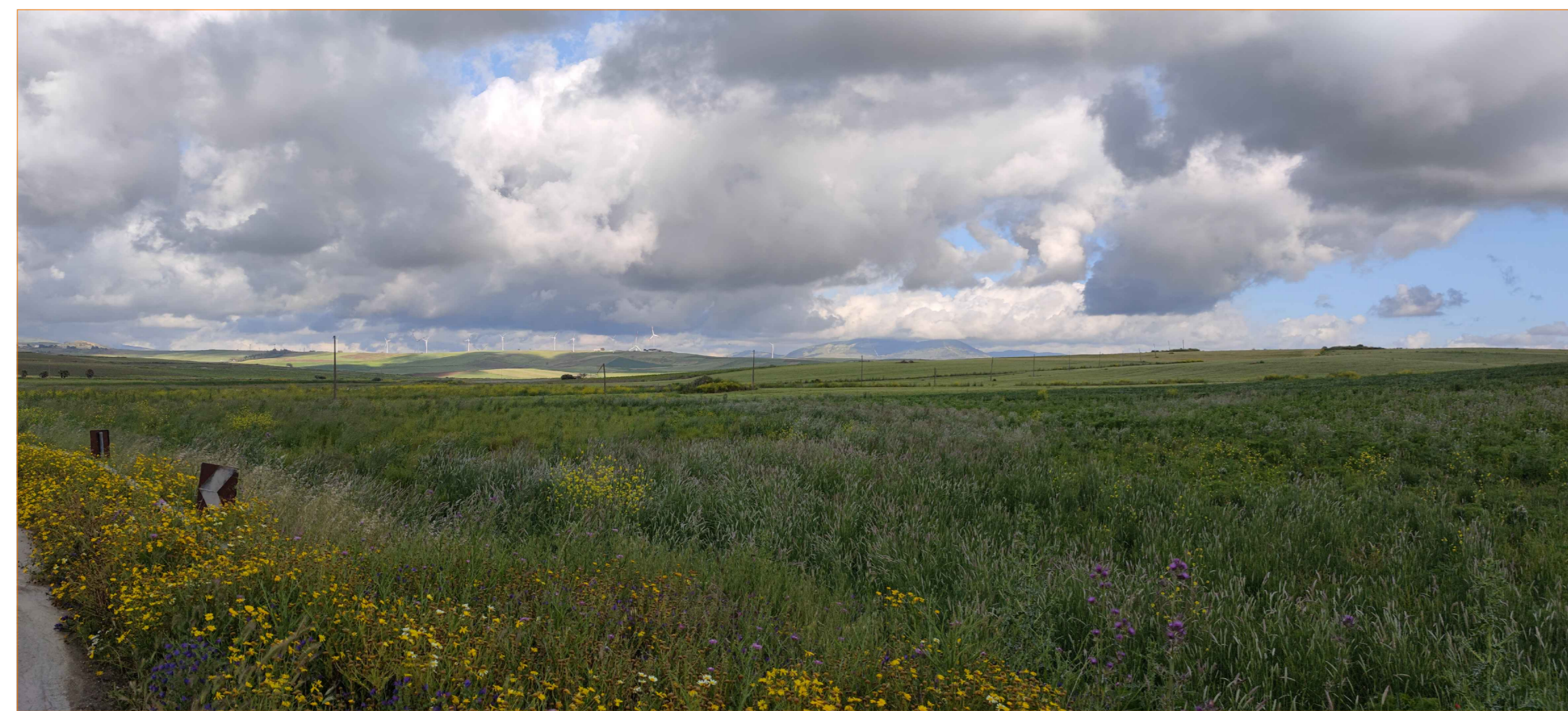
Cono ottico 1A - stato di fatto