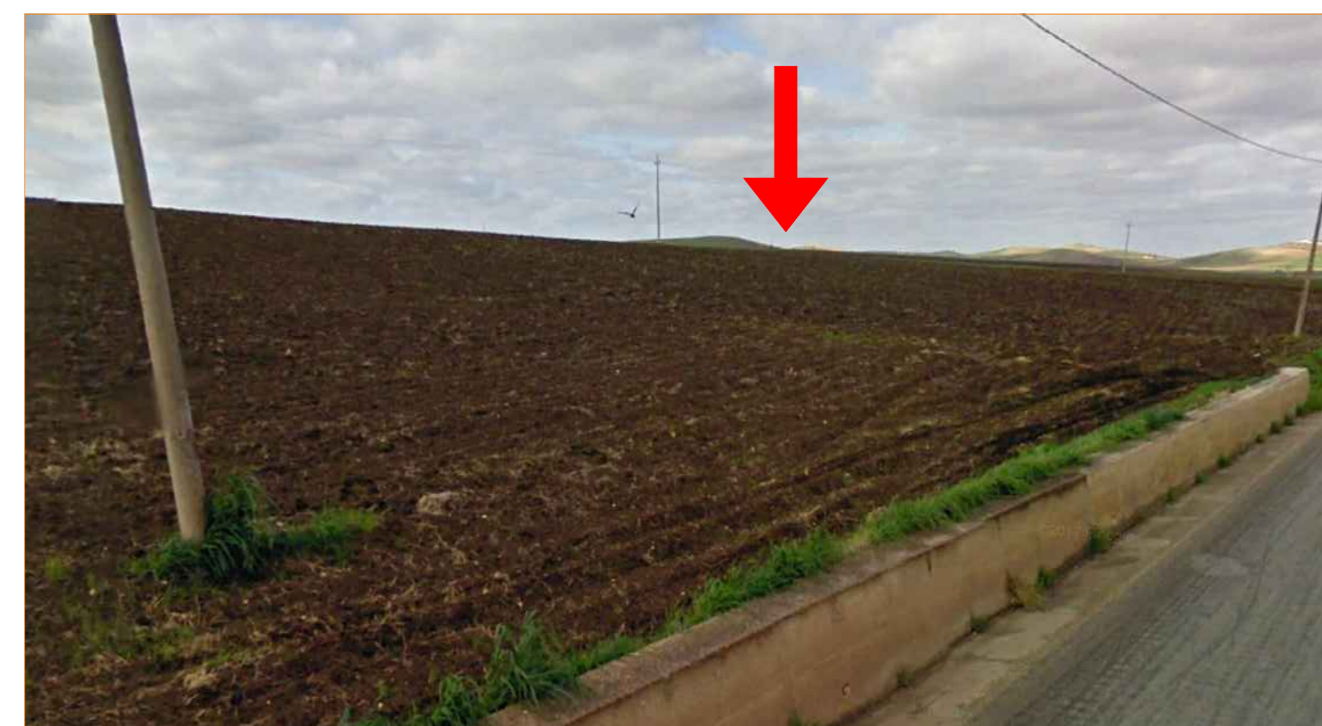
Cono ottico 1B - stato di progetto