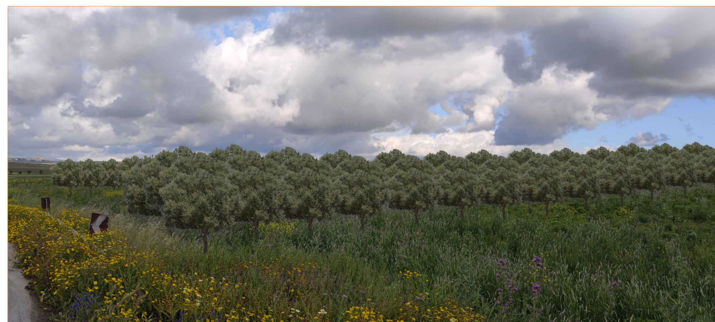
Cono ottico 1A - stato di progetto