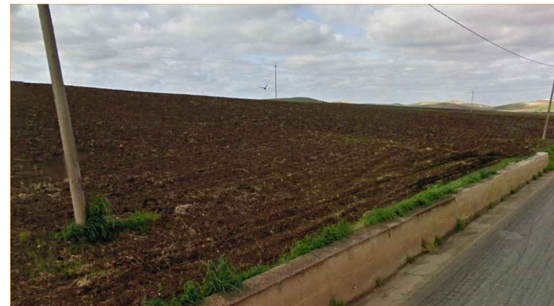
Cono ottico 1B - stato di fatto