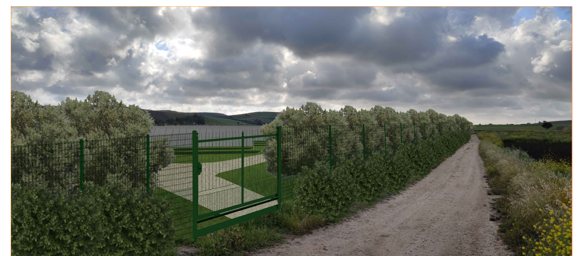
Cono ottico 2B - stato di progetto