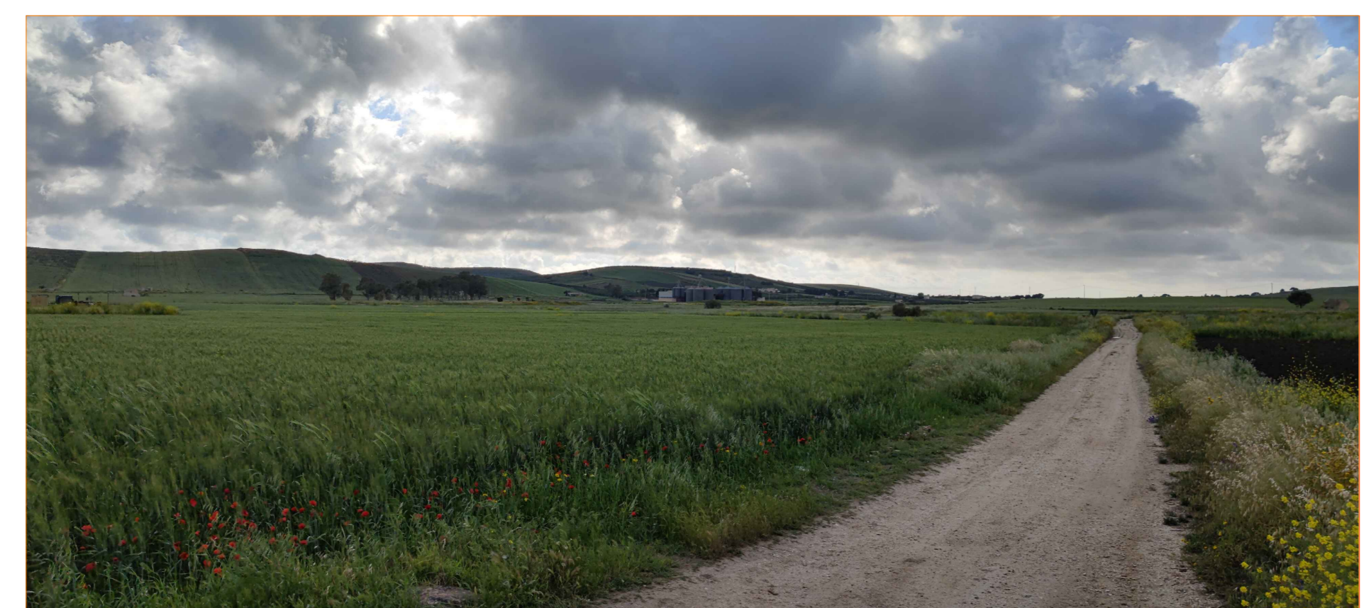
Cono ottico 2B - stato di fatto