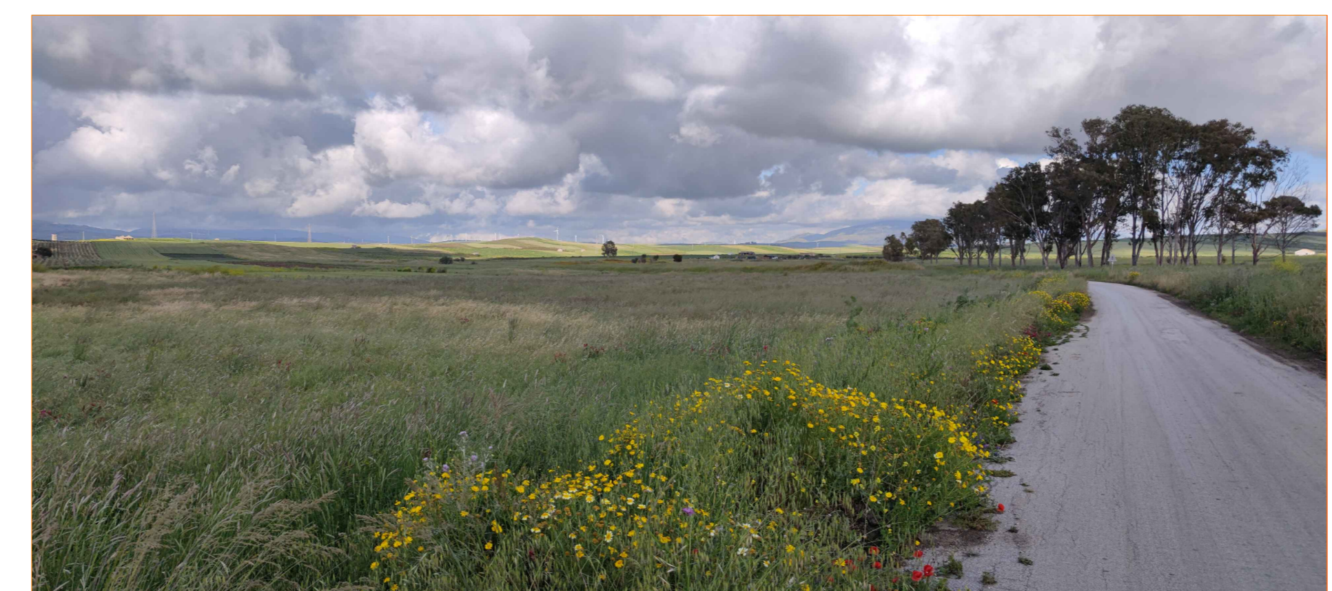
Cono ottico 2A - stato di fatto