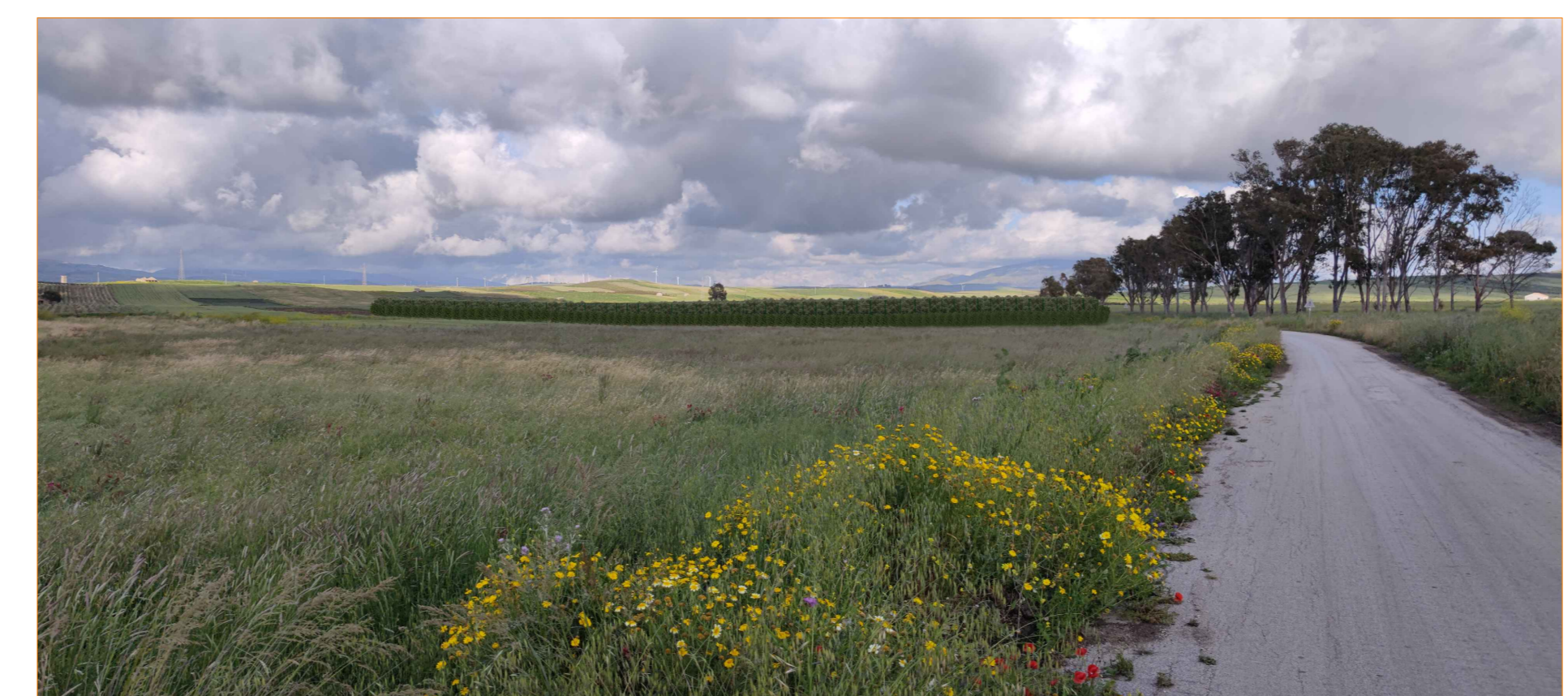
Cono ottico 2A - stato di progetto