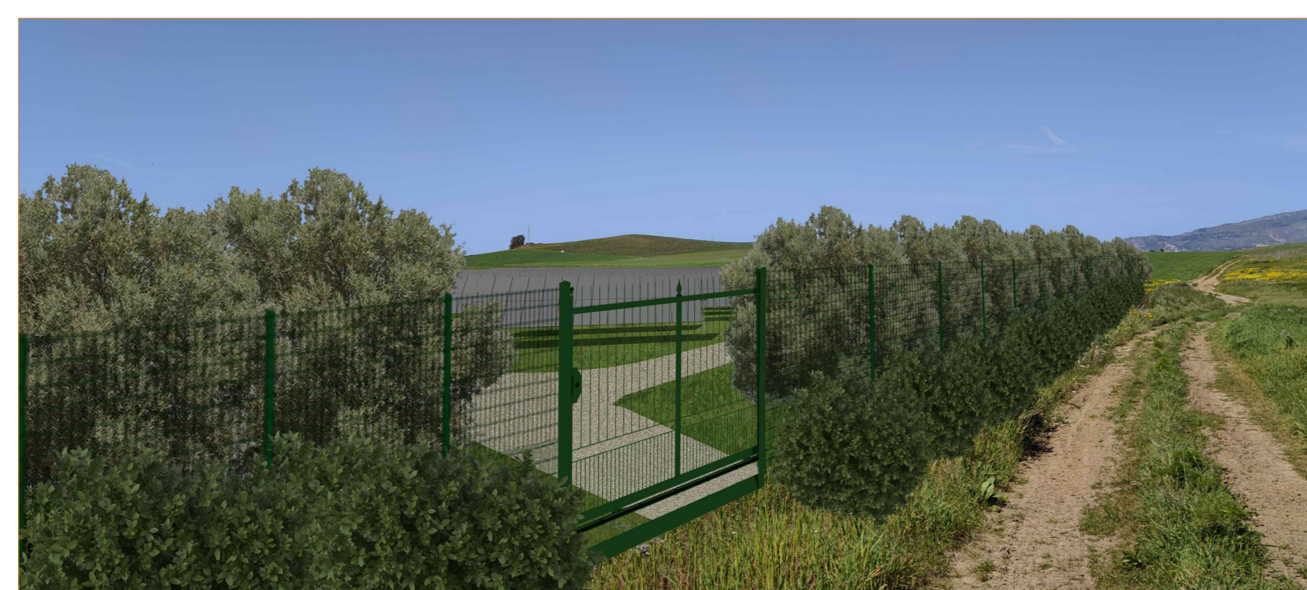
Cono ottico 3B - stato di progetto