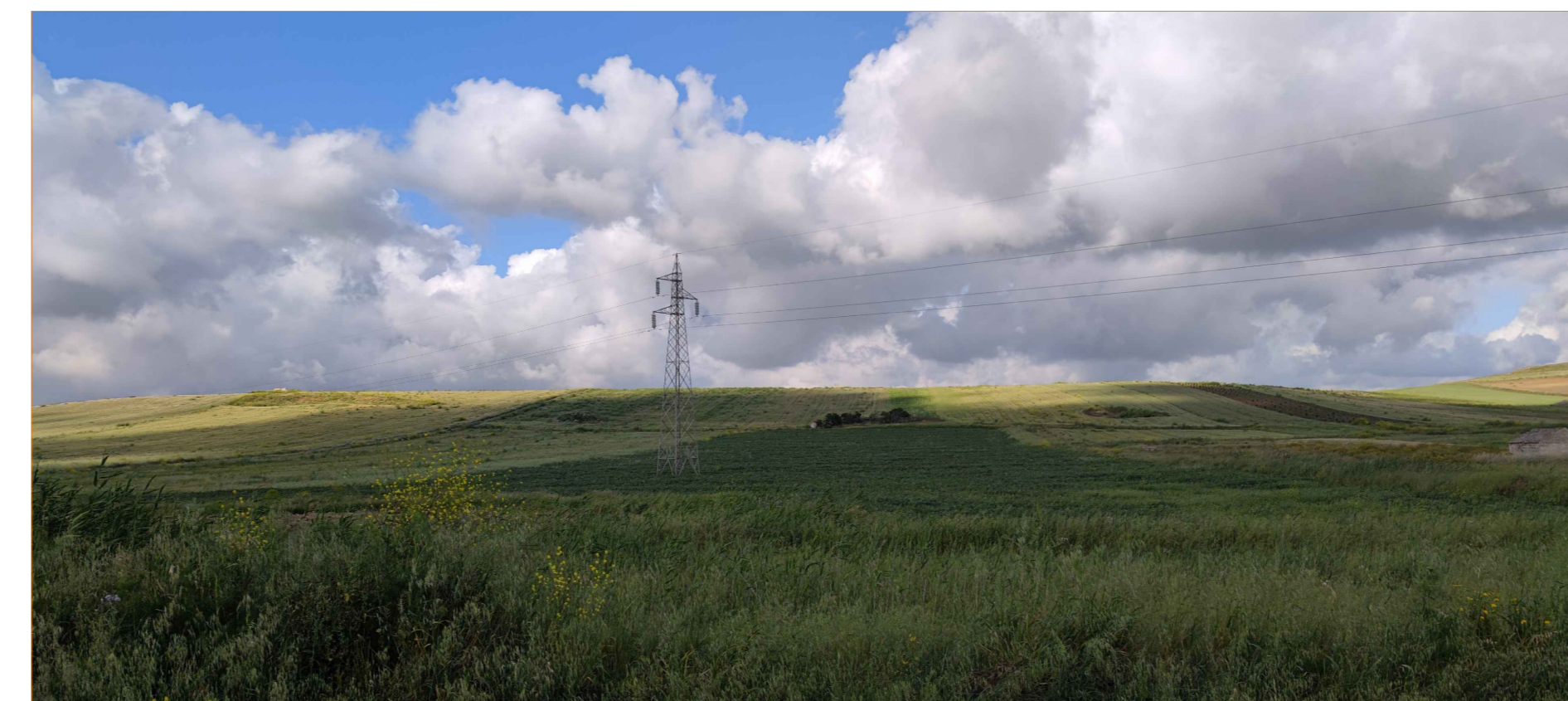
Cono ottico 3A - stato di fatto