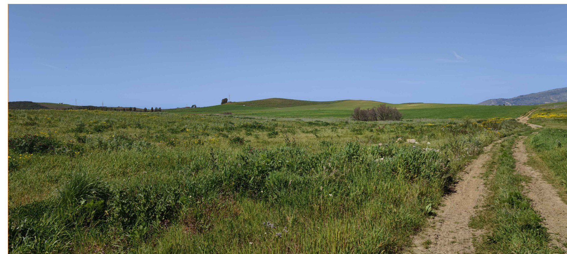
Cono ottico 3B - stato di fatto