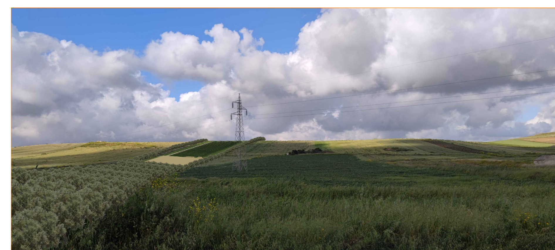
Cono ottico 3A - stato di progetto